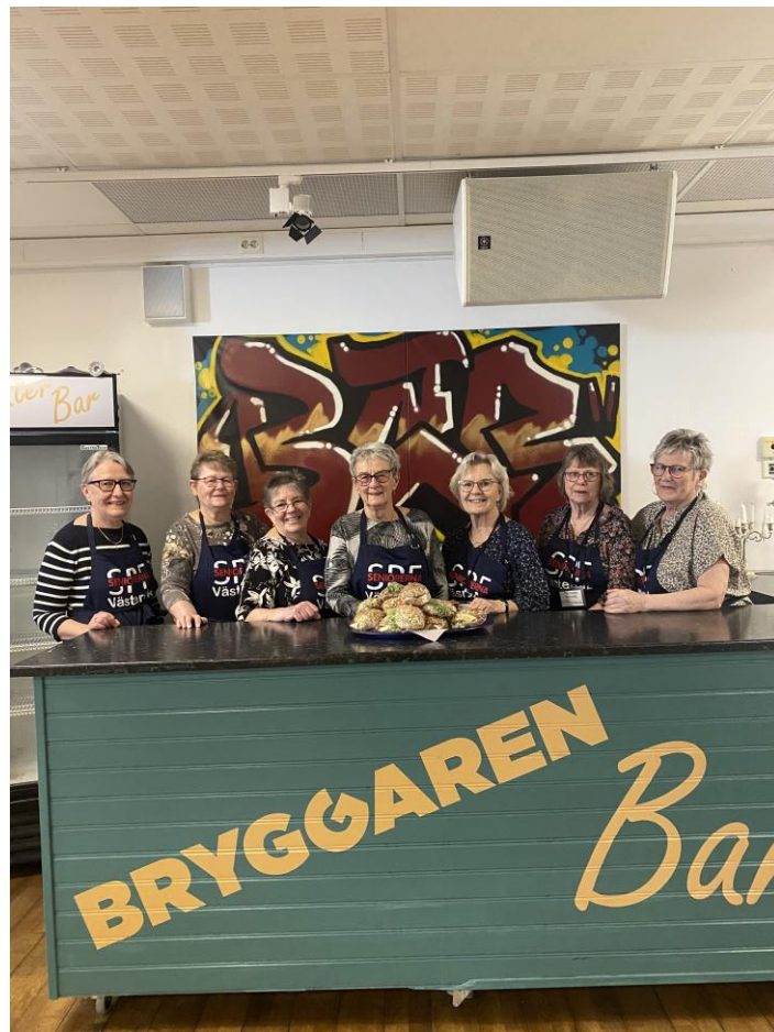
Nya Kaffekommittén fick applåder för dagens service!