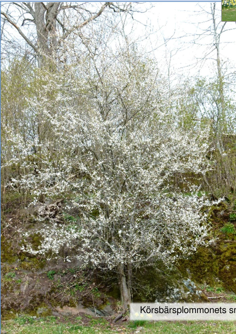
Körsbärsplommonets små vita blommor.