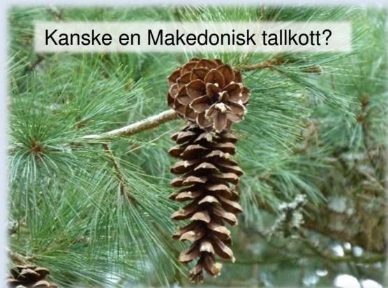
Kanske en Makedonisk tallkott?