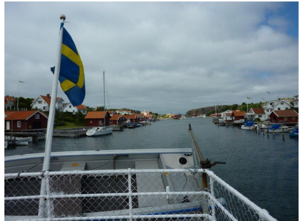
Åter i sundet mellan Hamburgön och fastlandet