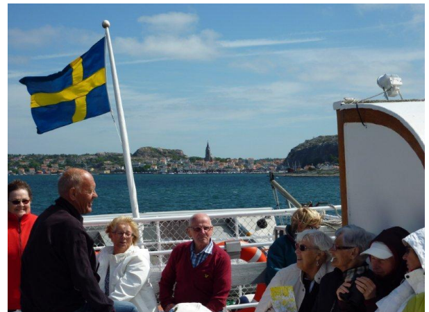
Fjällbacka på lite större avstånd