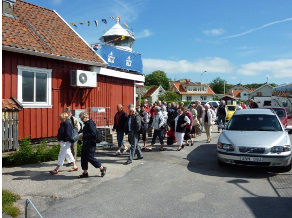
I Hamburgsund på väg mot båten

Nedan följer några bilder från resan. Ref. Leif B.