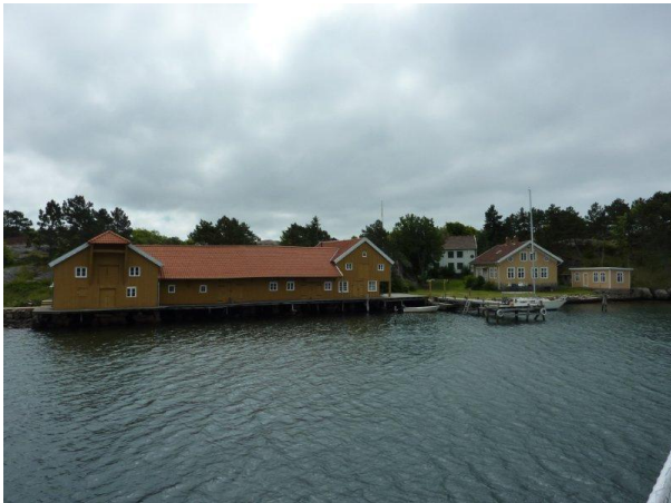
Konservfabrik och krog mm på Florön