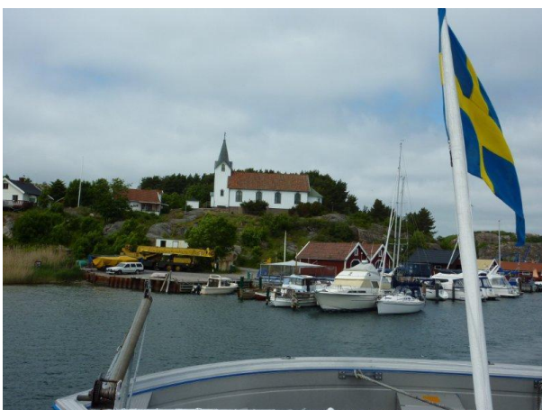
Kapellet på Hamburgön