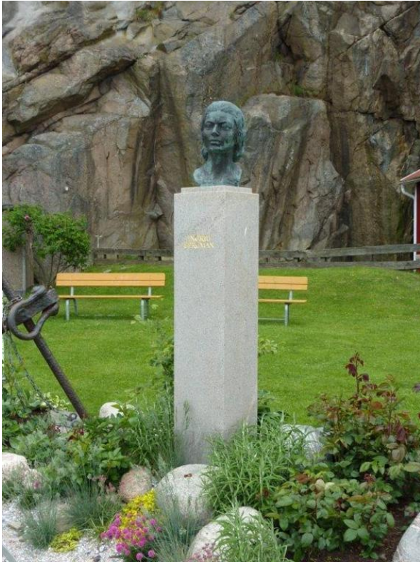
Ingrid Bergman-statyn i Fjällbacka