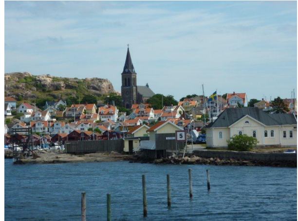
Fjällbacka från sjösidan