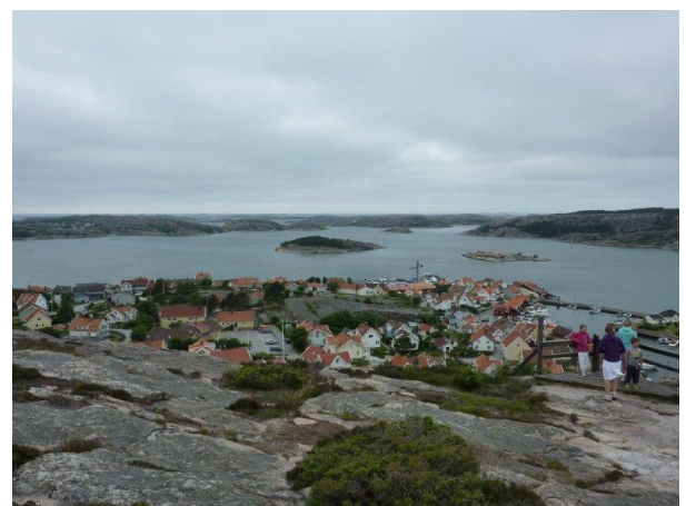
Utsikt från Vetteberget i Fjällbacka