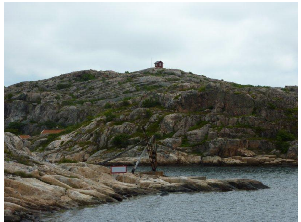
Lotsutkiken på Dyngö