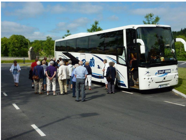
Paus på hemresan