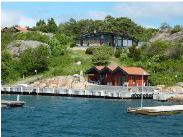
Exklusiv och modern bebyggelse på Valö