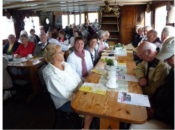
Resenärerna har tagit plats och väntar på kaffe