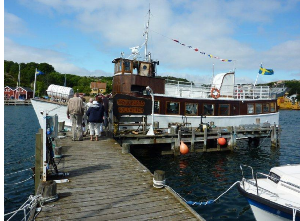
Nästan alla har gått ombord på Nollhätten