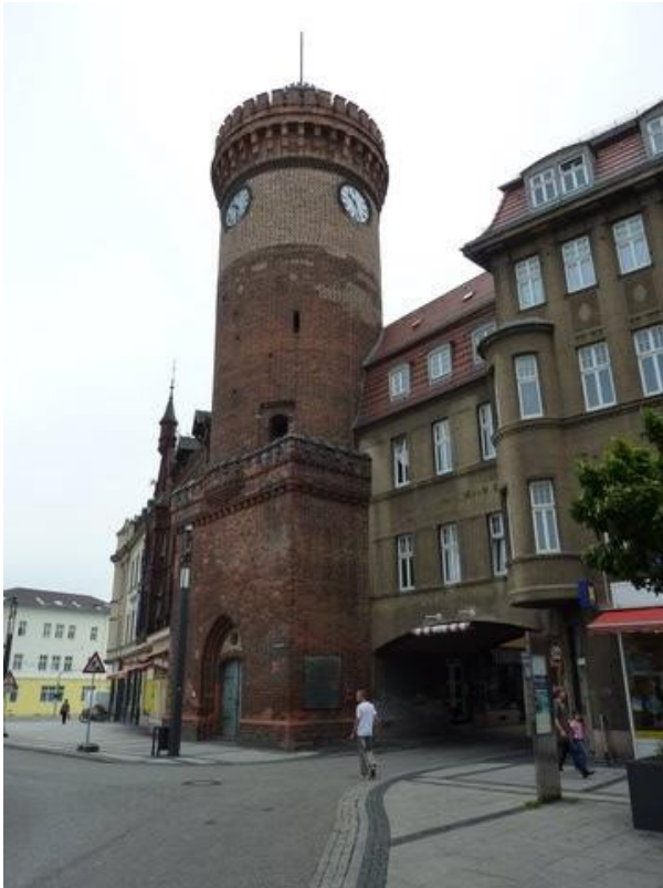
Spremberger Turm i Cottbus