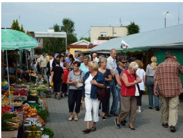
Marknaden i Stubice