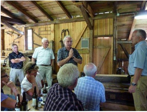
Föreläsning av sågen i Schwertzkoer Mühle