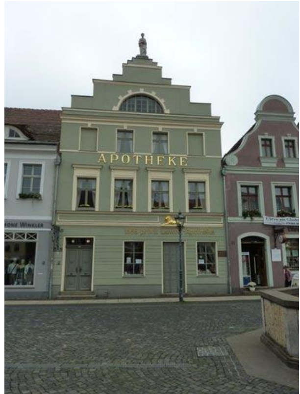
Fasad vid Altmark Platz, Cottbus