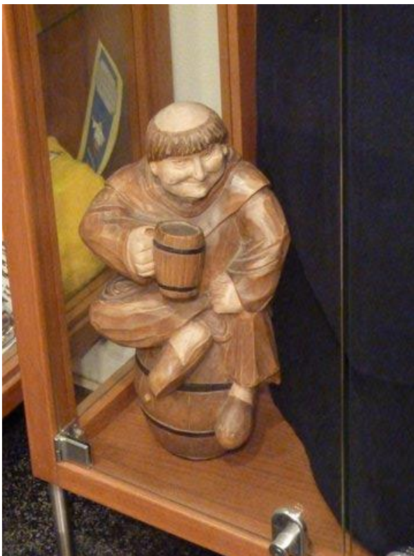
Munkarna drev tidigare Klosterbryggeriet i Neuzelle men idag är det privatägt. Den här lilla träfiguren får representera forna tiders bryggare.