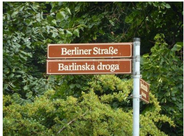
Gatunamn på tyska och sorbiska

Nedan följer olika vyer från höjdpunkten på resan, vår båtfärd i Spreewald: