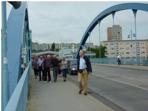
På bron över Oder in i Polen med vår guide i täten