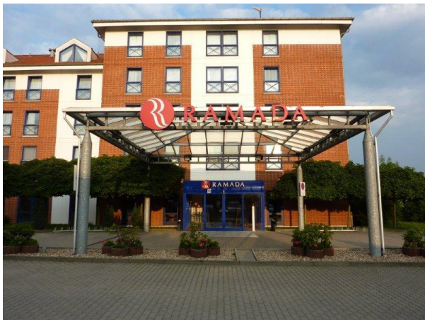
Vårt hotell Ramada utanför Frankfurt an der Oder

På eftermiddagen for vi vidare till Neuzelle och fick en förevisning i konsten att framställa öl, en tradition som pågått i mer än 400 år i klosterbryggeriet. Vidare tittade vi in i den katolska stifts kyrkan, byggd i gotisk stil med fantastiskt vacker utsmyckning..