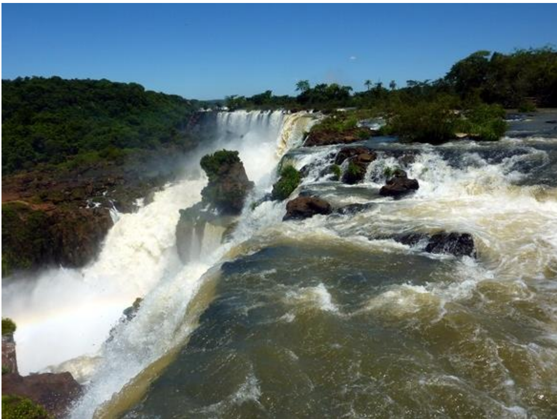
Från vattenfallen i Iguazu.