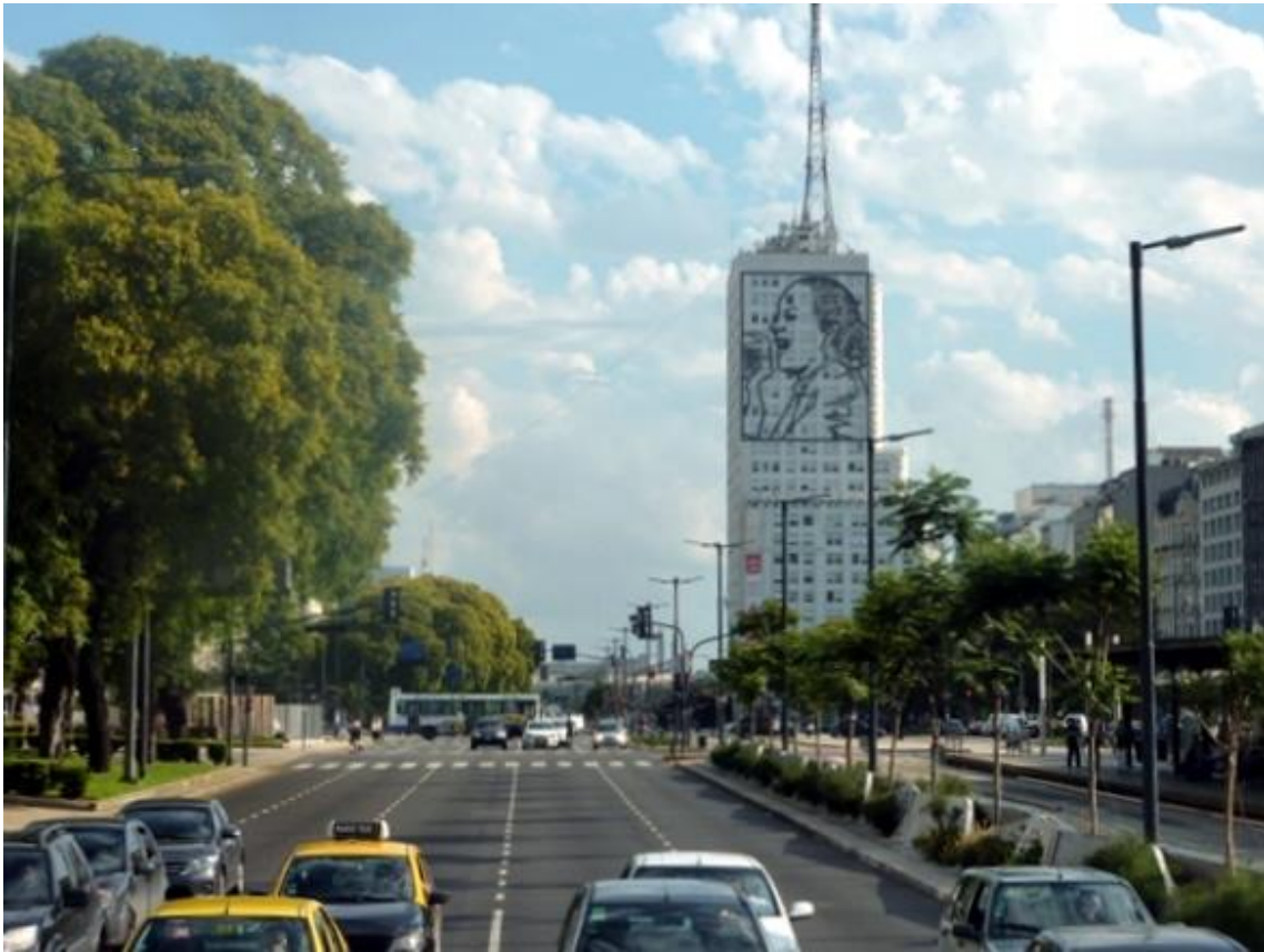
Buenos Aires med Evita Peron på husfasaden