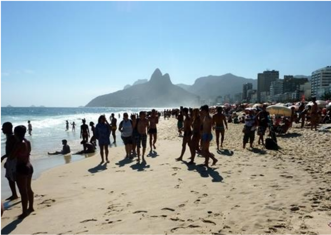
Badliv på Ipanema- stranden i Rio