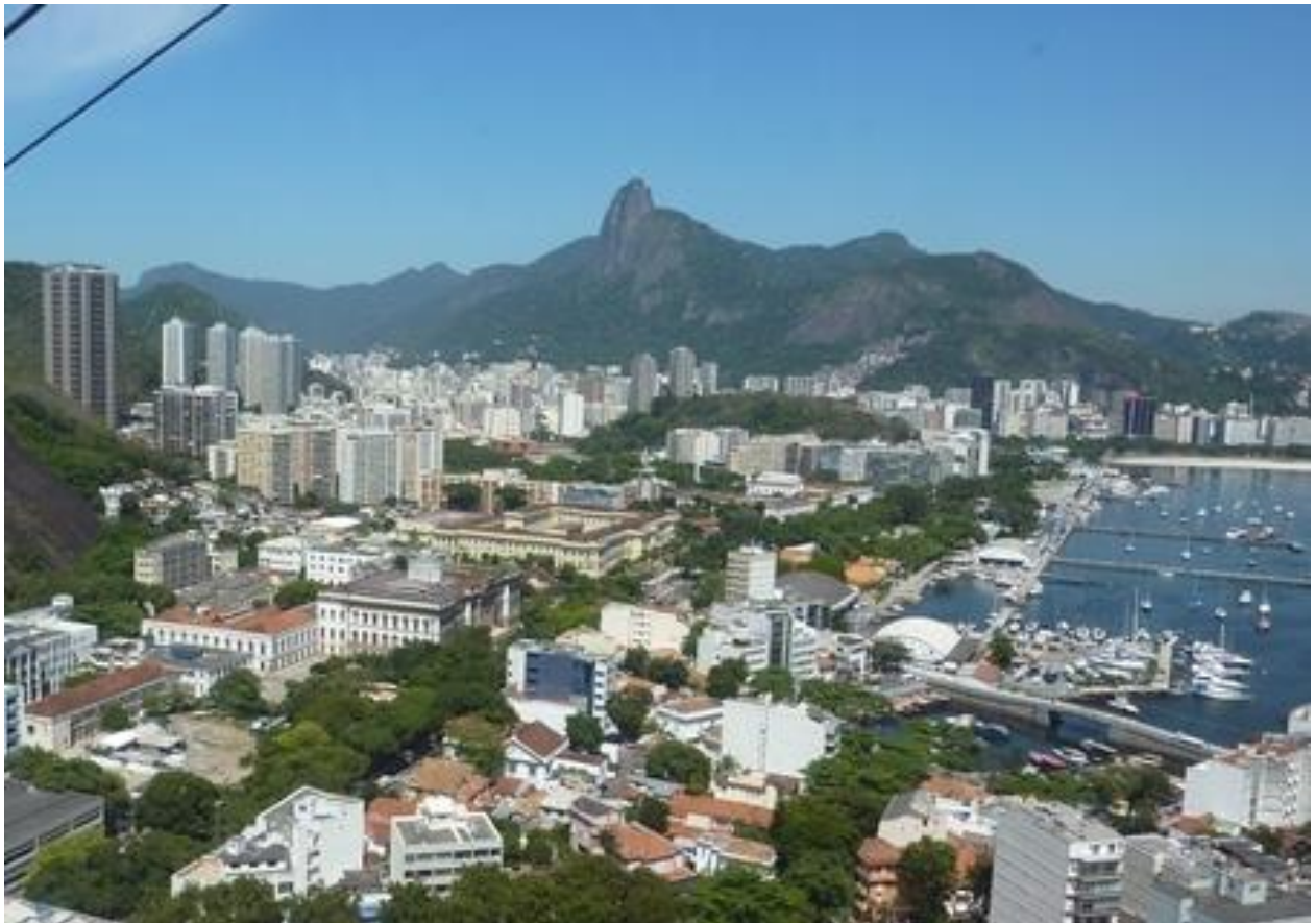
Rio de Janeiro med Kristusstatyn långt bort.

Nedan följer några bilder från Sydamerika.