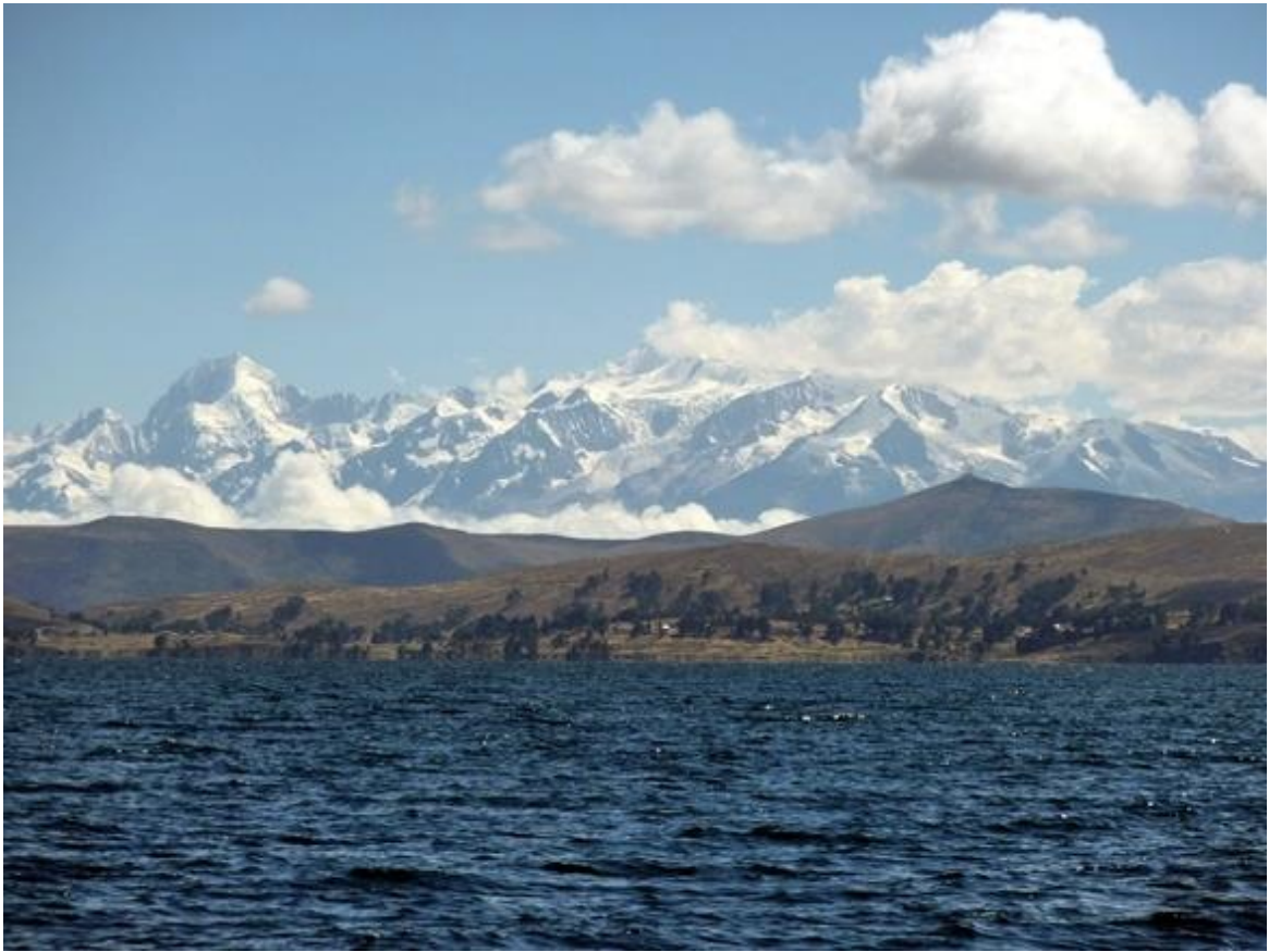
Titicacasjön med Anderna i bakgrunden