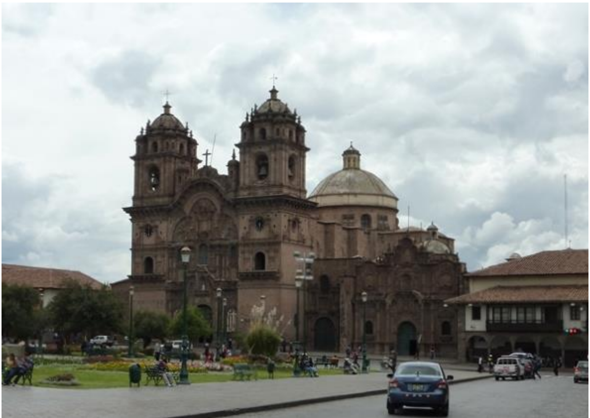
Från världsarvsstaden Cuzco, det forna Inkarikets huvudstad