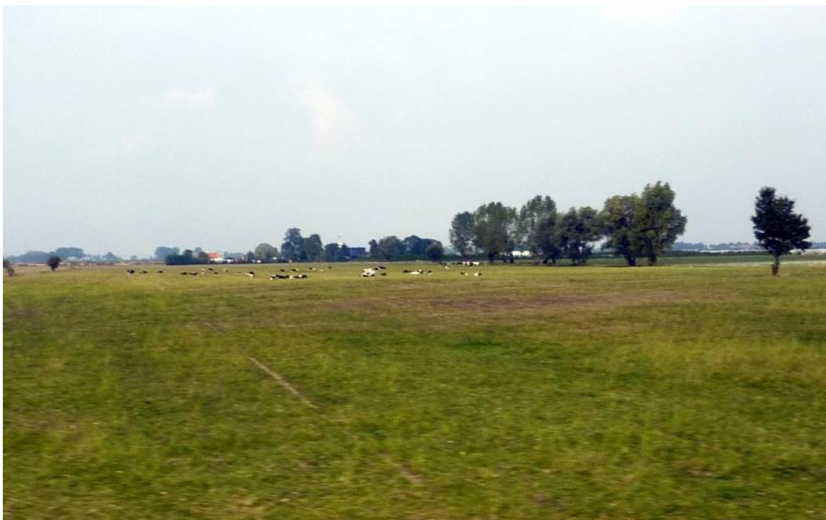
Vi har lämnat Gdansk och reser genom ett stort slättlandskap med åkermark så långt ögat kan se.