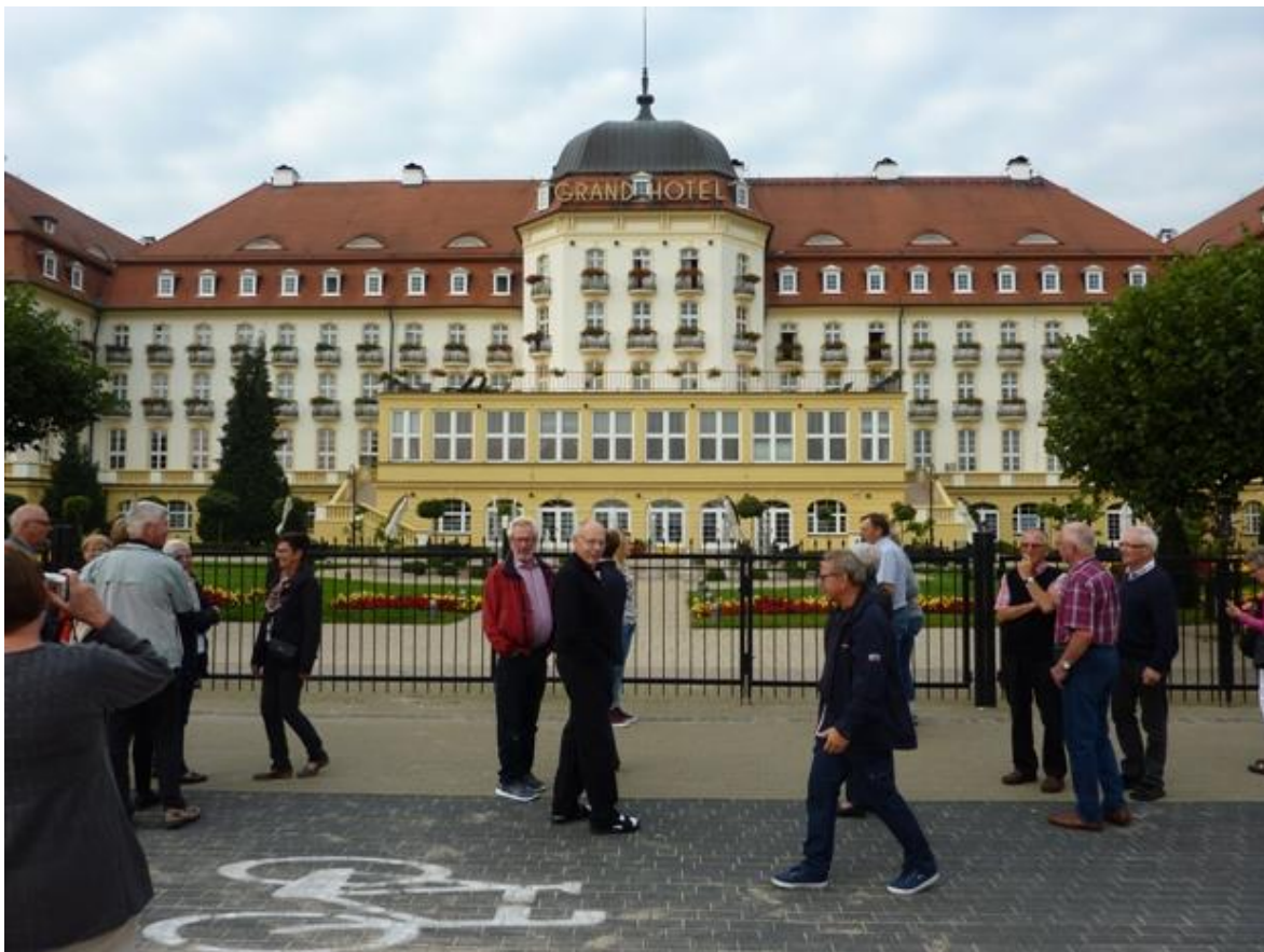
Samling framför anrika Grand Hotel i Sopot.