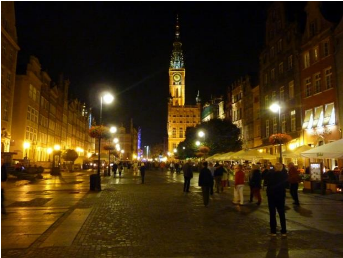
På kvällen med effektfull fasadbelysning.