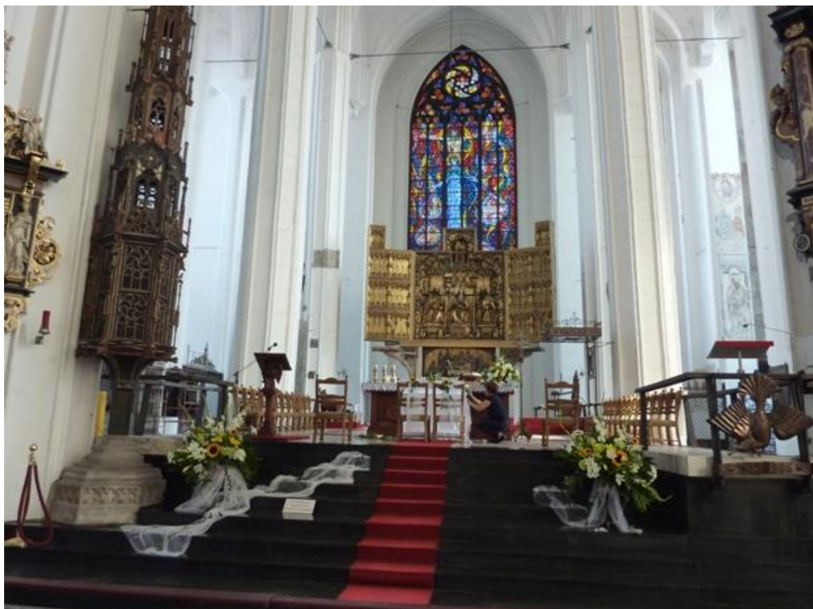
Interiör från koret.