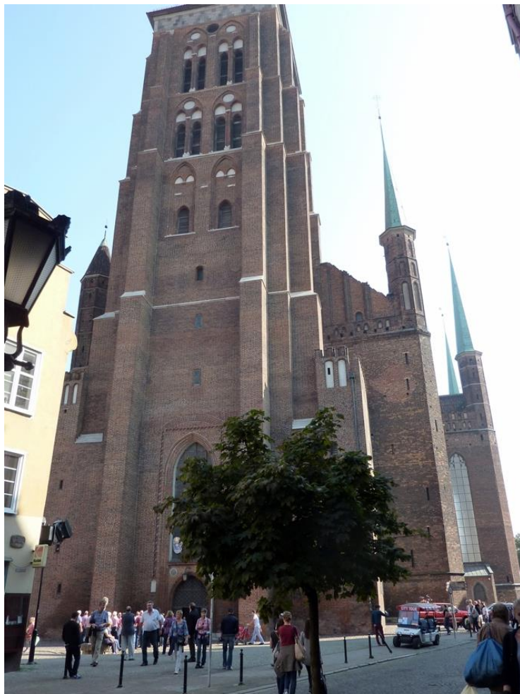
Här ses den jättestora Mariakyrkan, världens största tegelkyrka, som rymmer 25 000 besökare.