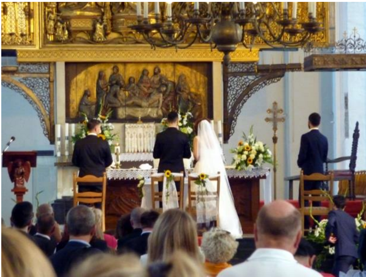
På lördagseftermiddagen var det bröllop i kyrkan med många fint upklädda bröllopgäster.