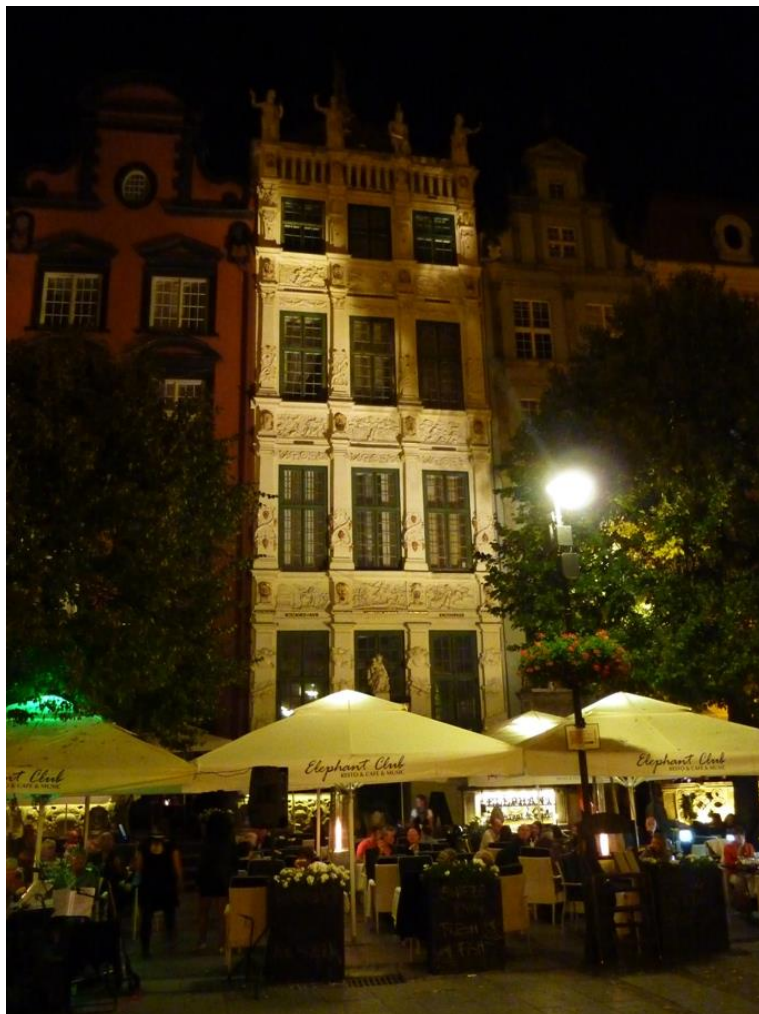
Ytterligare en byggnad i kvällsbelysning.