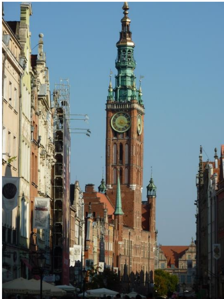
En annan imponerande och vacker byggnad var rådhuset.