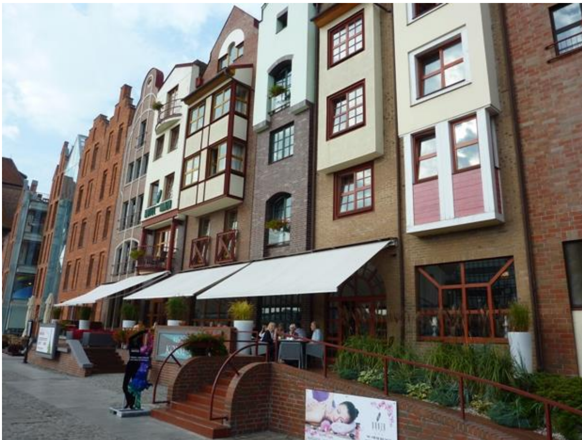
Några nybyggda fastigheter. Lagg märke till husens placering med gavlarna ut mot gatan, typiskt för Hansastäder.