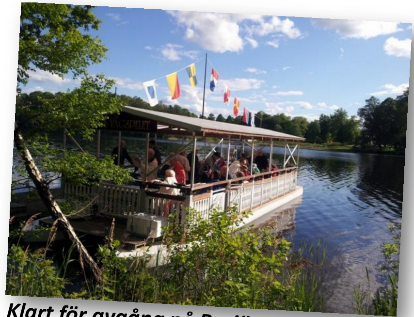
Klart för avgång på Bysjön