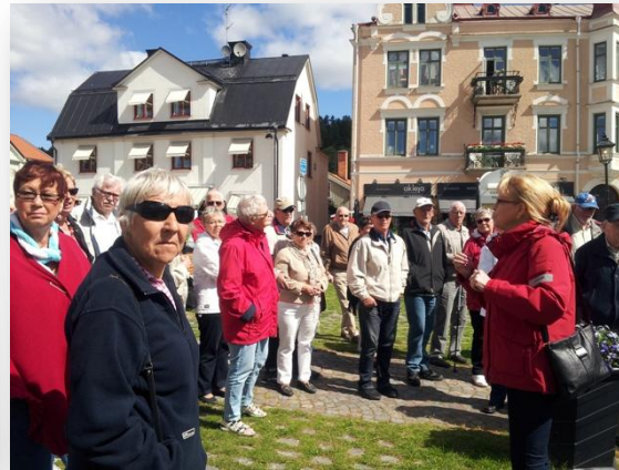
Samlade i Söderköping