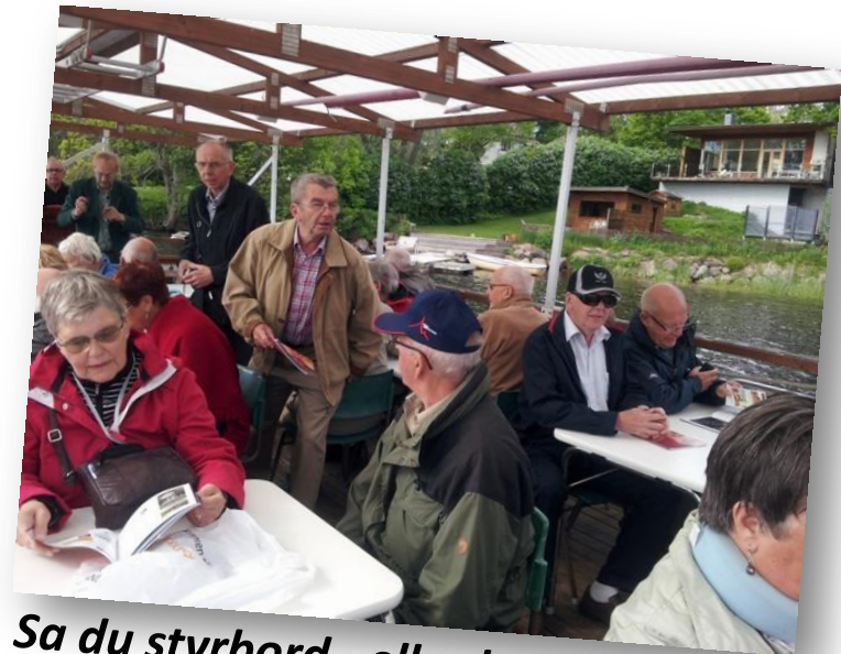
Sa du styrbord , eller babord?