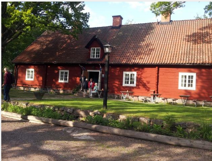
Väl i land satt det fint med eftermiddagskaffe på Hembygdsgården.