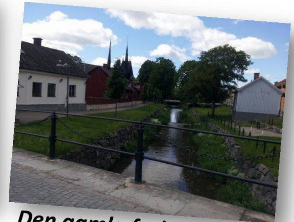
Den gamla farleden genom Söderköping