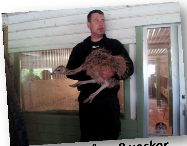
Strutsbaby på ca 8 veckor