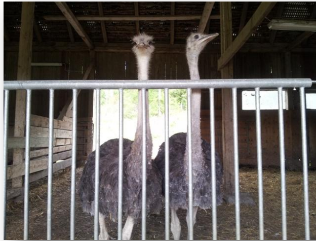
Ett par med örnkoll