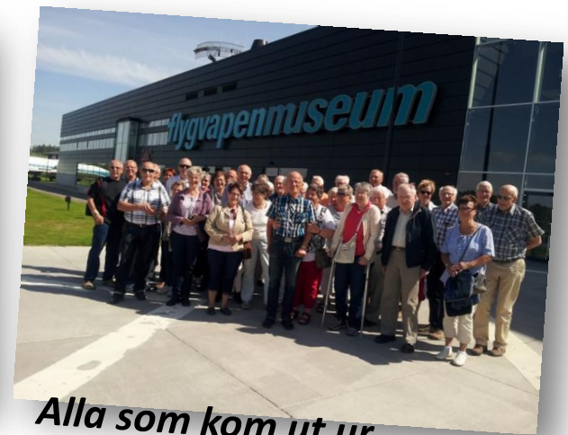
Alla som kom ut ur museet