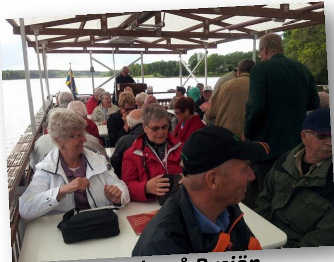
En skön runda på Bysjön