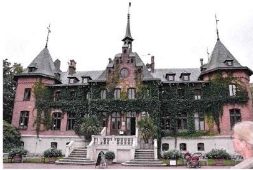
Högt upp i tornspirorna klättrade Kronprins Gustav Adolf på Sofiero

Prins Bertil vrider reostaten på högfrekvensdelen, Prinsessan Ingrid vrider en reostat på mottagardelen