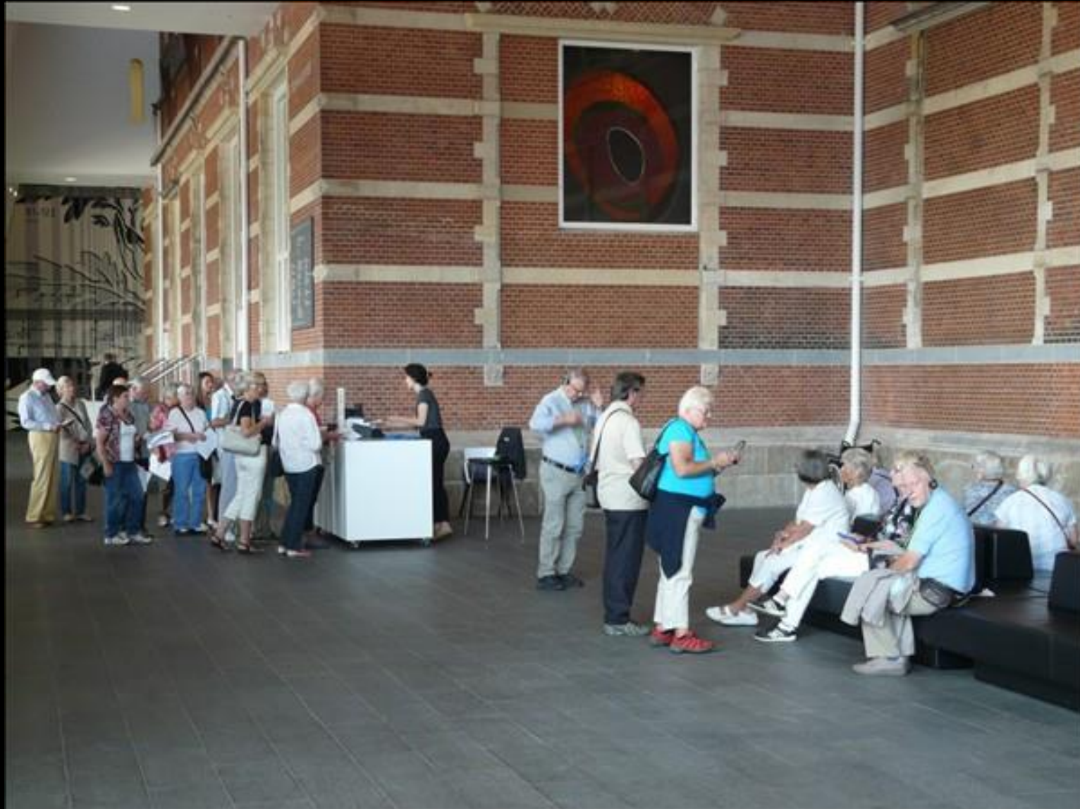
Här hyr vi audioguidetrustning