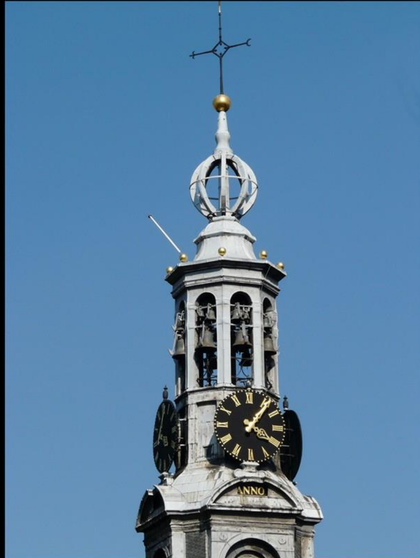
Tornet på Munt Plain