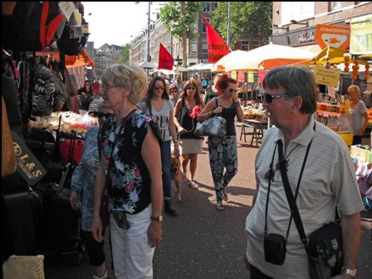
Marknadsgata utmed flera kvarter