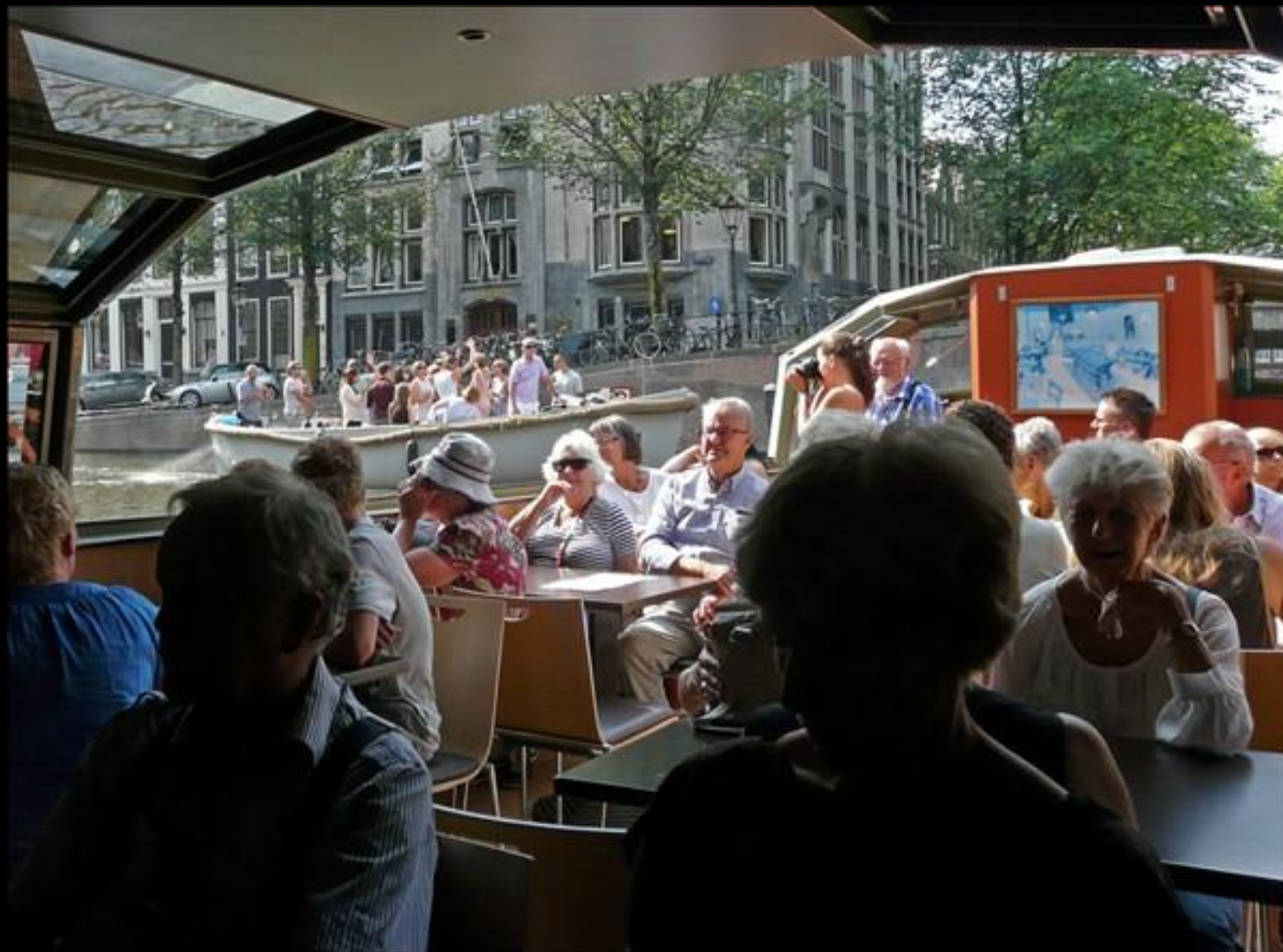
Här är vi ombord på ersättningsbåten