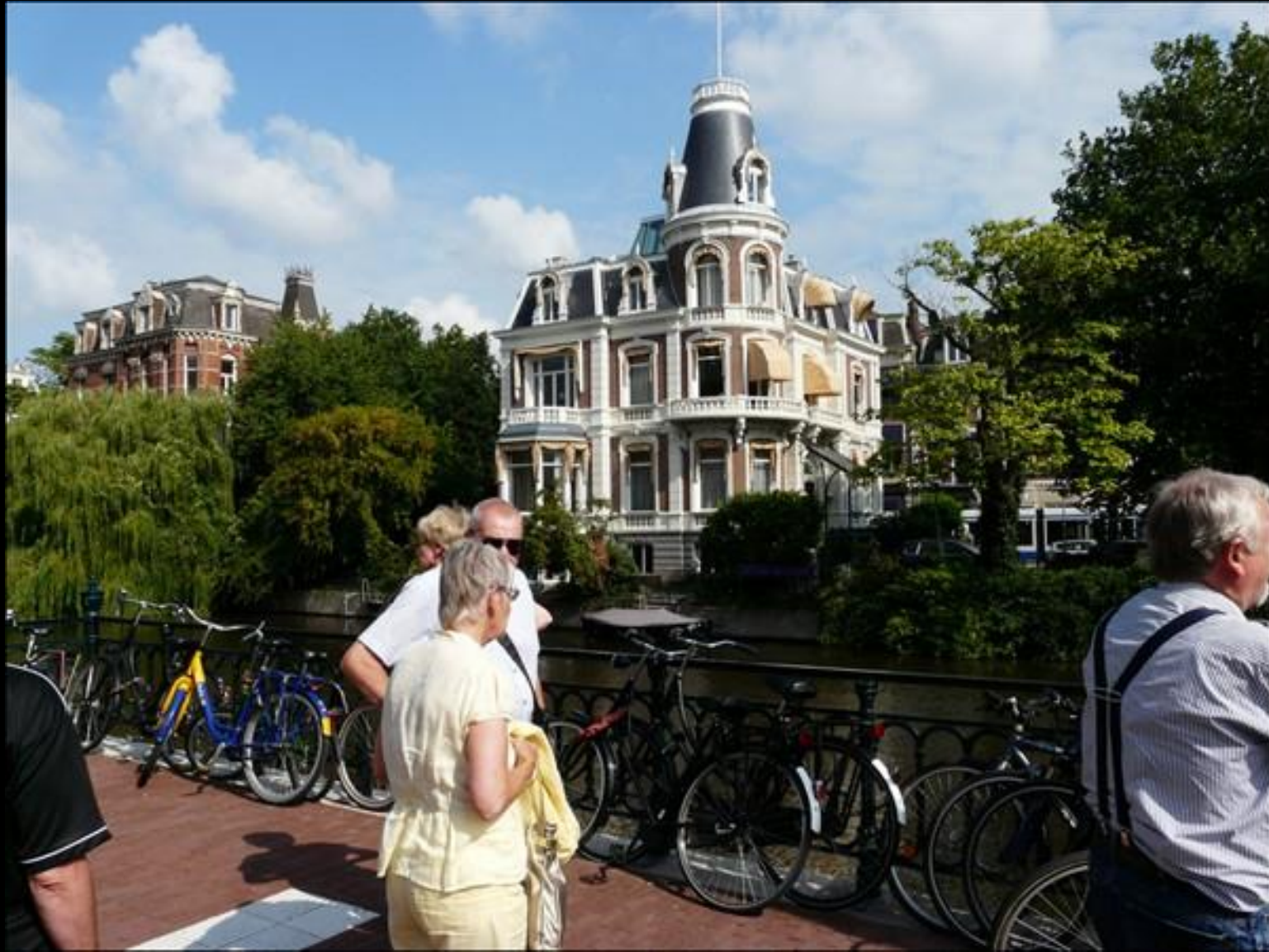
Många vackra (?) hus i Amsterdam