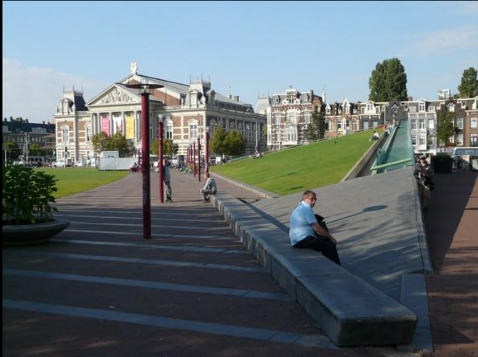
Concert gebouw intill Stedelijk Museum