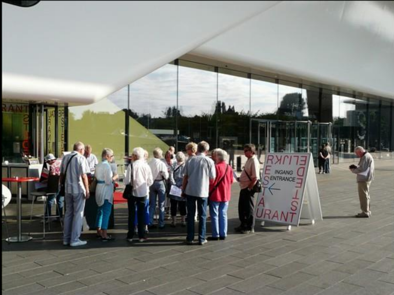
Väntan vid restaurang utanför Stedelijk Museum