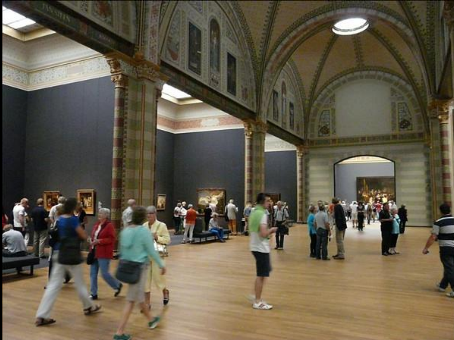
Interiör från Rijksmuseet