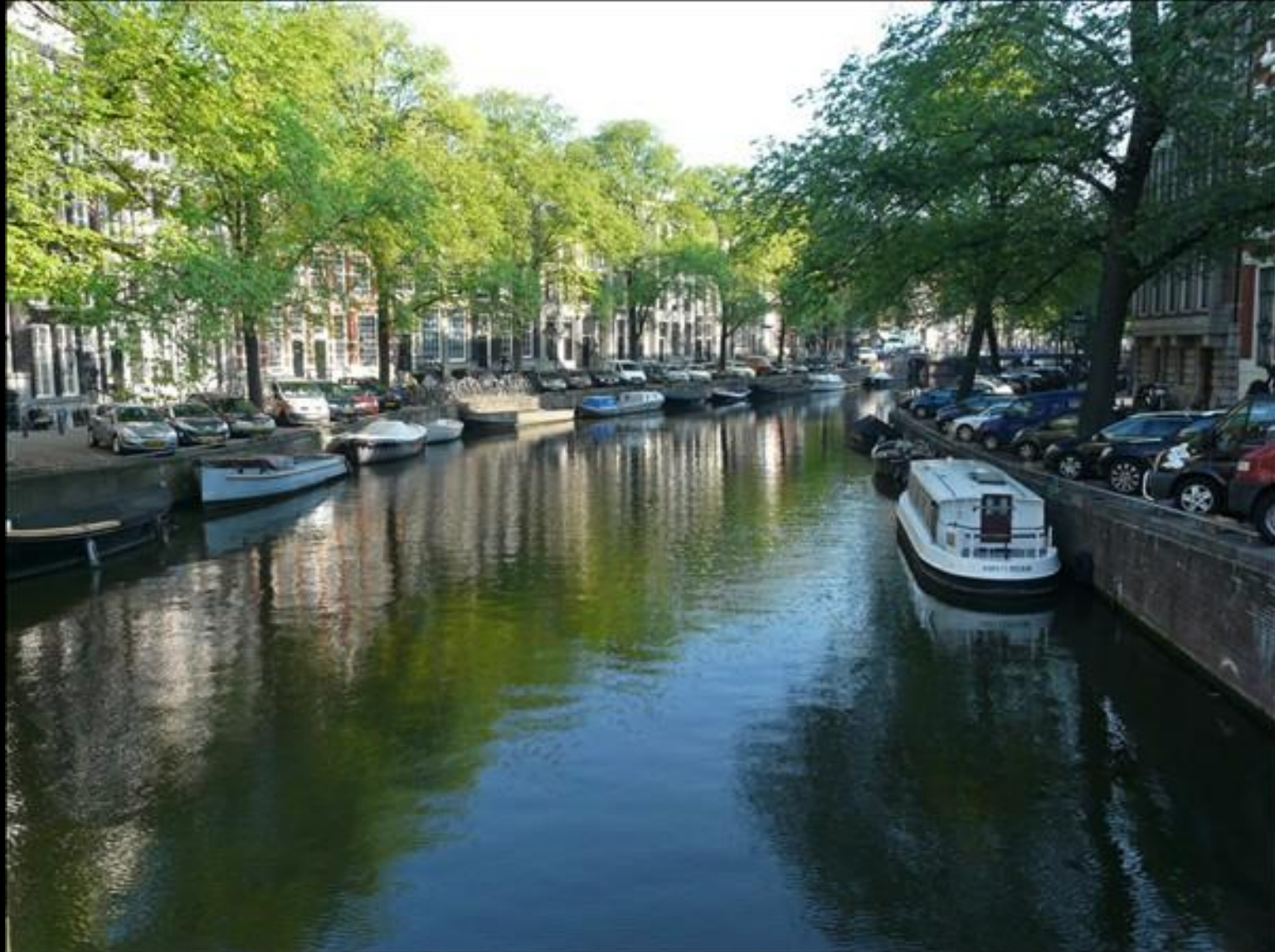
En av alla "fria kanaler"