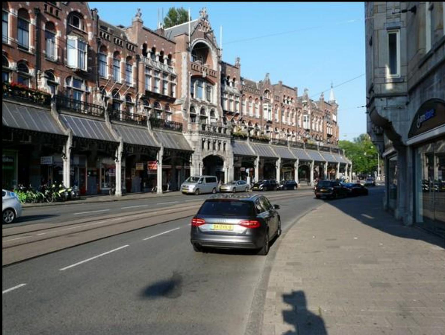
Hotel Nadia i borte änden av byggnaden