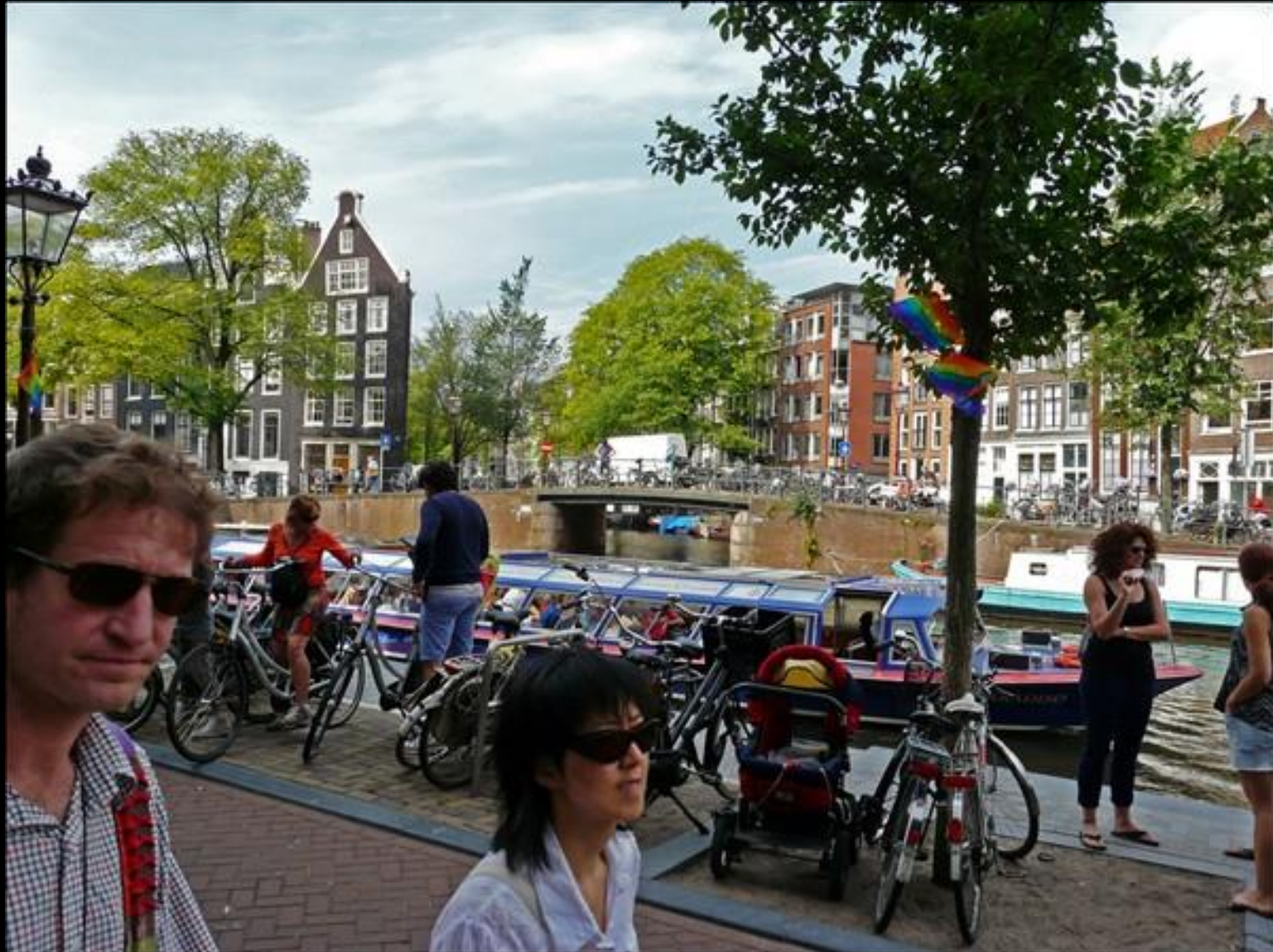
Utanför Anne Franks hus