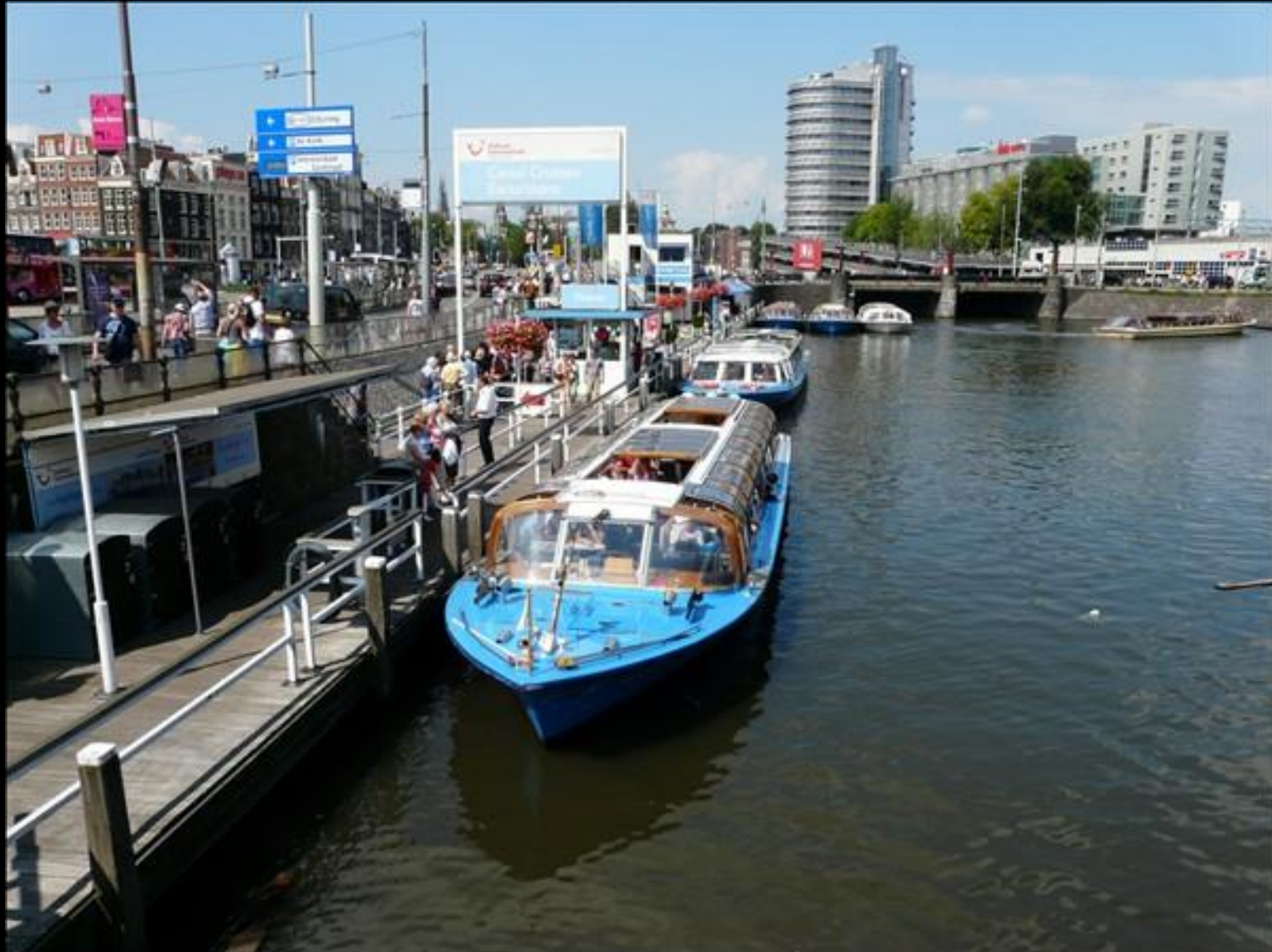
En så'n här ska vi åka med