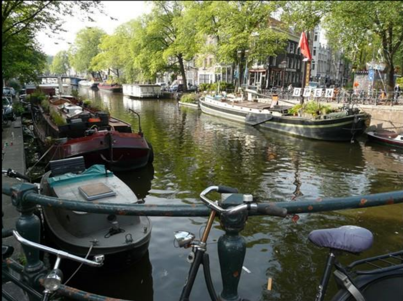
Husbåtsmuseum i husbåt