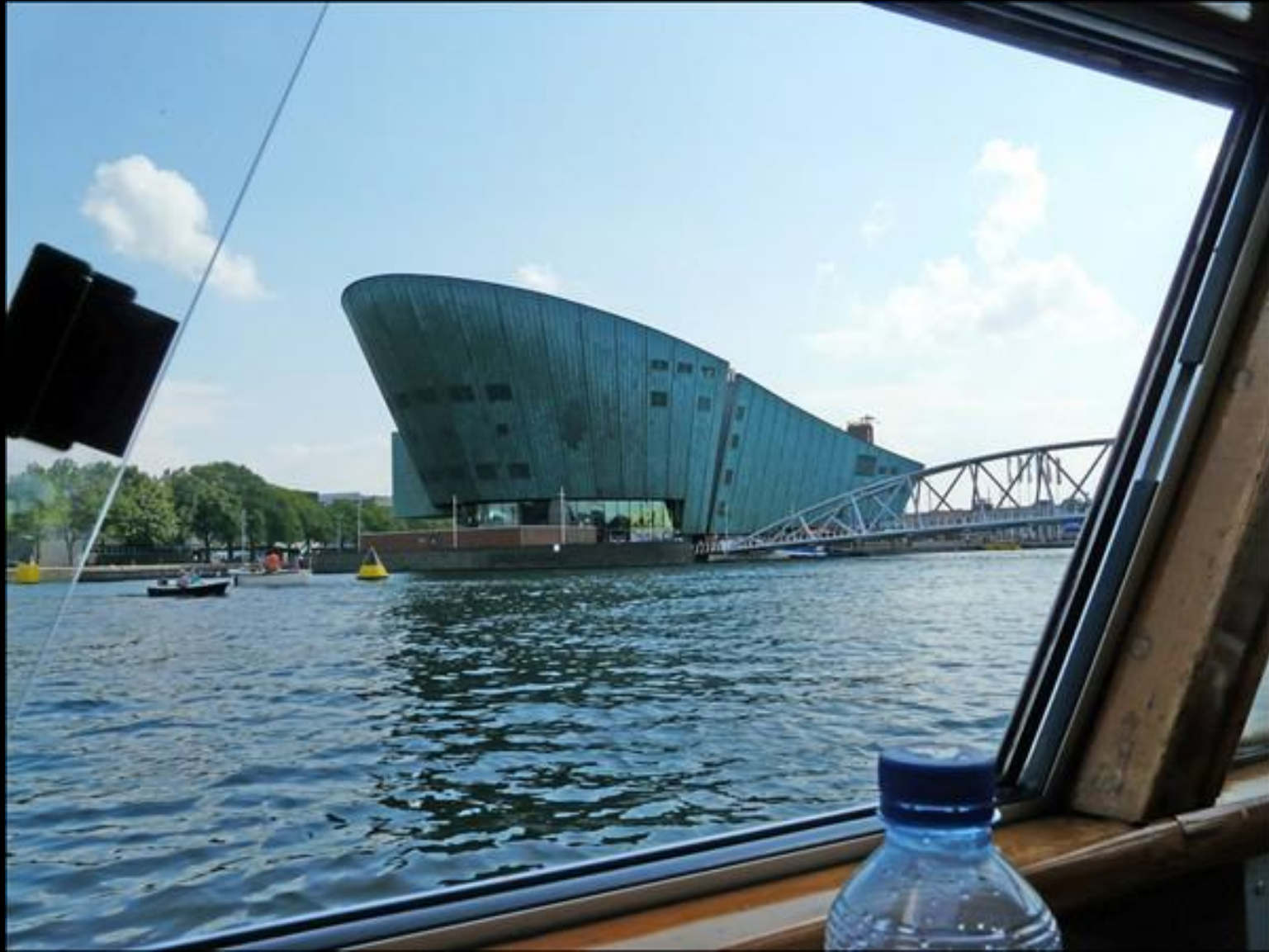
NEMO Science Center