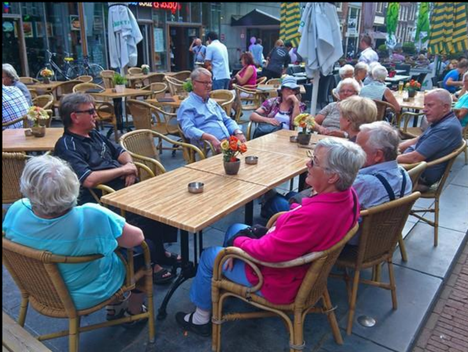
Att det ska ta så'n tid