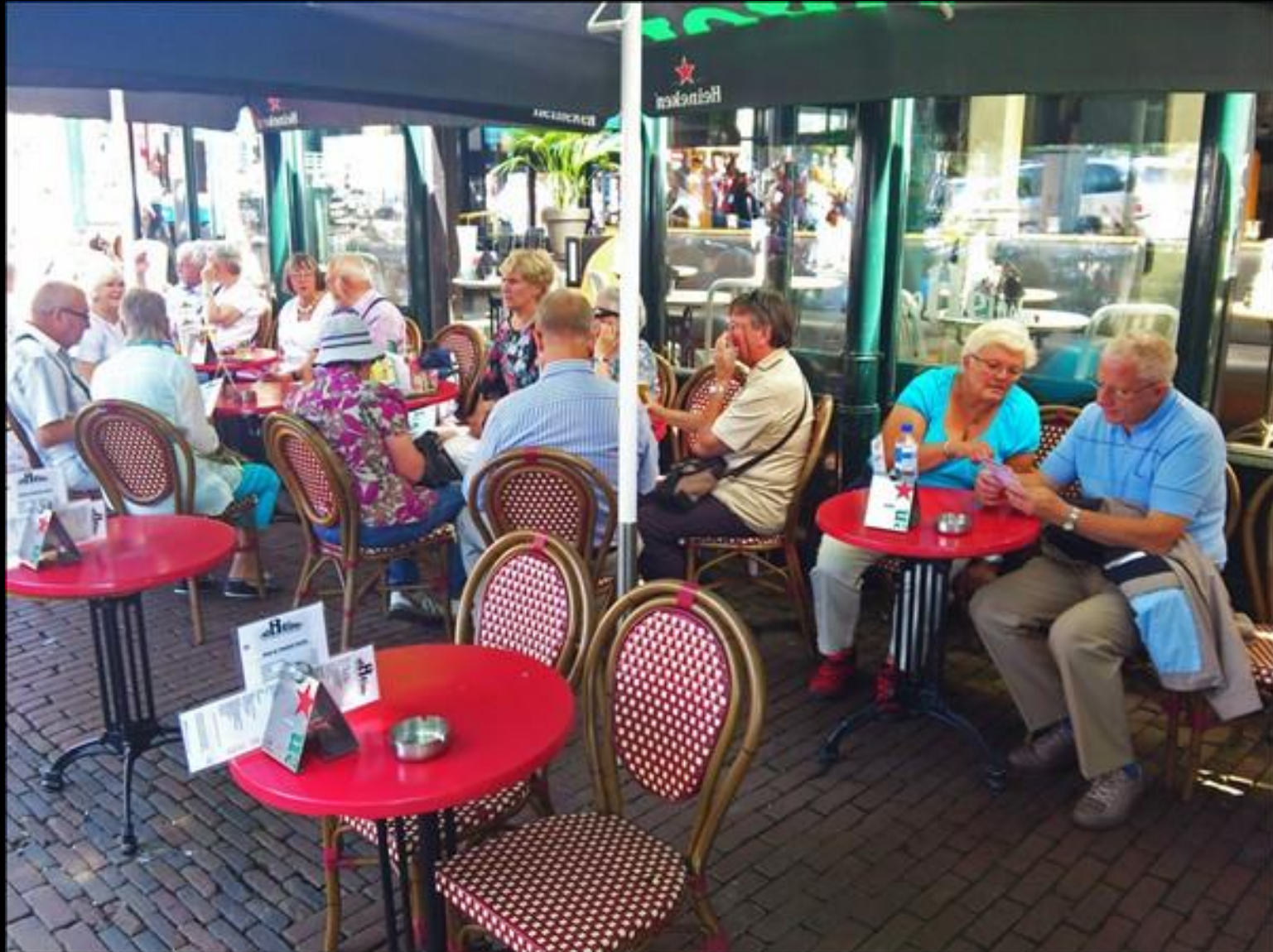
Lunch vid Leidse Plain