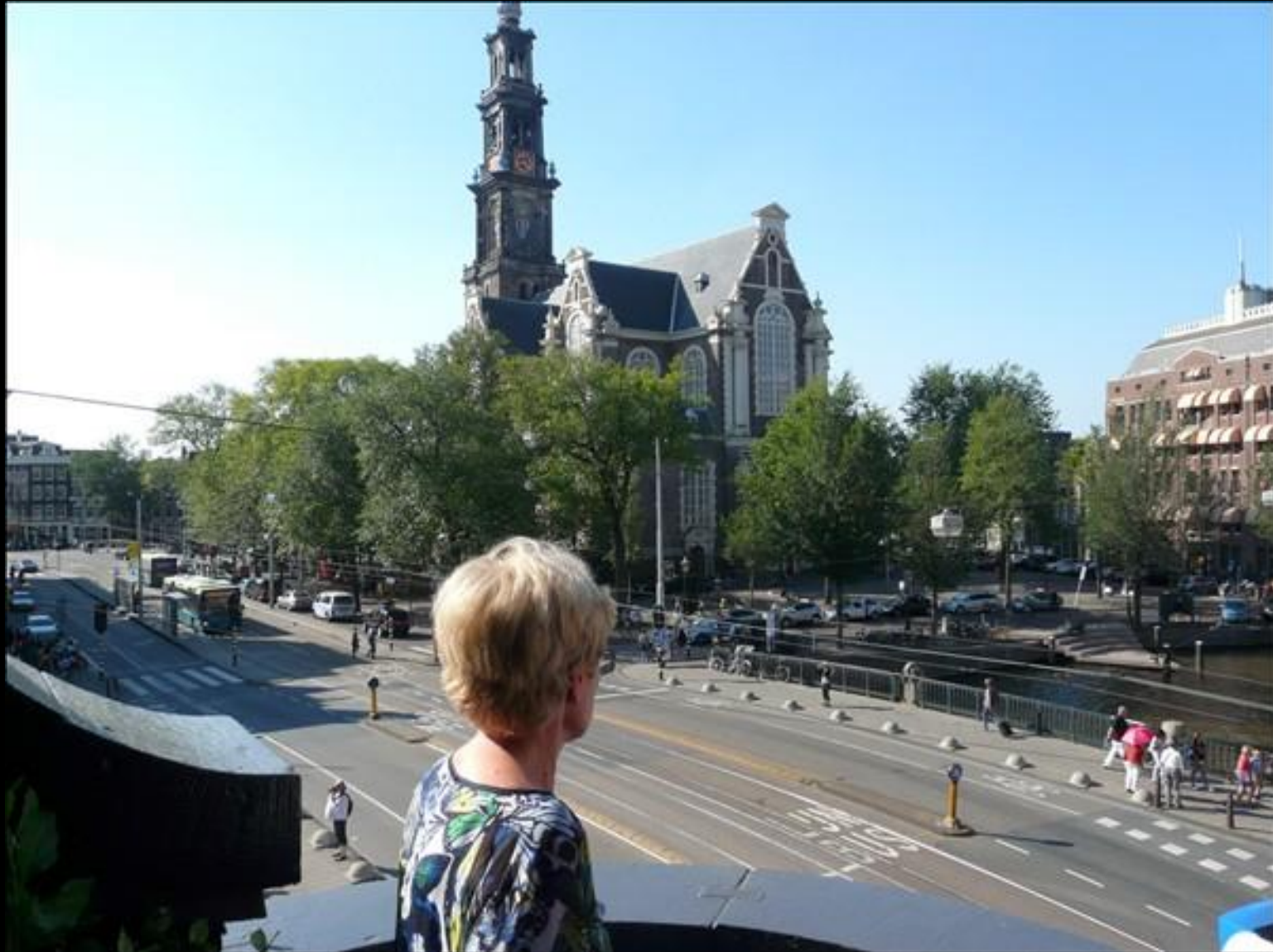
Utsikt från Nadia Hotel