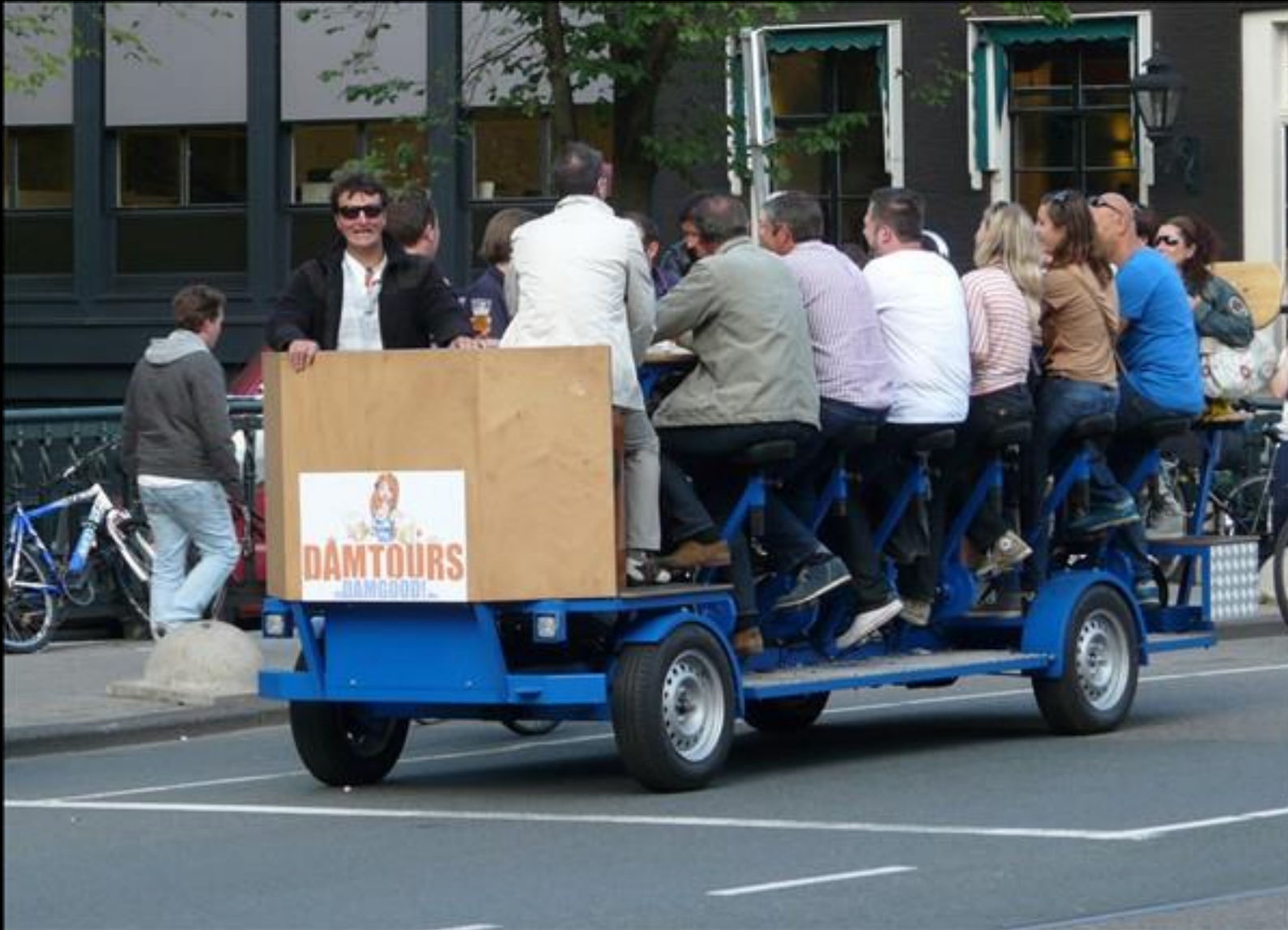
Här trampar man sig fram sidledes