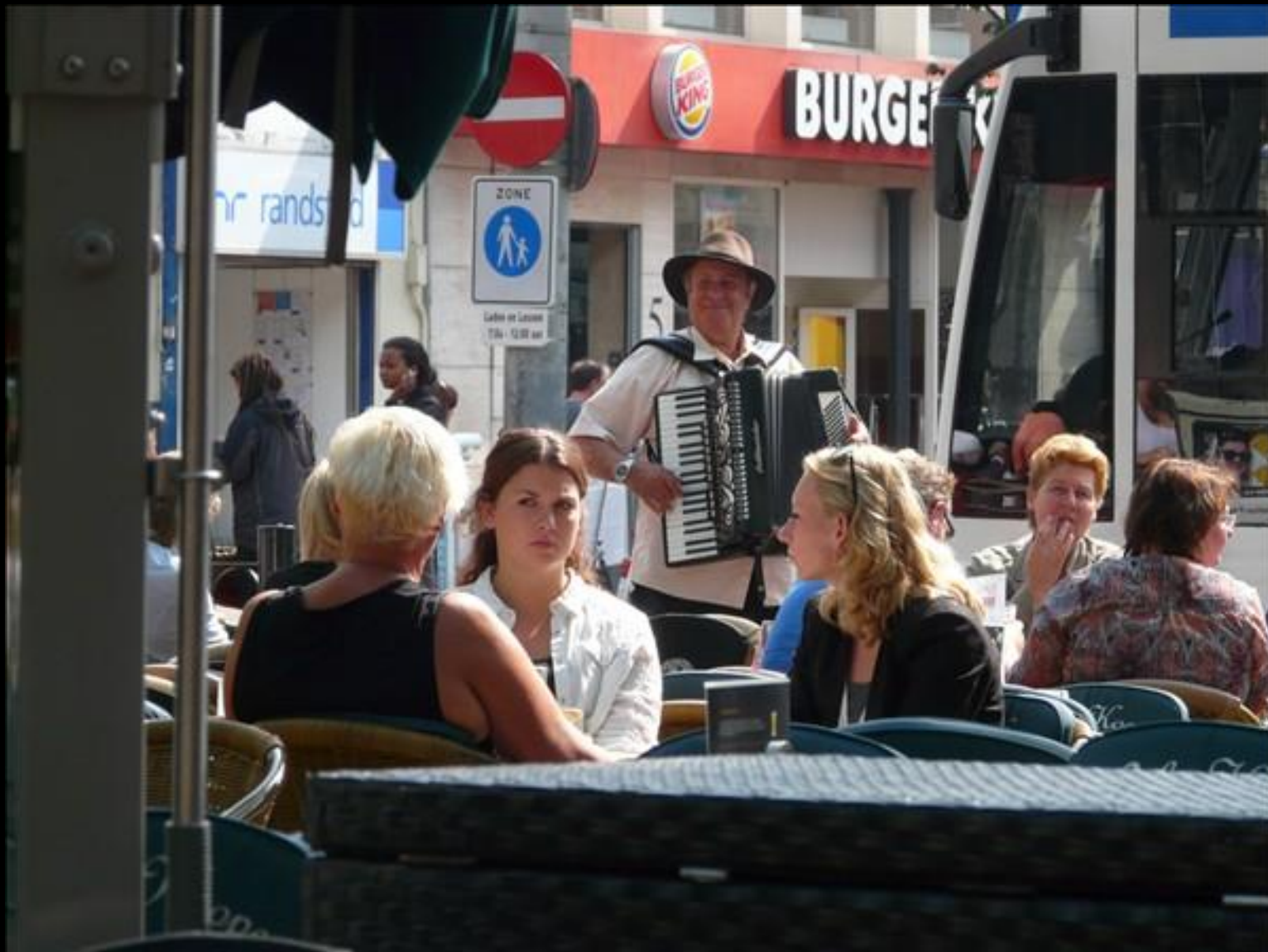
Bälgare som blev blåst på stålar