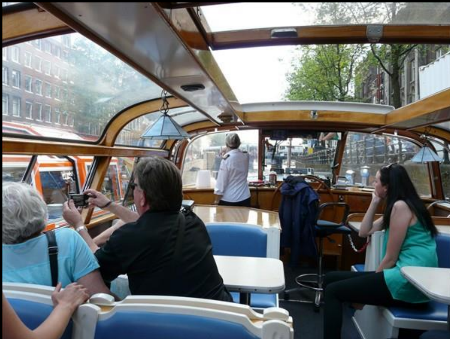
Nu blir vi släpade till liten brygga