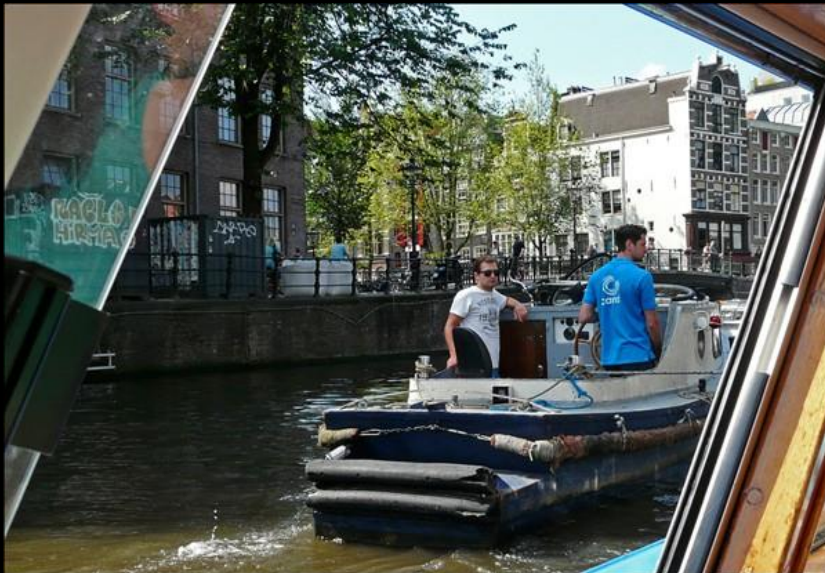
Maskinfel, hjälp tillkallas