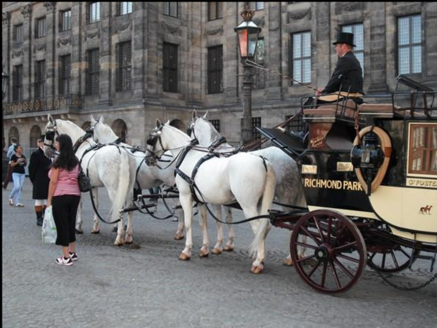
Kusar på Dam-platsen