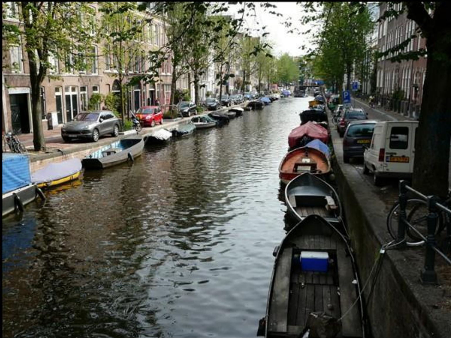
Båtar i vila