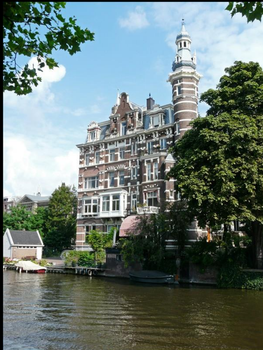
Nästan likt en minaret