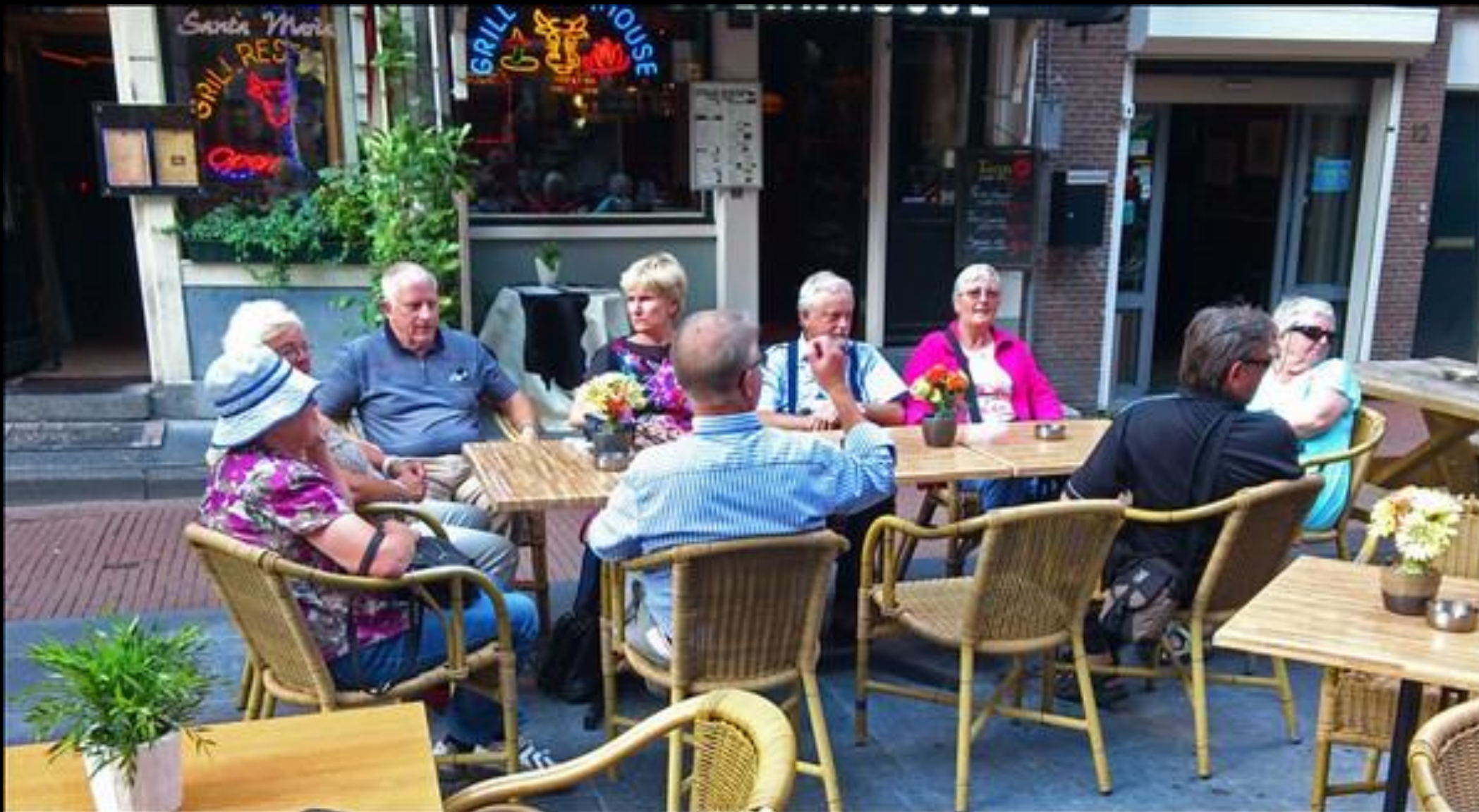
Öl och kaffe står på agendan