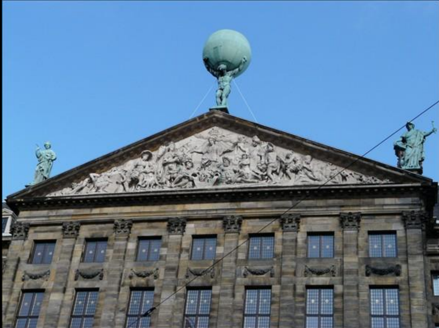
Kungliga slottet vid Dam