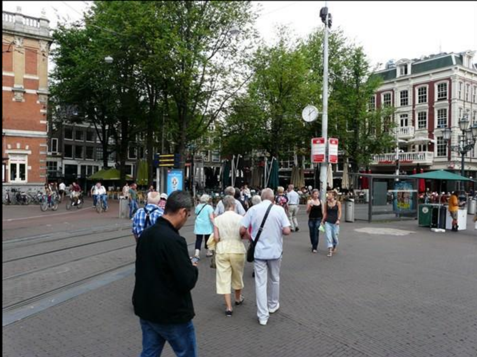
Lunchstället vid Leidse Plain rakt fram