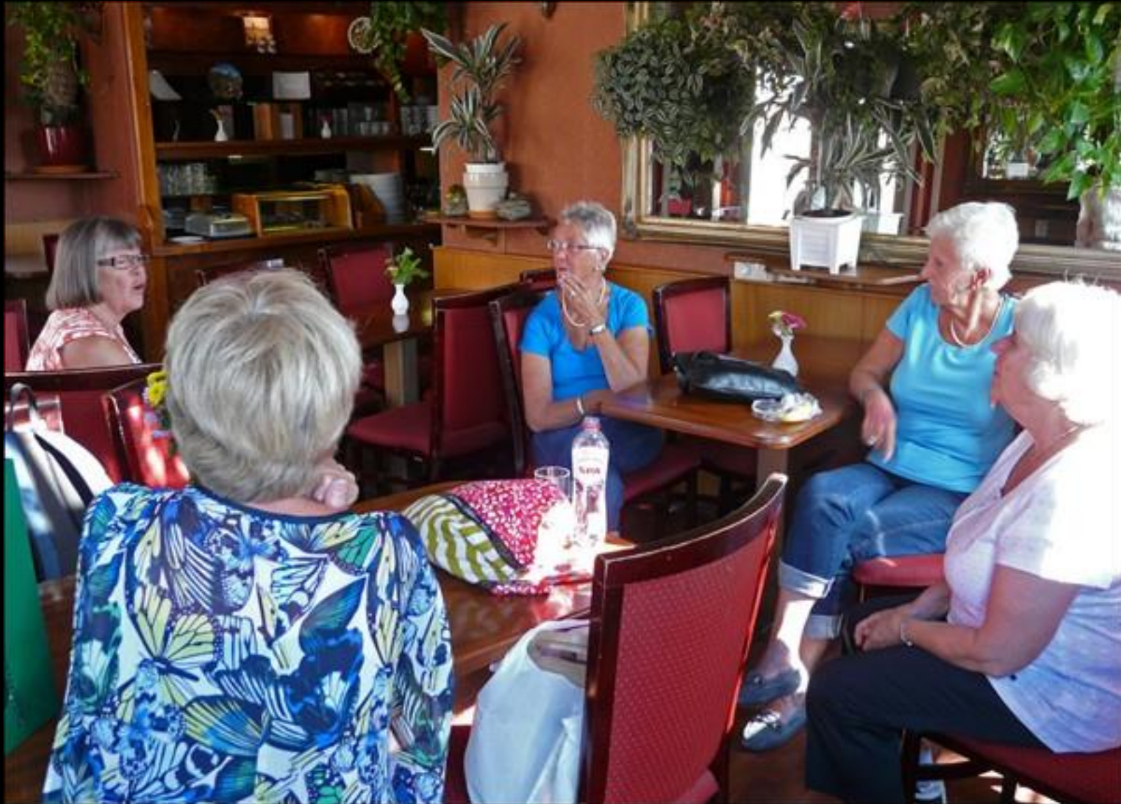
Tjejsnack inför hemresan