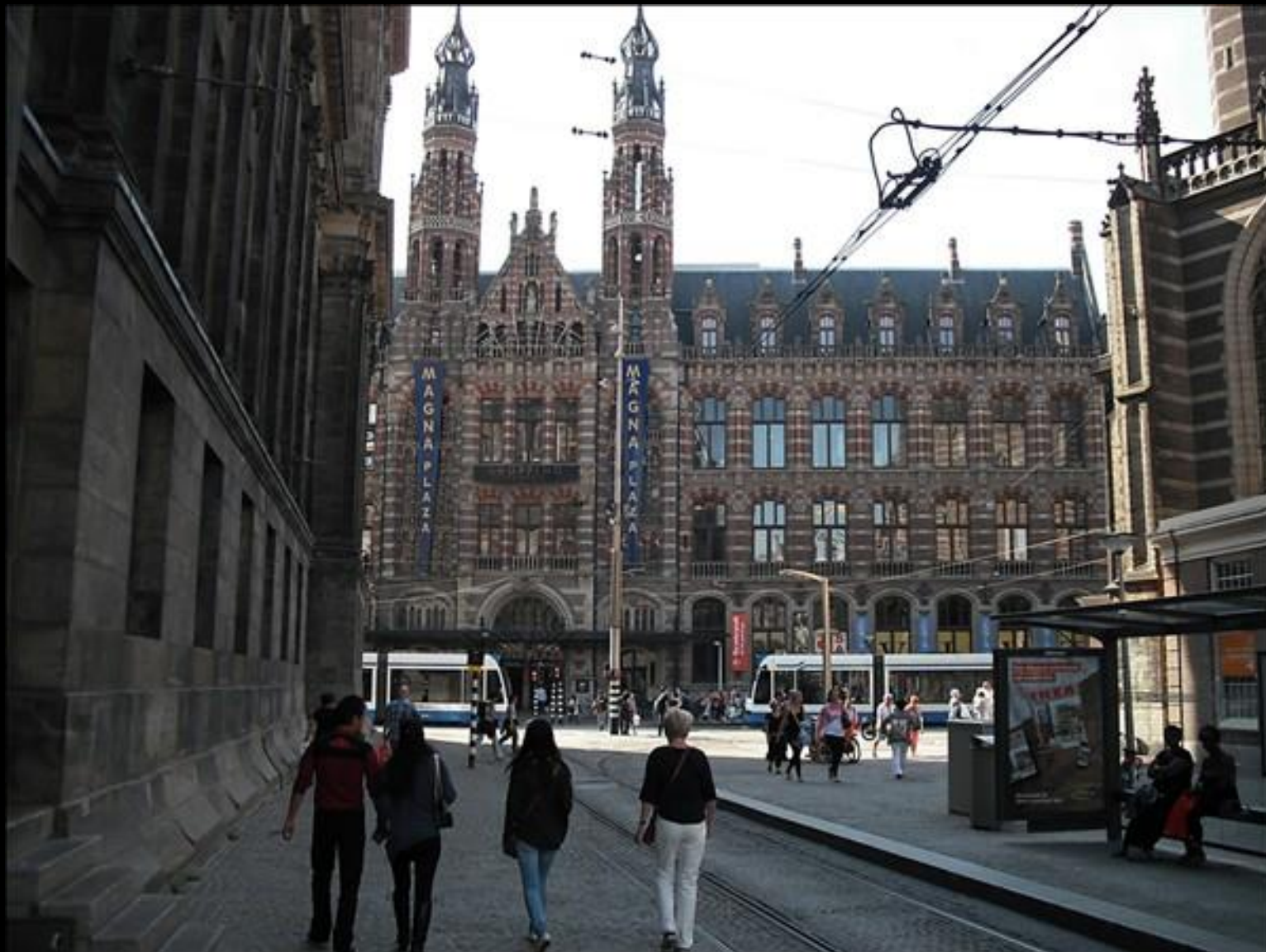
Magna Plaza varuhus vid Dam-platsen