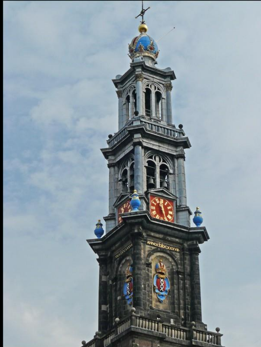
Wester Kerk igen