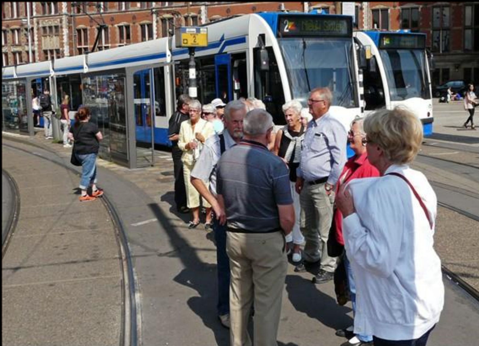
Framme vid centralstationen och kanalbåtarna