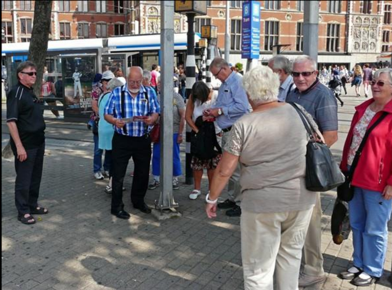
Lillo kollar turlistan