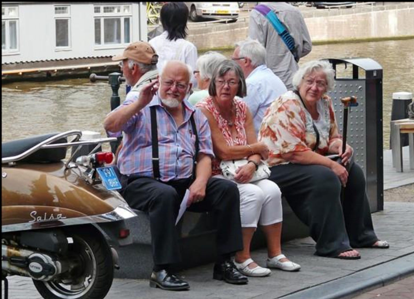
Lillo vinkar "hej" till publiken