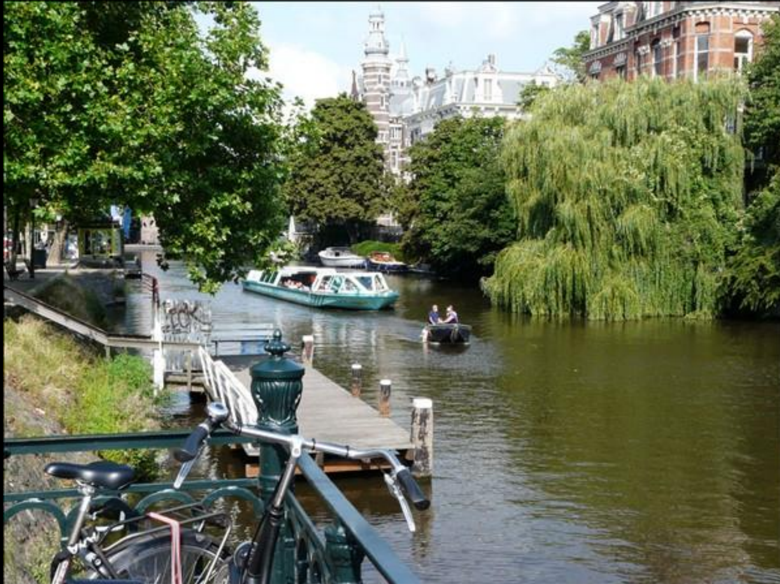
Gröna båtar och stränder, här och var några änder