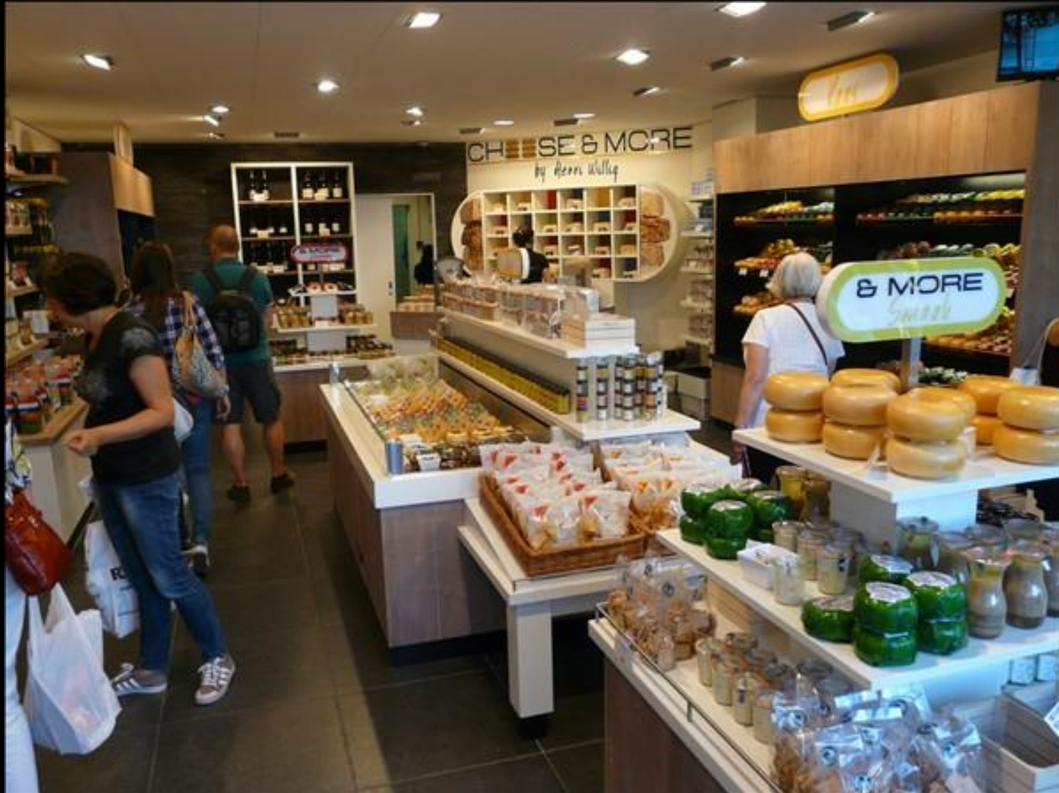
Ostar mm på Bloemenmarkt