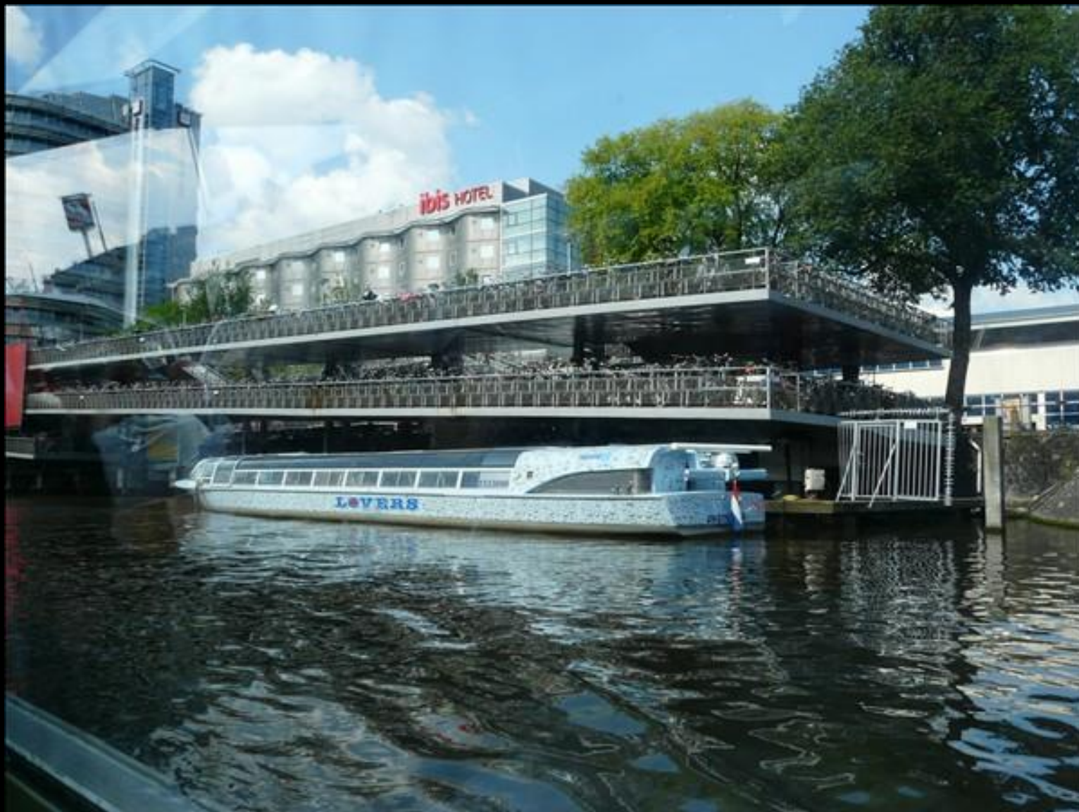
Parkering för upp till 2500 cyklar