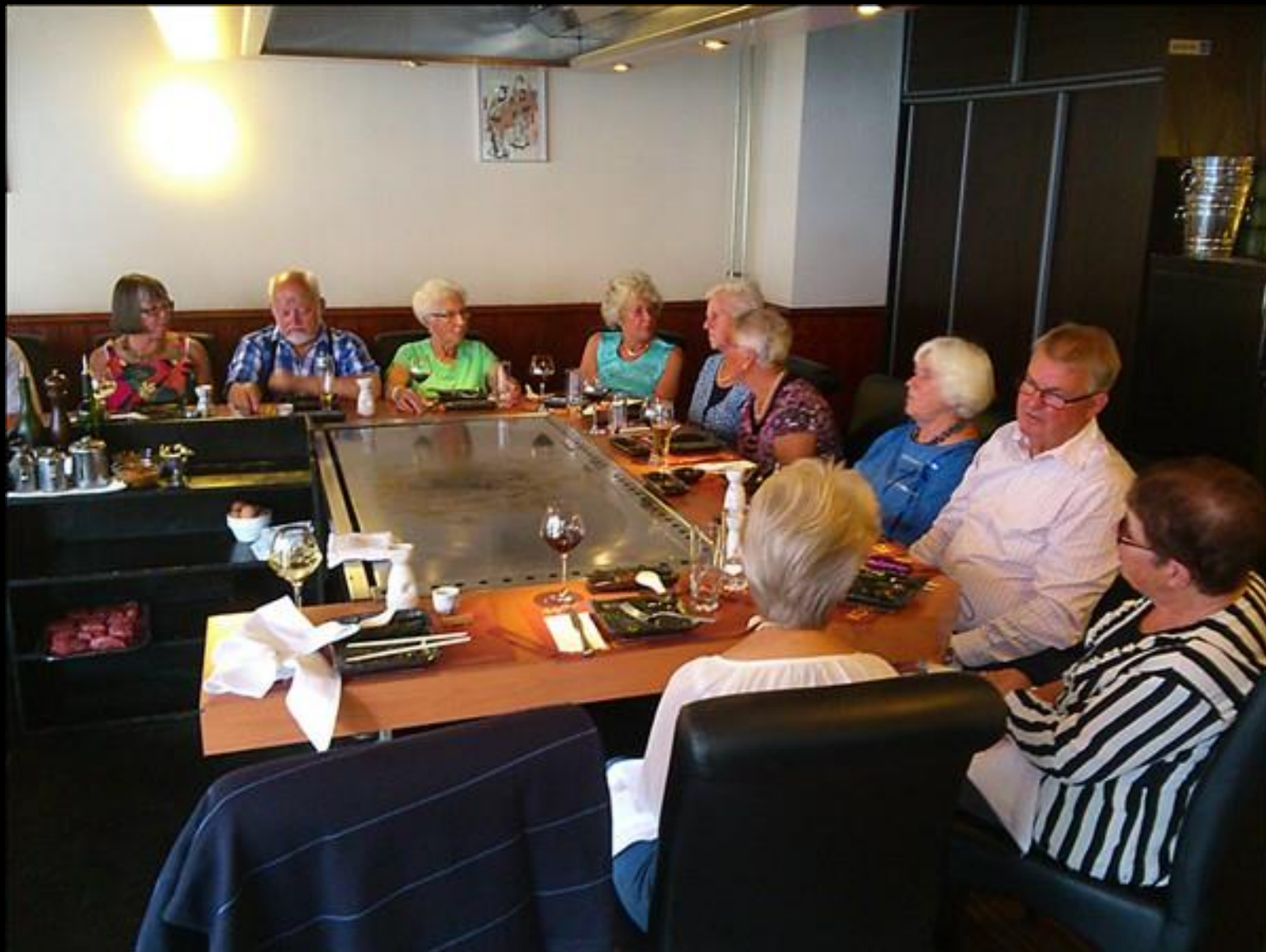
I väntan på nästa maträtt