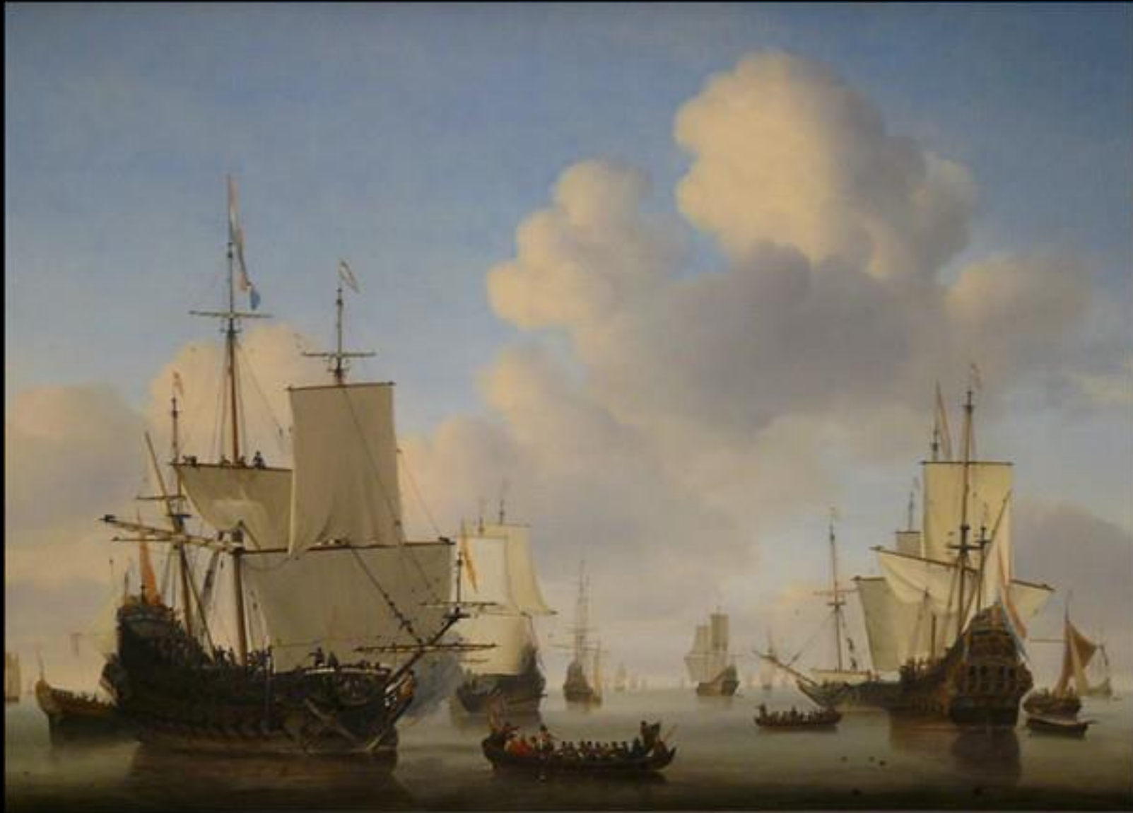
Skepp o' hoj