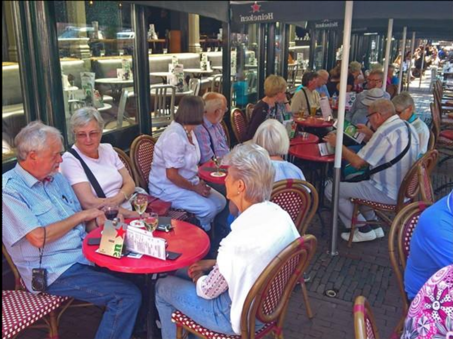
Lunch vid Leidse Plain