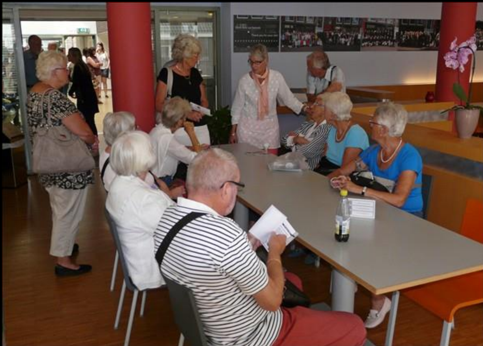
Cafet i Anne Franks hus