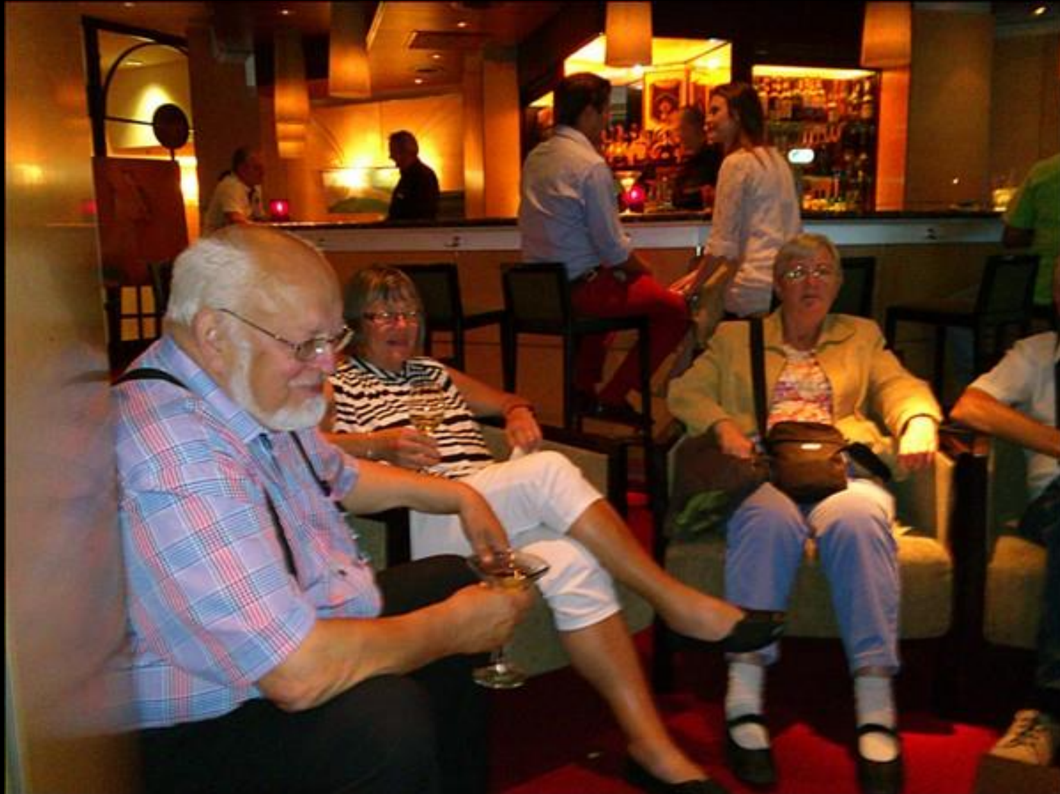
Gott med en drink före maten