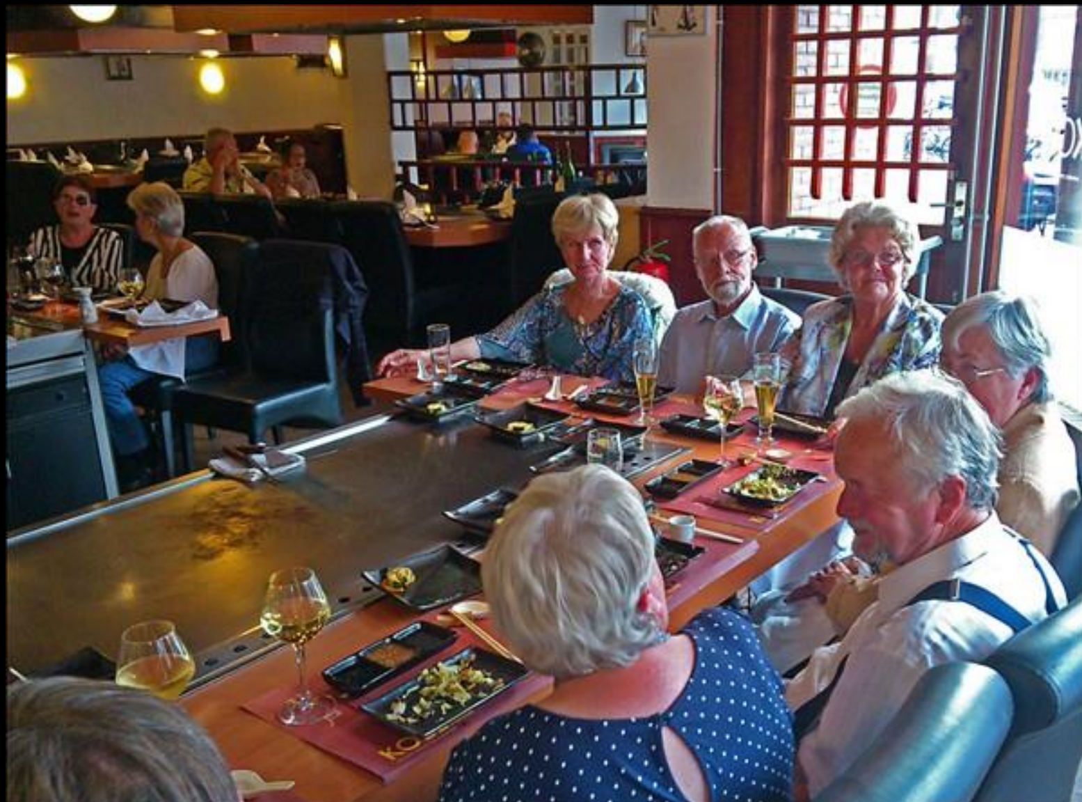
Mums filibabba, men inte en krabba