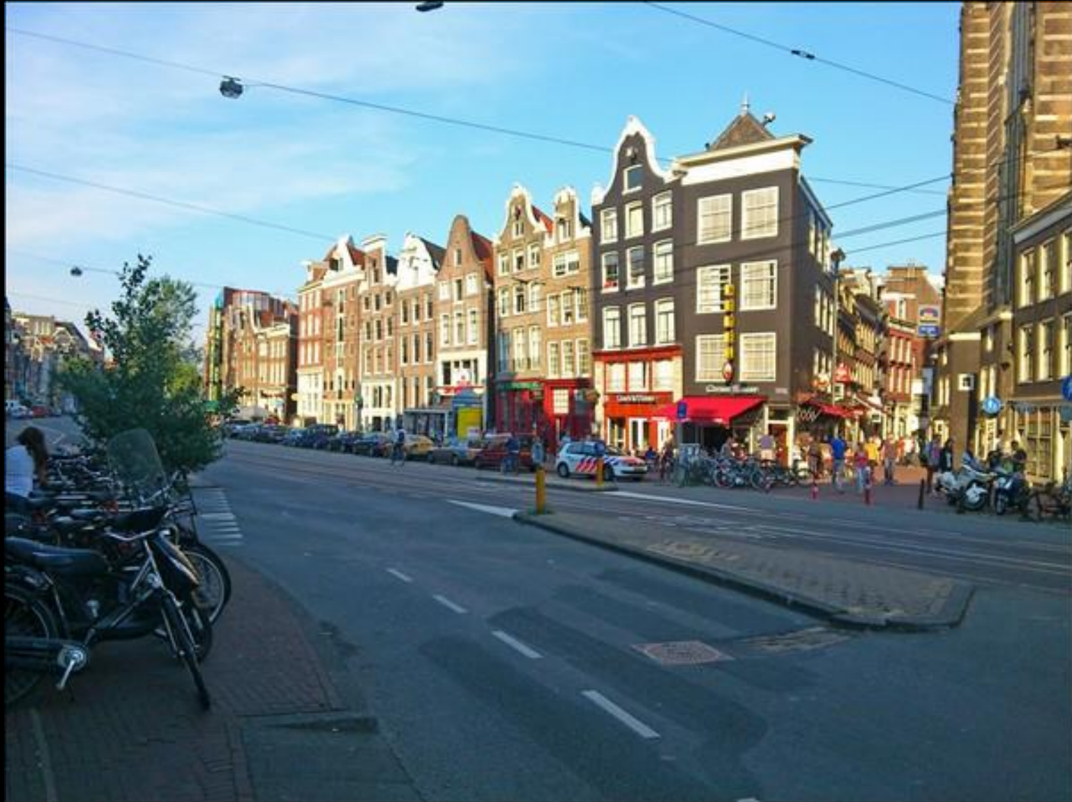
Mitt emot Magna Plaza