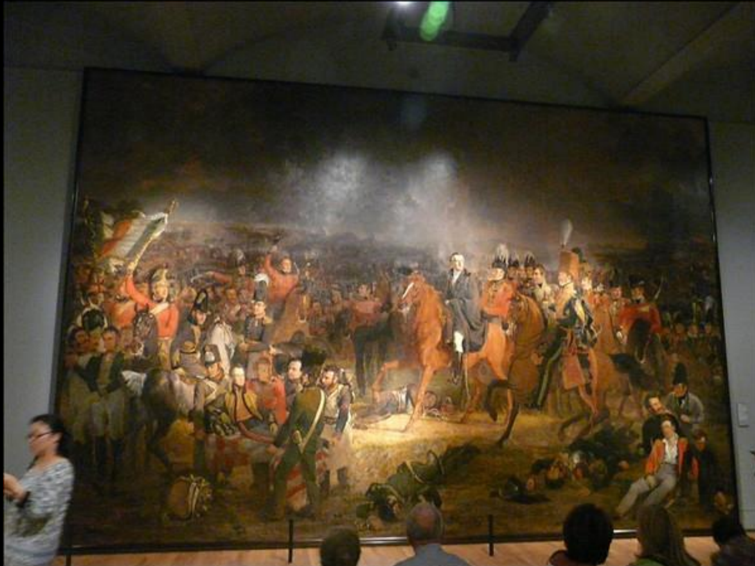
Nappe och killarna på Rijksmuseet