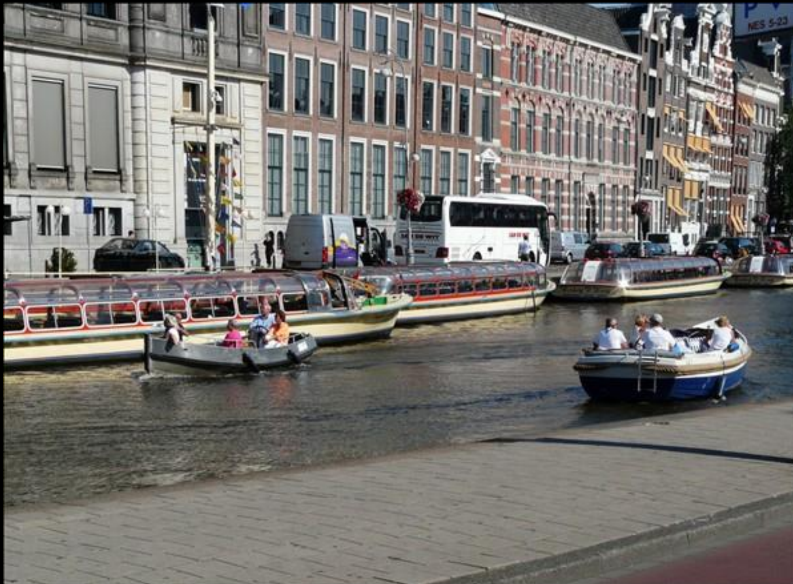
I väntan på spårvagnen till Nadia Hotel