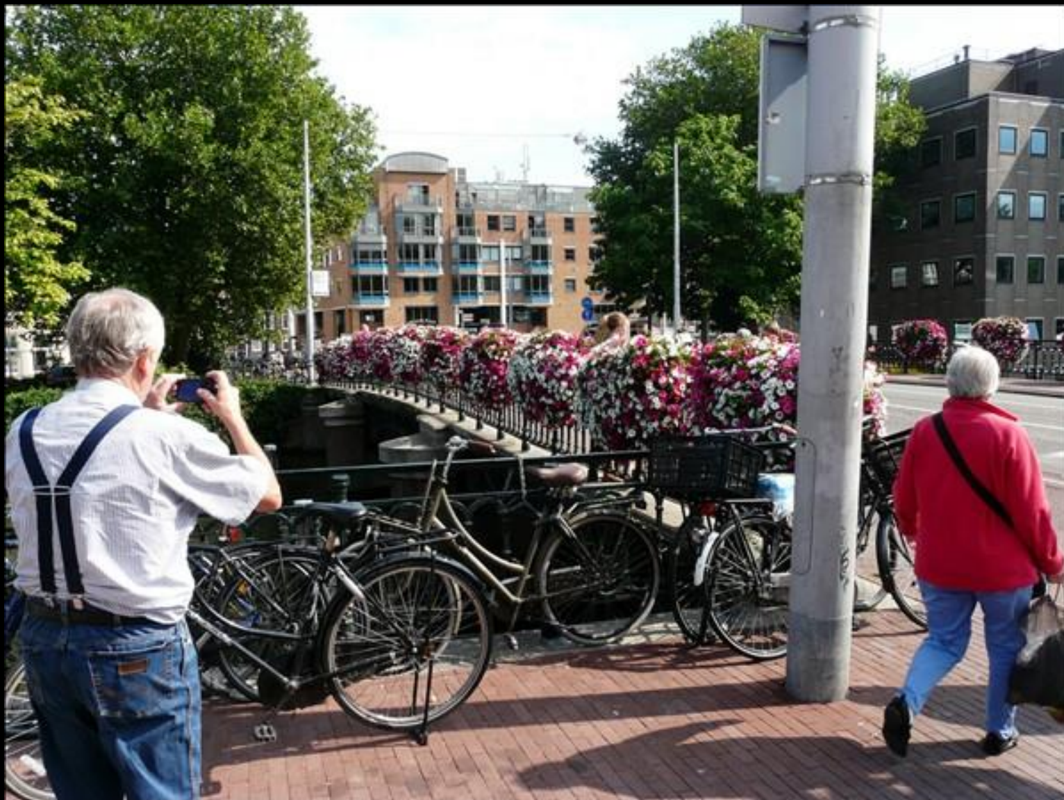
K-G gillar blomster