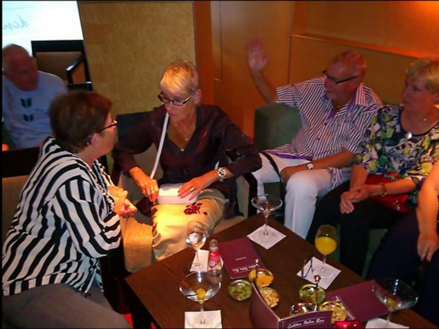
Snack med snacks