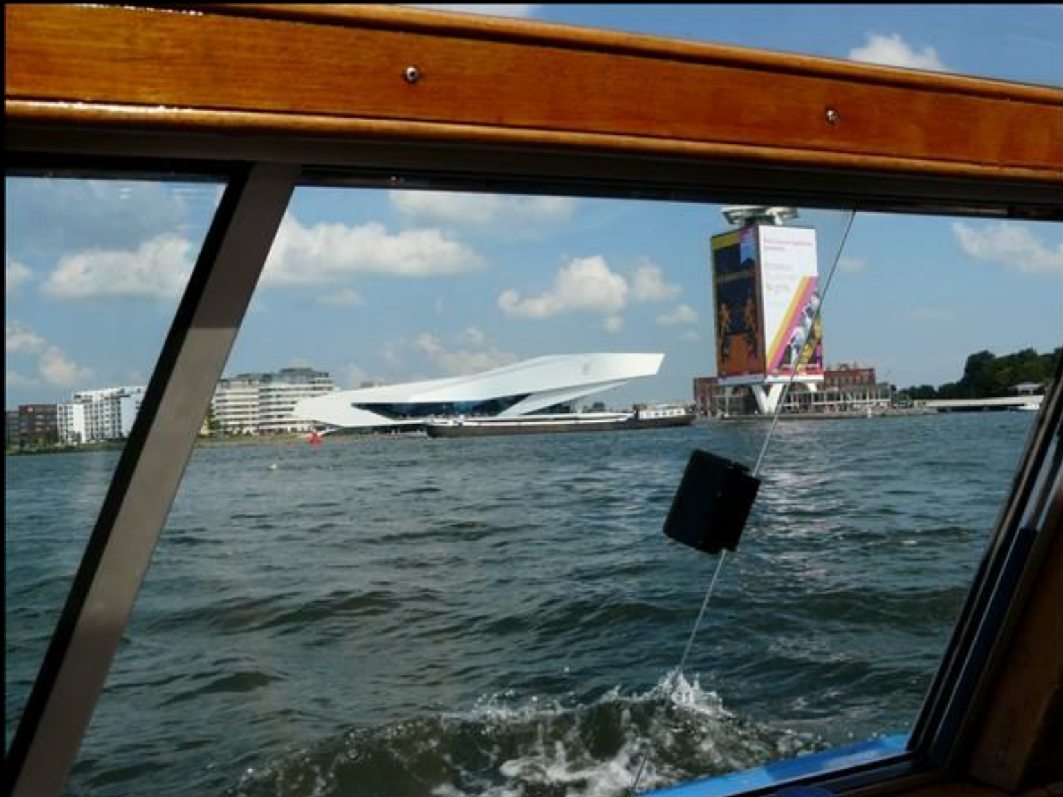
EYE Film Museum