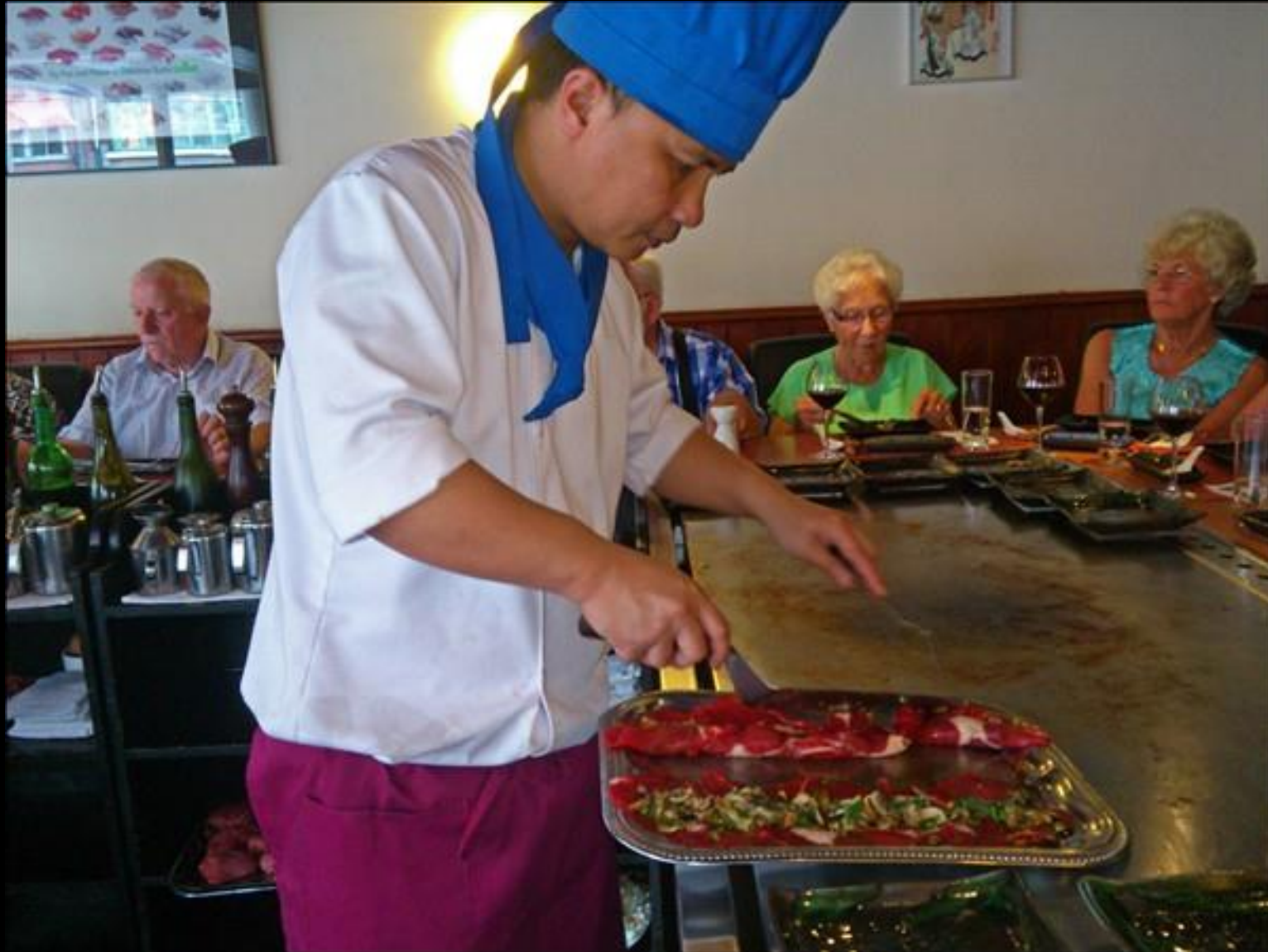
Den mindre vilda kocken på Kobe-restaurangen