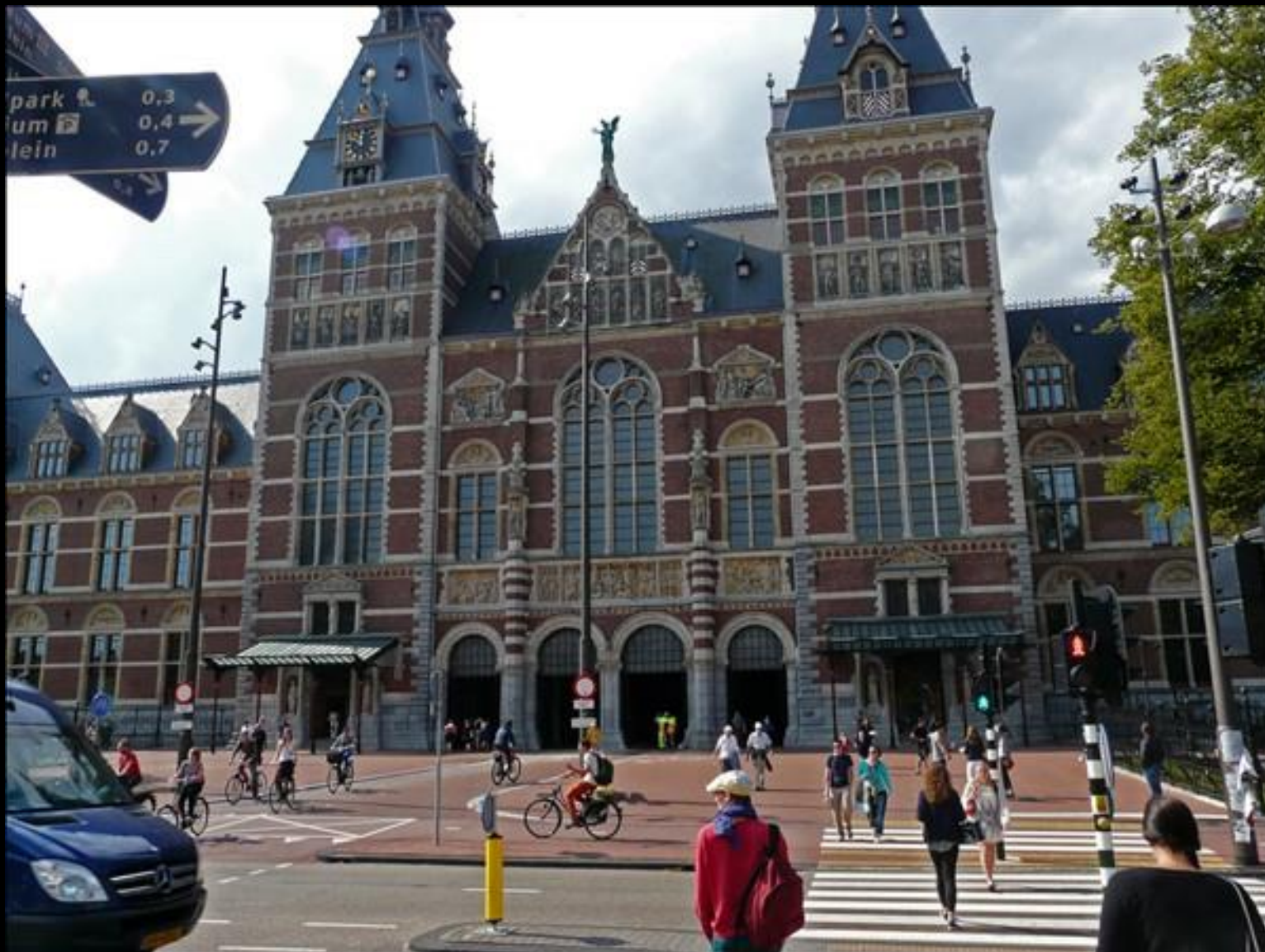
Här kom vi ut från museet