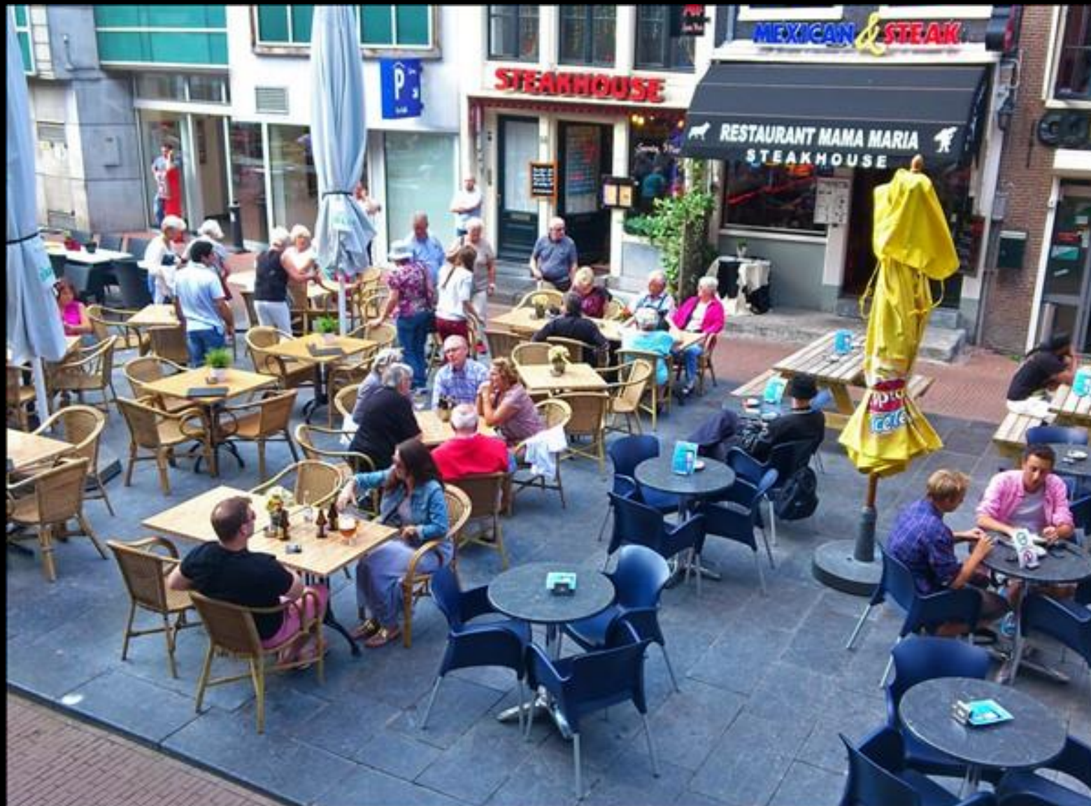
Dags för förtäring i närheten av Hotel Avenue