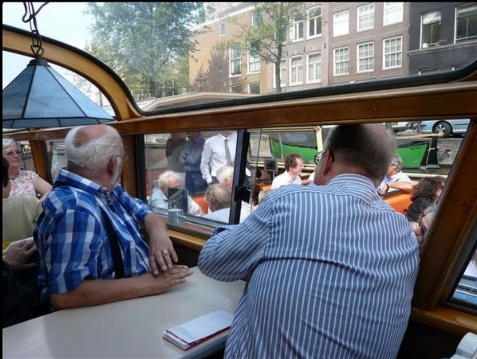
Lillo ser möjlighet till nya kontakter på babords sida