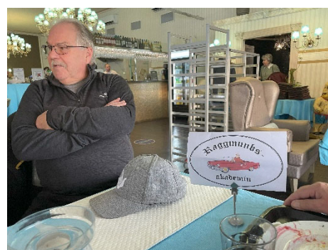
Så här belåten ser man ut efter en god och näringsriktig? lunch.