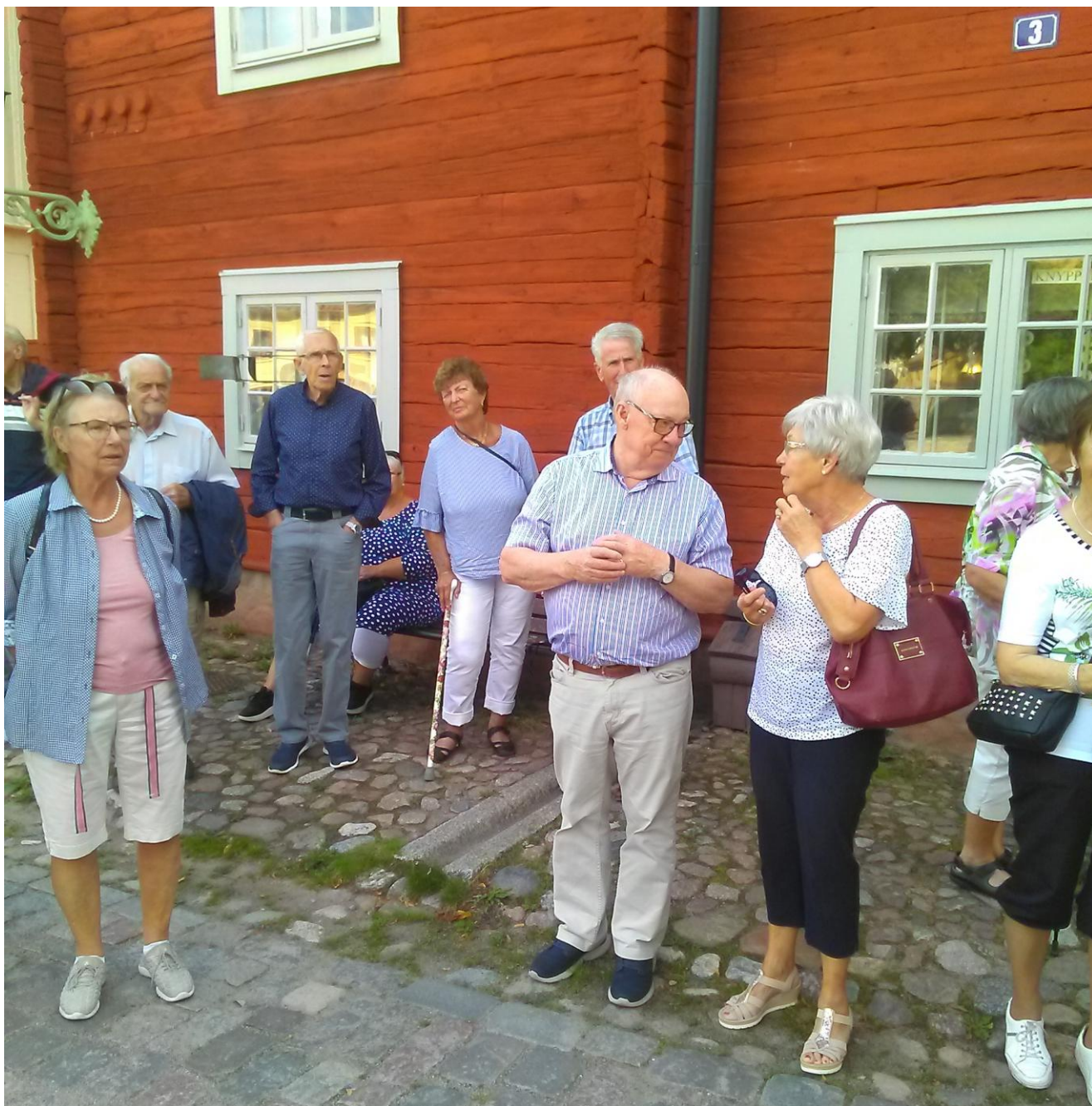
På rundvandring i Gamla Linköping