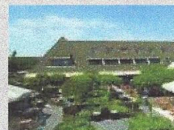
Van der Valk Hotel de Gouden Leeuw