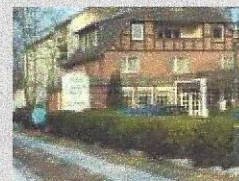
Hotell Landgut Horn Bremen

Busskaffe kommer att serveras vid några tillfällen mot en liten kostnad.