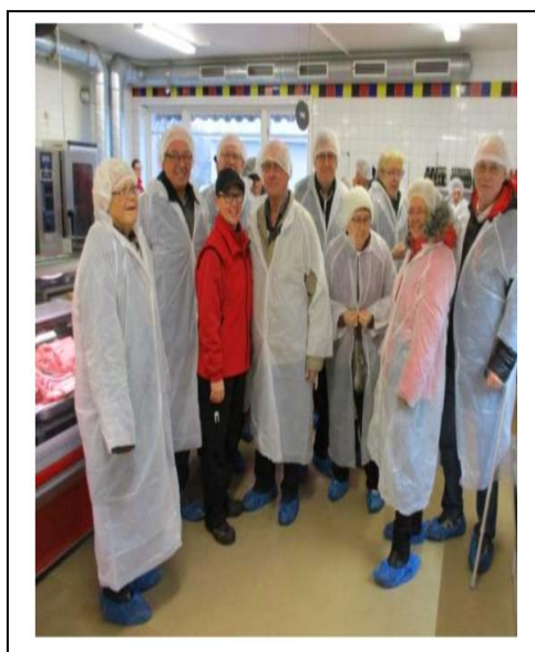
Studiebesök på Carlströms chark