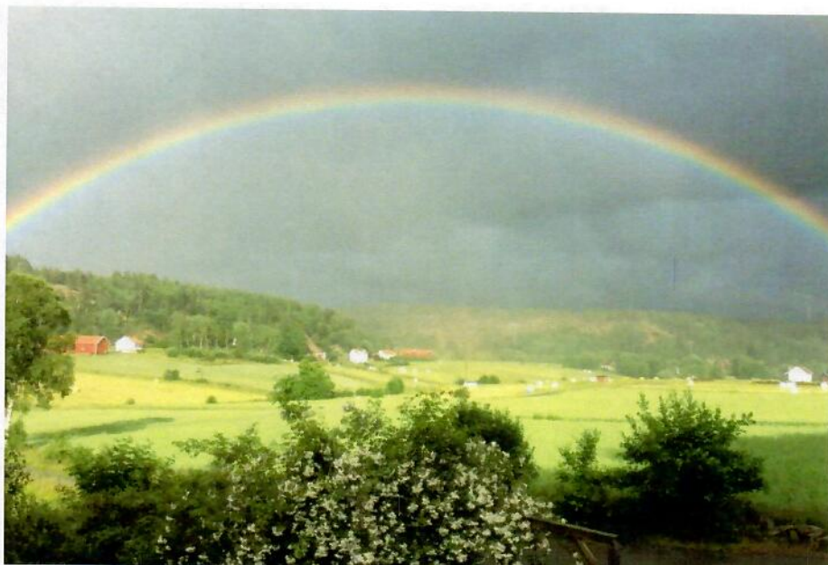
Regnbåge över Grind. Bilden vann första pris i vår fototävling hösten 2020