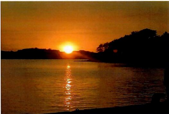
Solnedgång över Fjällbacka.

Bilden vann tredje pris i vår fototävling hösten 2020