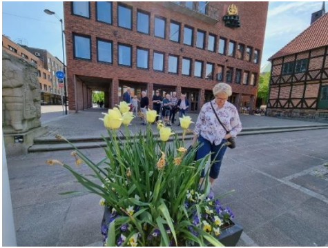
Vackra tulpaner utanför Rådhuset!