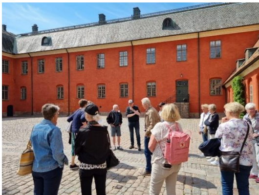
Här utanför slottet studeras Carl Magnus konstverk "Råmärke" från 1995