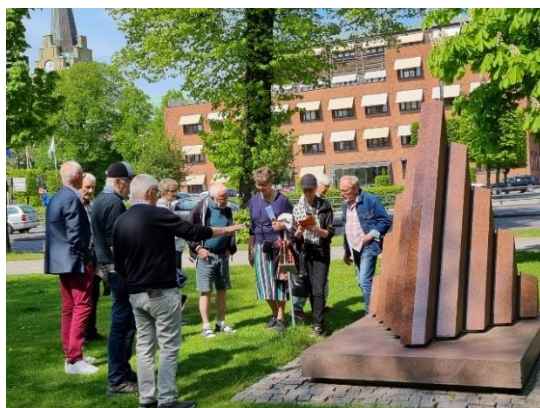
Vidare in mot centrum!