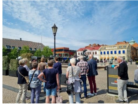
Ett stopp vid Carl Milles statyn "Europa och Tjuren!"