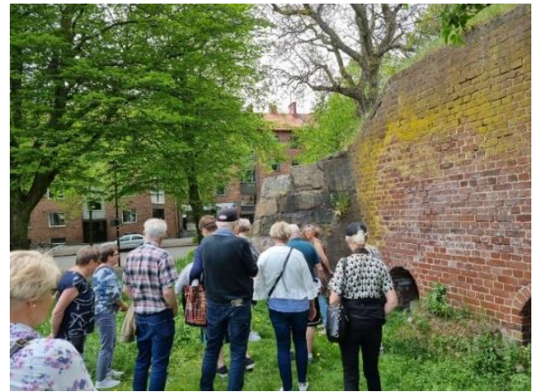
Lite lämningar från den historiska muren run Halmstad. De gamla inbygda kanonrummen, kasematterna vittnade om hur gamla Halmstad var uppbyggt.