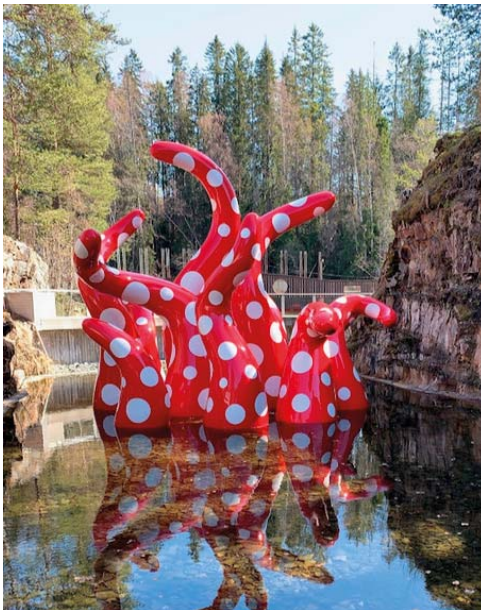
Shine of life av Yayoi Kusama