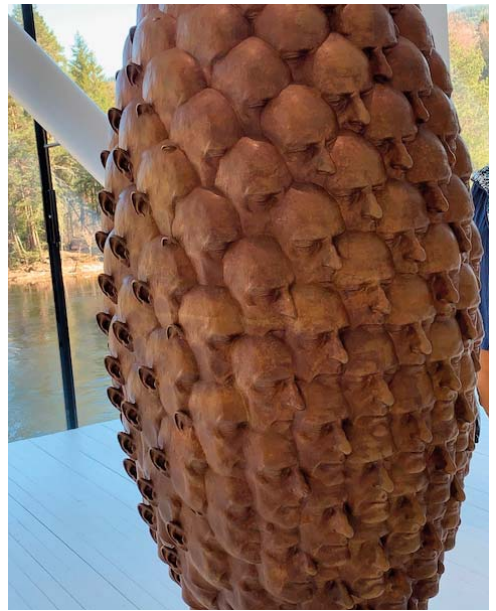
Tony Cragg, utställning 2023