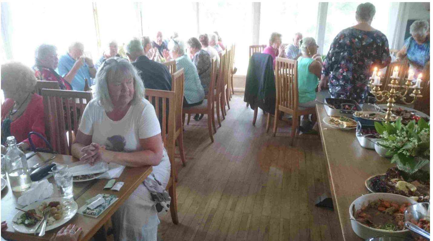
Den uppdukade buffén avnjuten. Ny medlem.