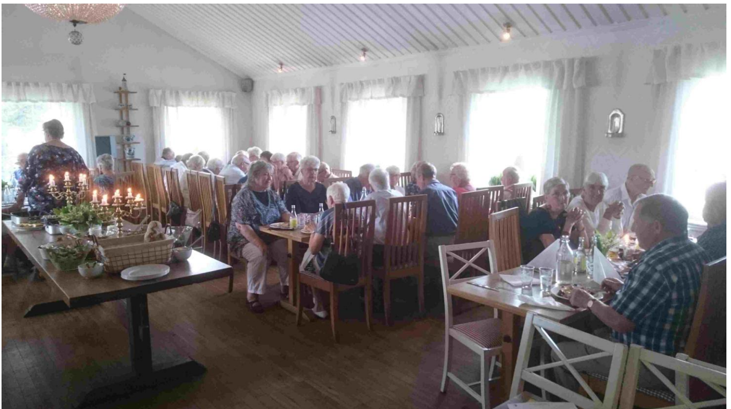
En mycket solig och fin vårdag i maj. Ljus strömmar in genom fönstren. Dörrarna ut till uteplatsen står vidöppna. Nästan vindstill. Varmt. Maj 2018. Månadsmöte och Vårfest på Tindered.