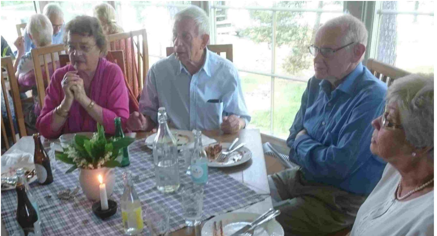
Efter buffén. Ny medlem i SPF Tjustbygden.