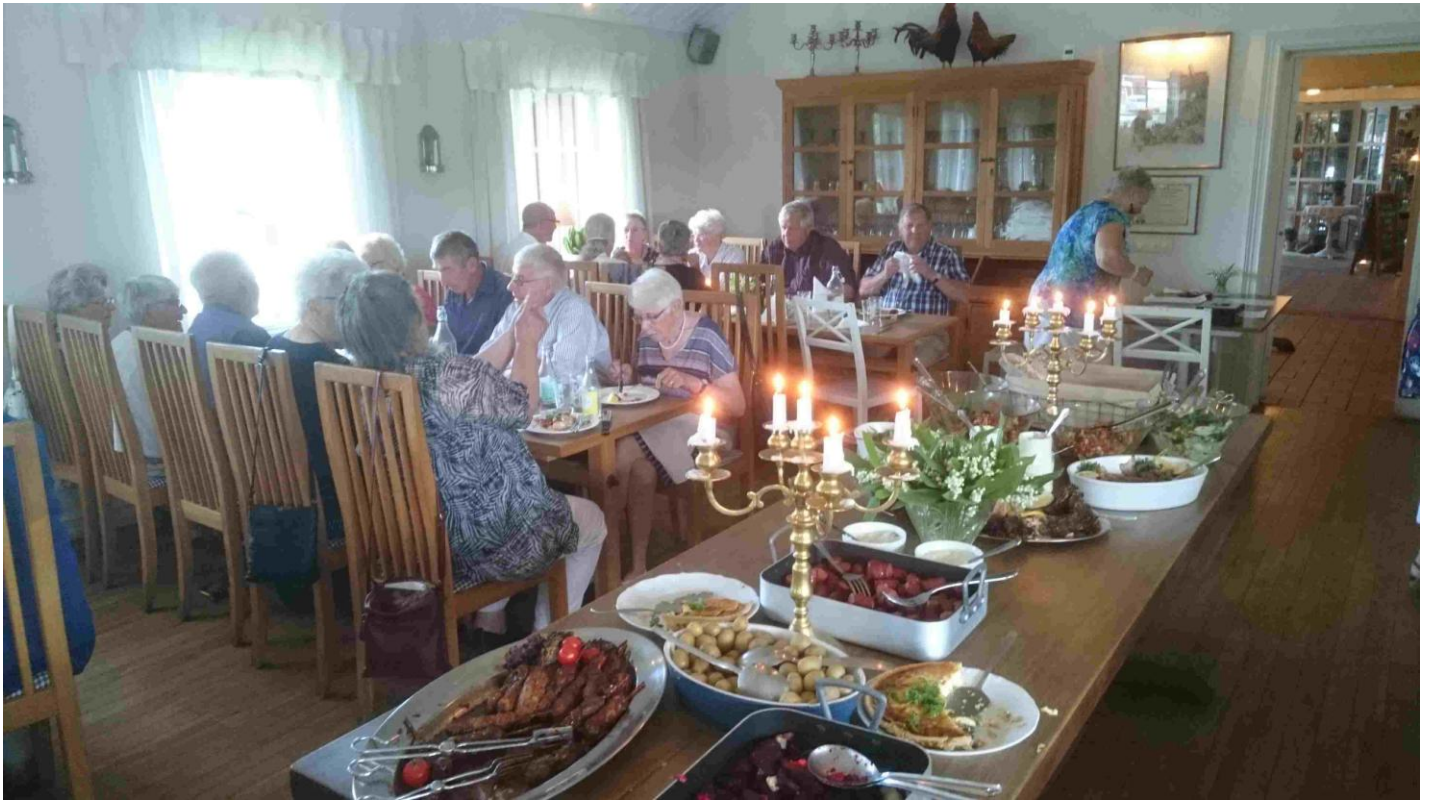
Medlemmar i SPF Tjustbygden.