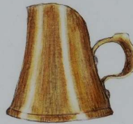
Det krona brännvinsmålet. En dubbelmjölk = 1/16 krona. The measured brandy measure. A double milk = 1/16 pot.