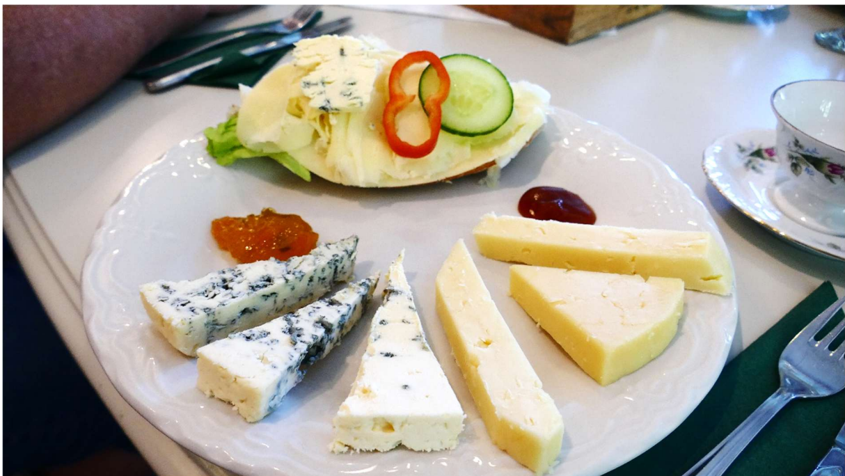
Sex olika sorters ost med tillbehör provades.