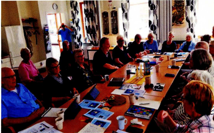
Datastudiecirkel i Seniorcenter hösten 2019

Jag har nu varit ordförande i Tre Äss i 15 år, så det känns bra att sluta. Det har varit trevliga och delvis intensiva år, men med så många positiva människor i vår förening har det varit stimulerande. På dessa år har medlemsantalet ökat med ca 70 personer, vi är nu 200 medlemmar, men vi har tappat några stycken de senaste 2 åren. Pandemin har gjort att vi inte kunnat ha flera aktiviteter vi brukar ha. Under de här åren har vi rest en hel del; alla landskap från Skåne i söder till Dalarna i norr har besökts, liksom Norge, Danmark och Tyskland. Därför känns det skönt att vi kan ha en resa nu i vår.