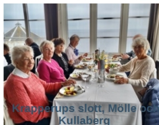
Krapperrups slott, Mölle och Kullaberg