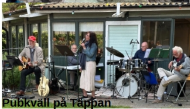
Pubkväll på Tappan