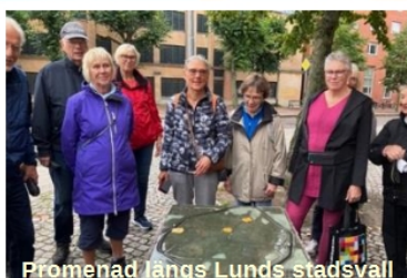
Promenad längs Lunds stadsväll