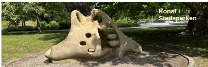
Konst i Stadsparken