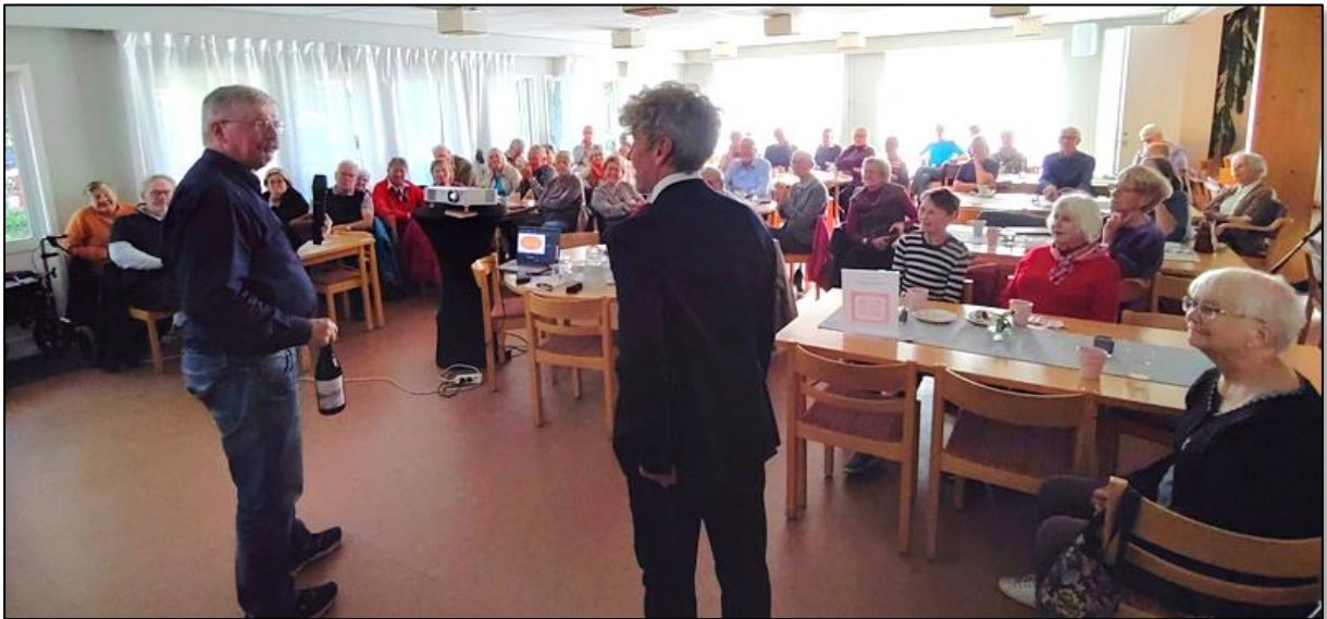
Pereriks besök uppskattades mycket av oss 47 deltagare.