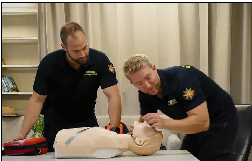
Kontrollera om personen är kontaktbar.

Klick på länken ovan för att se hur HRL utförs på barn.