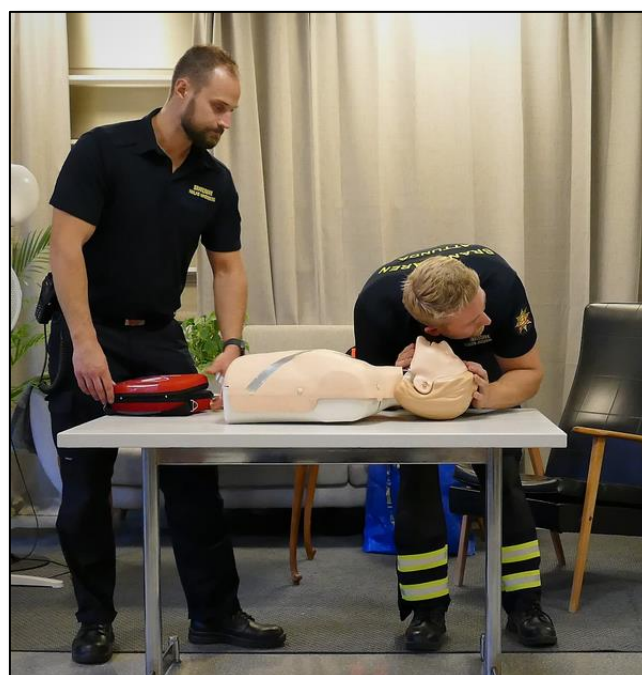
Undersök om personen andas.