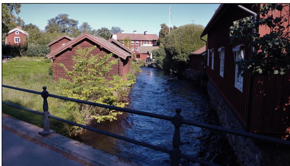
Omgivningarna går inte heller av för hackor.