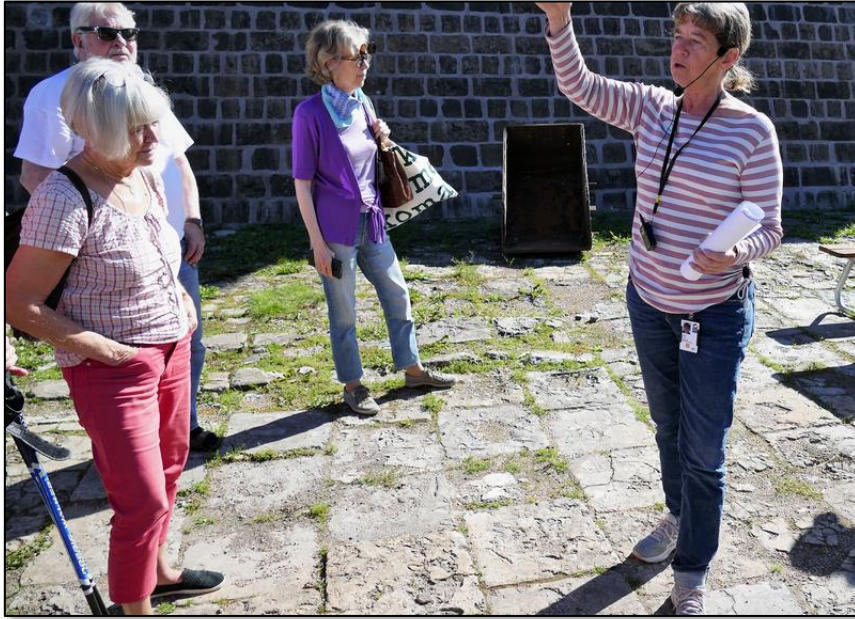
Vi delades in i två grupper med varsin guide.