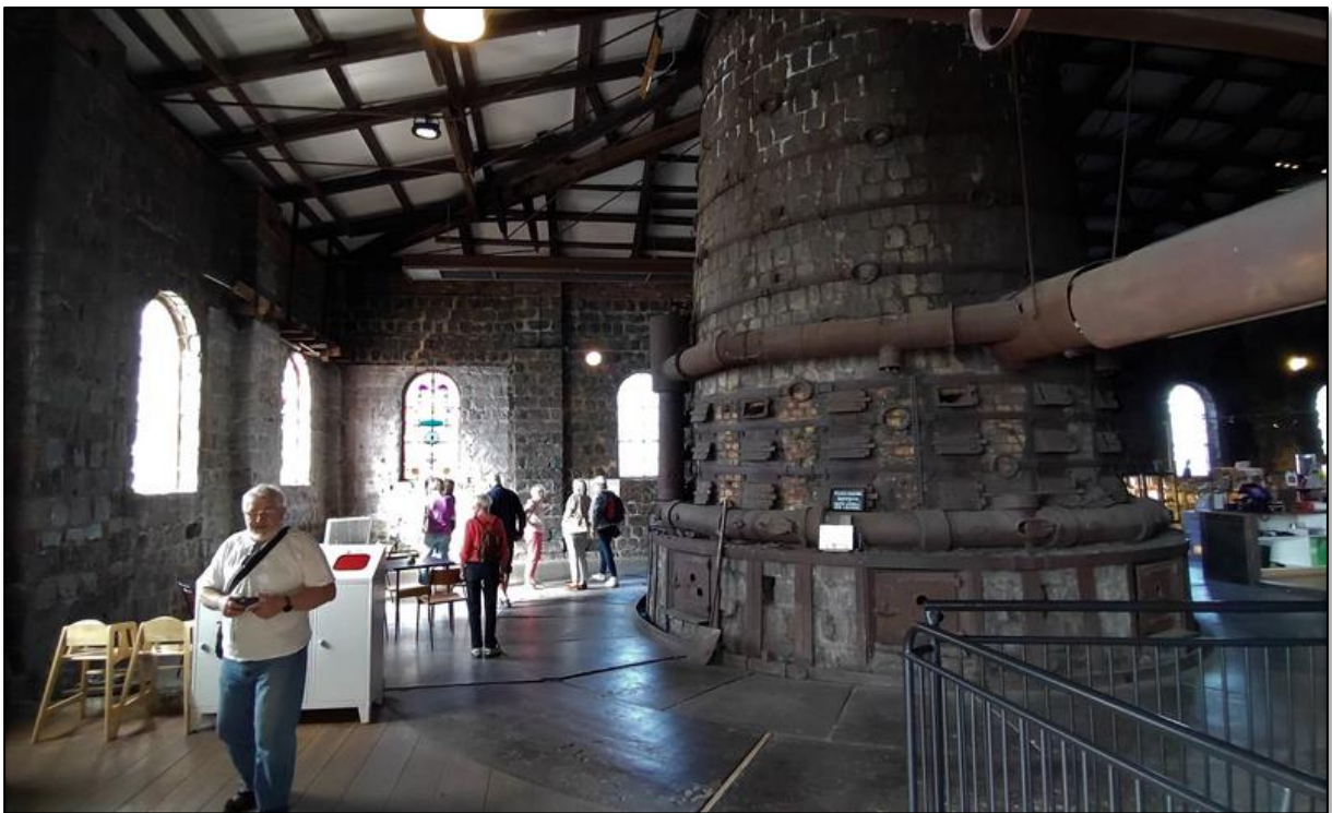
En våning upp ser vi en del av en imponerande masugn.

I Avesta har det funnits sex martinugnar. De som finns kvar är 2:an och 3:an. I martinugnarna smältes tackjärn och skrotjärn under syretillförsel. Under processen tillsattes ytterligare ämnen som påverkade järnets egenskaper. Produkten man fick fram kallades stålgöt.