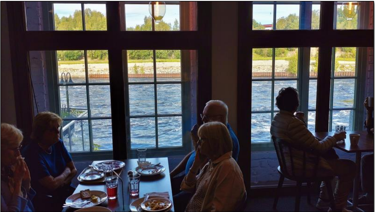
Härlig utsikt över Avestaforsen.