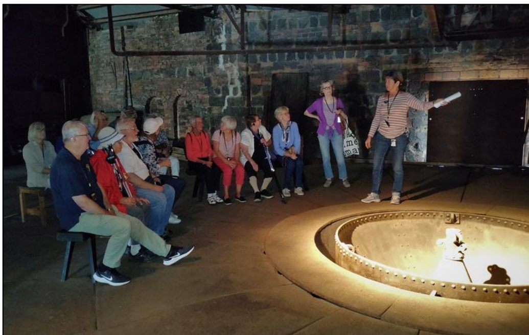
Här på fjärde våningen syns toppen av en masugn där järnmalm, träkol och kalk mättes upp och sedan släpptes ned i ugnen för att smältas.