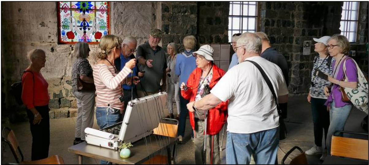
Guiden delar ut audioguide-utrustning till alla.