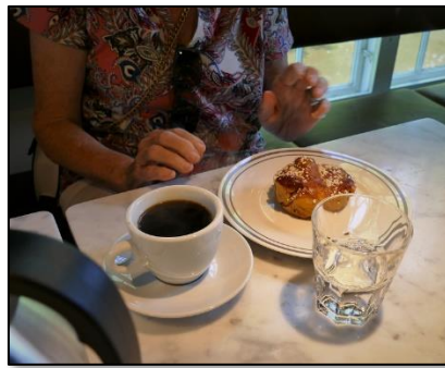
Kaffet med jättebulle var framdukat när vi kom in. Så bekvämt.