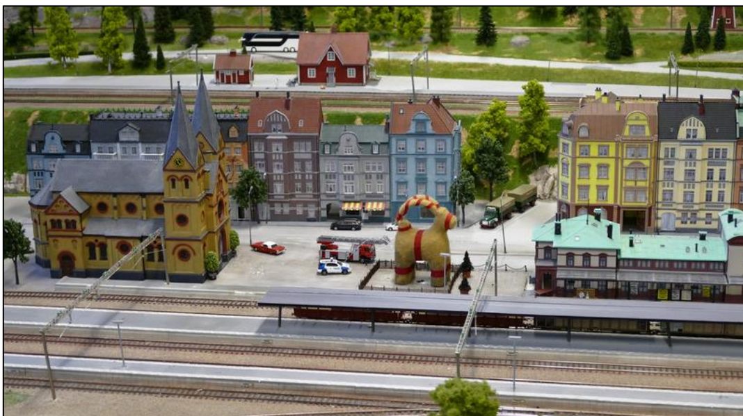
Centralstationen och Bocken i Gävle.