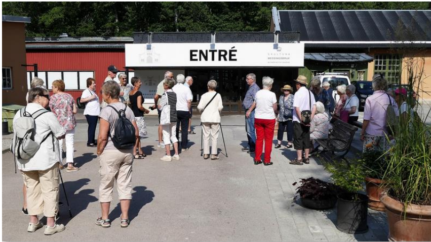
Vi var litet tidiga och fick vänta några minuter innan Bistro Bruket öppnade sina portar.