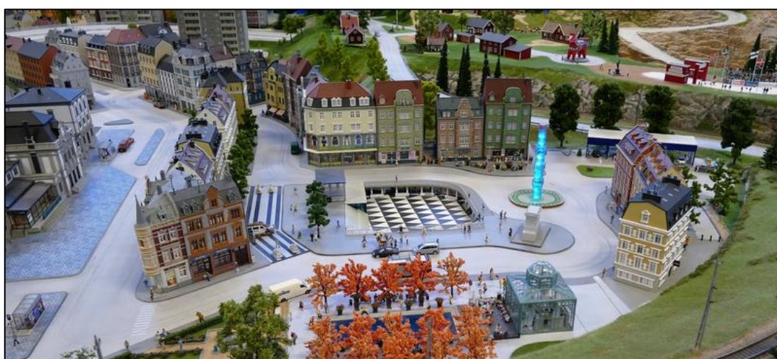
Sergels Torg med obeliskens och Plattan.