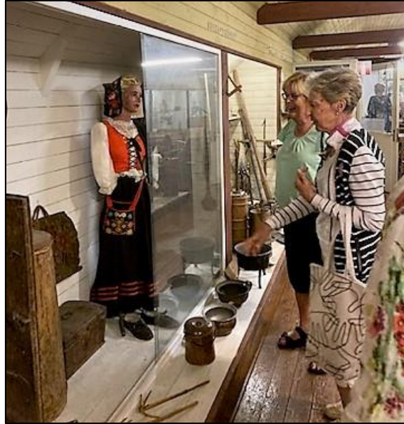
Hembygdsmuséet på övervåningen.