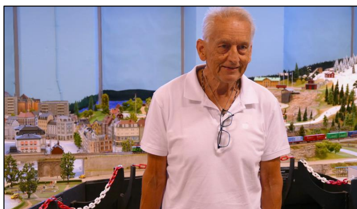
Vår ciceron vid anläggningen.