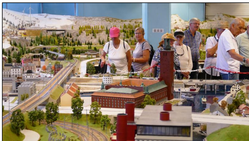
Stadshuset i Stockholm.