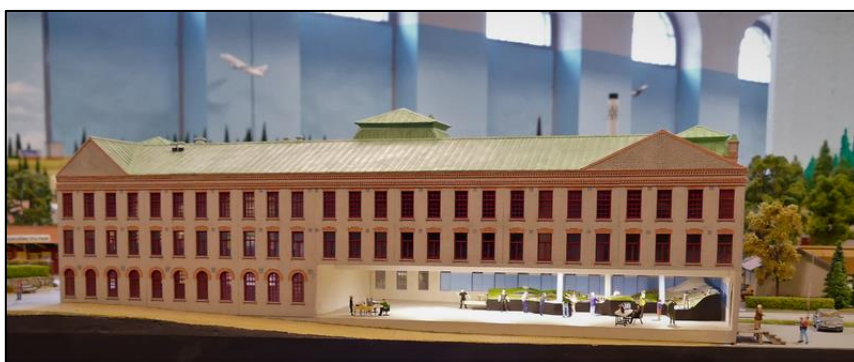
Kungsörs Bleckkärlsfabriks industribyggnad där museet självt syns i bottenvåningen.