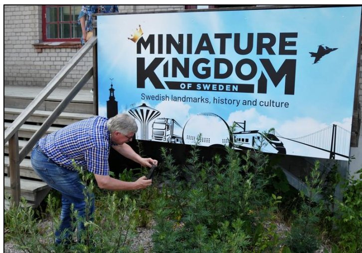
En av medresenärerna verkade föredra guds fria natur framför kungadömet.

Det tredje stoppet visade sig bli "Miniature Kingdom of Sweden", en miniatyranläggning med landskap, byggnader, modelljärnvägar, fordon och människofigurer, inspirerad av flera miljöer i Sverige. Anläggningen som är byggd i skala 1:87 finns i den nedlagda Kungsörs Bleckkärlsfabriks industribyggnad i Kungsör.