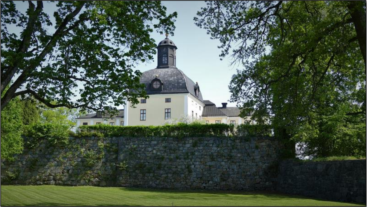
Tornet i dag med resterna av muren som ursprungligen var 6 meter högre än idag eftersom material från den användes till grunden vid utbyggnaden av slottet på 1600-talet.