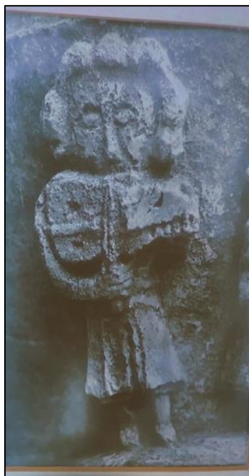
Relieffigur från 1350 på Källunge kyrka, Gotland.

Det finns belägg för att nyckelharpan har använts i Sverige sedan 1500-talet, och kanske ännu tidigare. Det allra äldsta belägget kan dateras så långt tillbaka i tiden som till 1350. Det består av en relieffigur på porten till Källunge kyrka på Gotland. Figuren spelar ett instrument som kan vara en nyckelharpa.