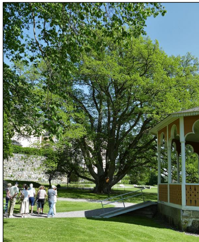
Fantastiskt stor ek mellan slottet och orangeriet.