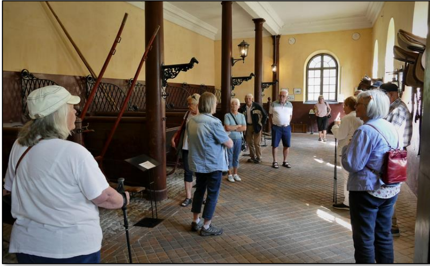
Spannstallet som byggdes på 1830-talet. Här förvarades slottets vagn- och ridhästar. I vagnsalen (följande bilder) förvarades vagnar och slädar.