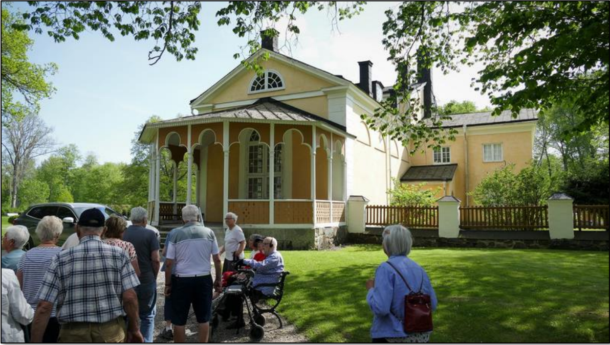
På väg till fikat i orangeriet.