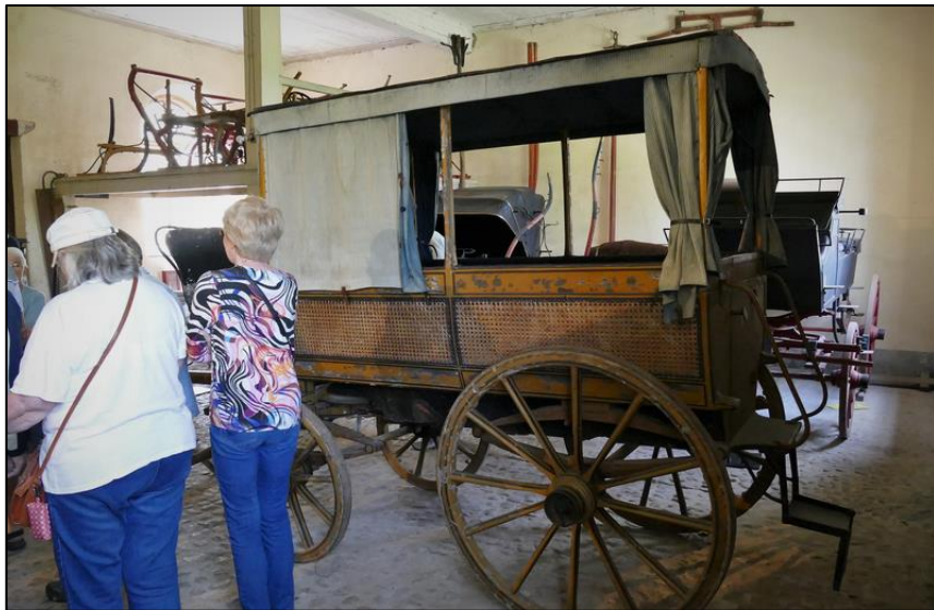
Vagn som bland annat tjänstgjort som "buss".