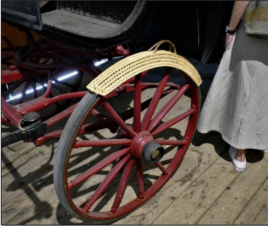
Flätat skydd mot nedsmutsning av passagerarnas kläder vid på- och avstigning.