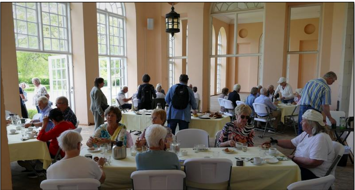
Orangeriet kan man hyra för privata tillställningar.