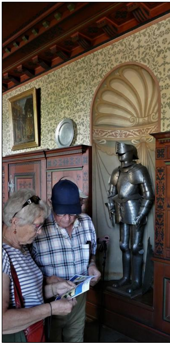
Interiörbild från slottsentrén.