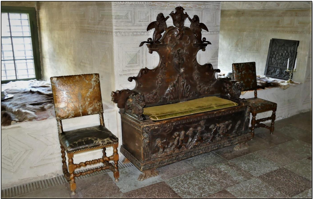
Guidningen inleddes med besök i det fängelse där Erik IV hölls inspärrad tills han dog av ärtsoppa innehållande arsenik. Bilden tagen i ett av de tre rummen.