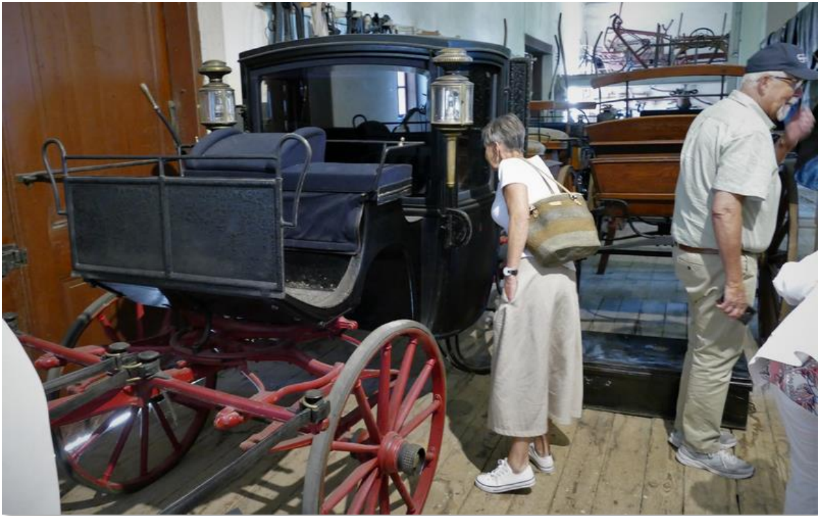
Vagn som bland annat utnyttjats vid filminspelningar.