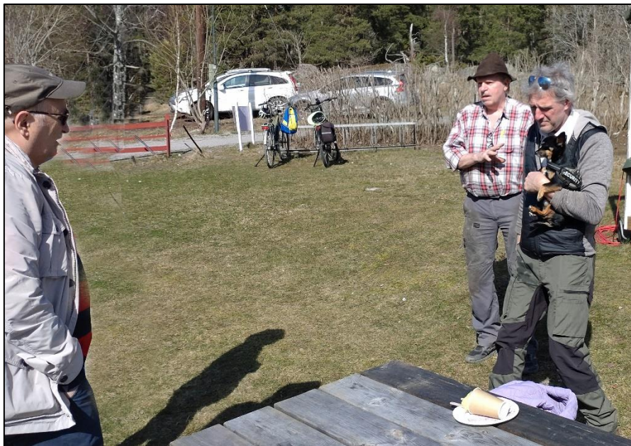
. . . och svarade på frågor.