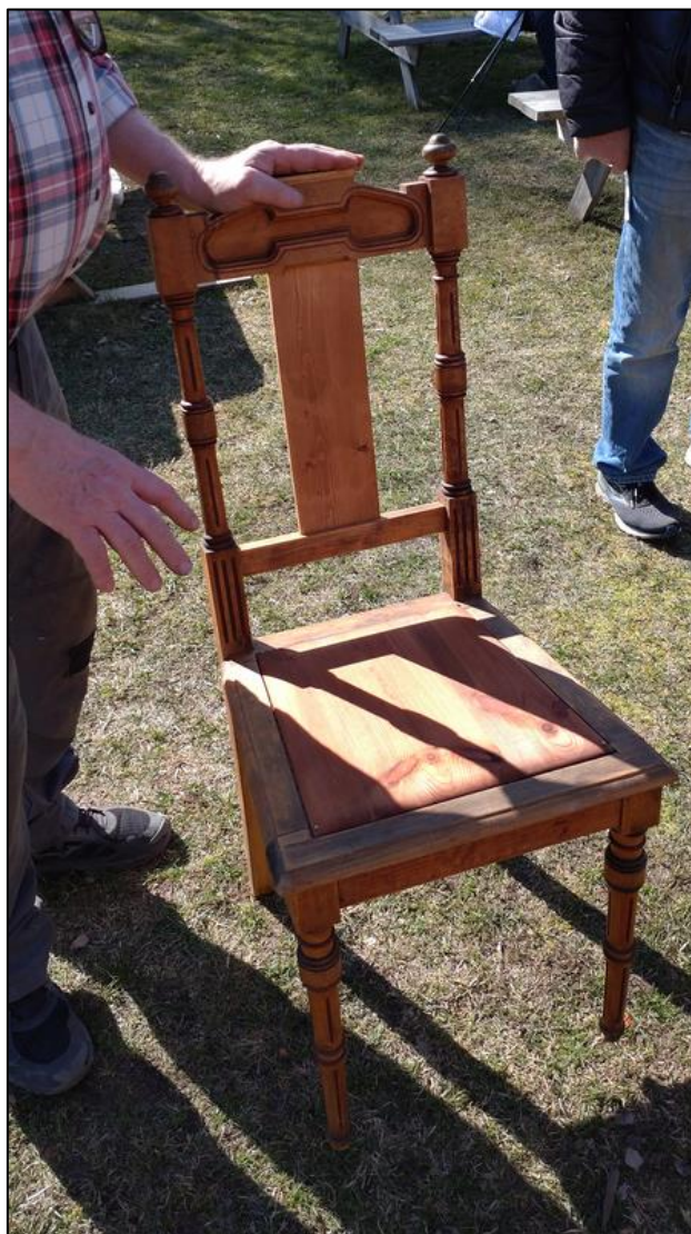
Ronny med en vacker stol som han renoverat. Förmodligen en Östervåla-stol.