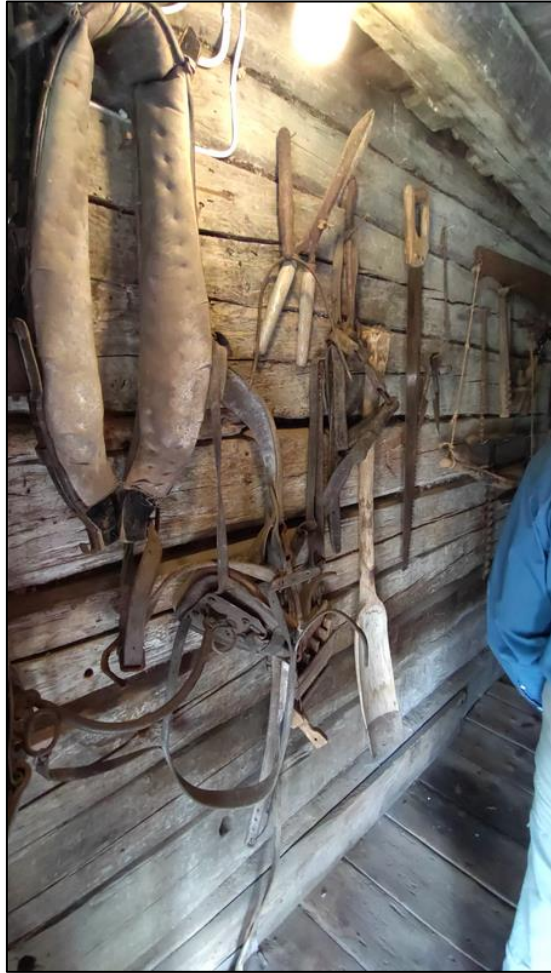
I huset finns många gamla verktyg och andra redskap.