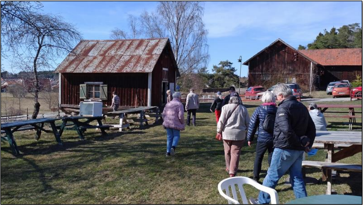
Här fortsätter vi ned till det andra huset som bland annat verkar ha fungerat som höns hus. I dag används det som verkstad vid renoveringsarbetet.