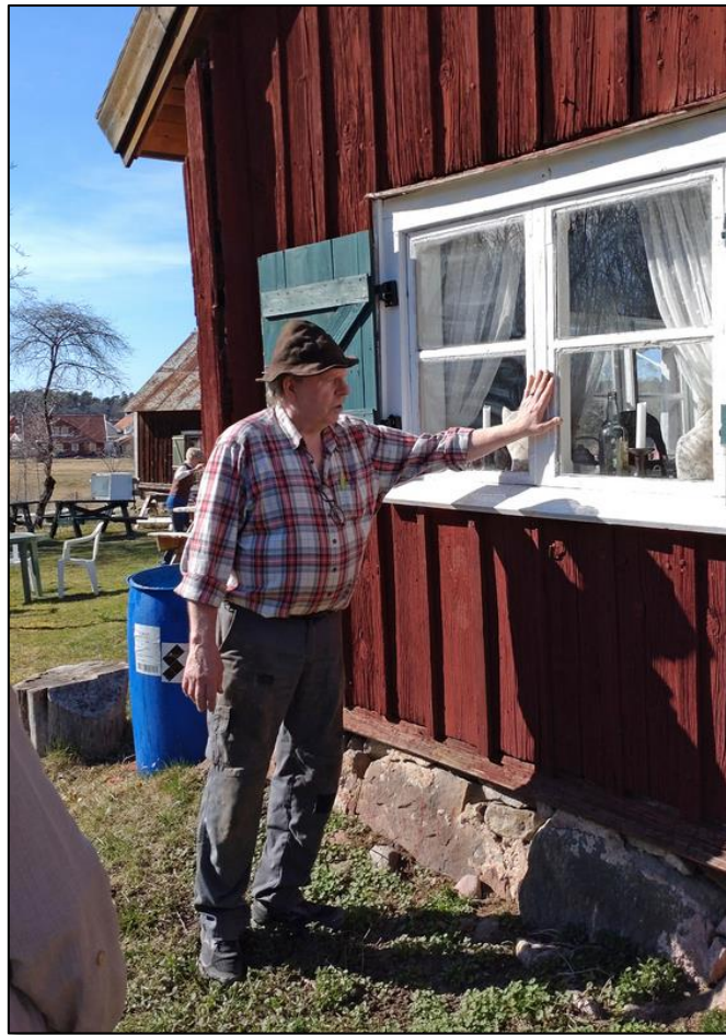
Ett av de fönster som Ronny har restaurerat.