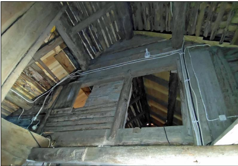
Inga tomtar på loftet här inte.