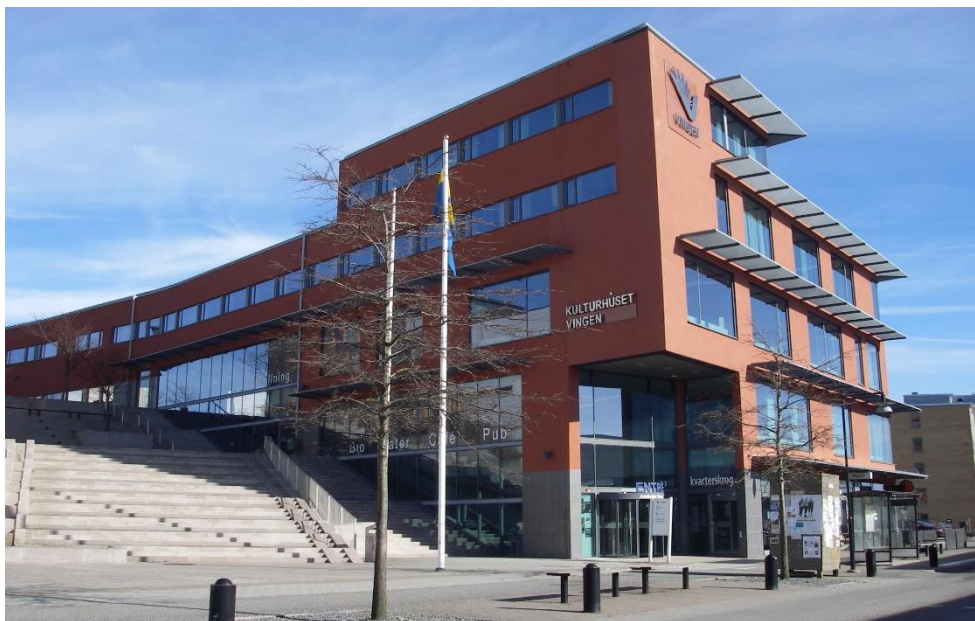
Kulturhuset Vingen i Amhult

Månadsmöten: första måndagen i månaden kl. 10.30 -12:30 Plats: Kulturhuset Vingen, Amhults Torg