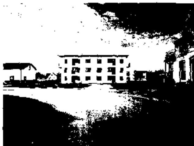
Stationsgården i Getinge

HFAB bygger seniorlägenheter 65++/60+ på olika platser runt om i Halmstad. Nu närmast i Getinge och på Nissastrand .