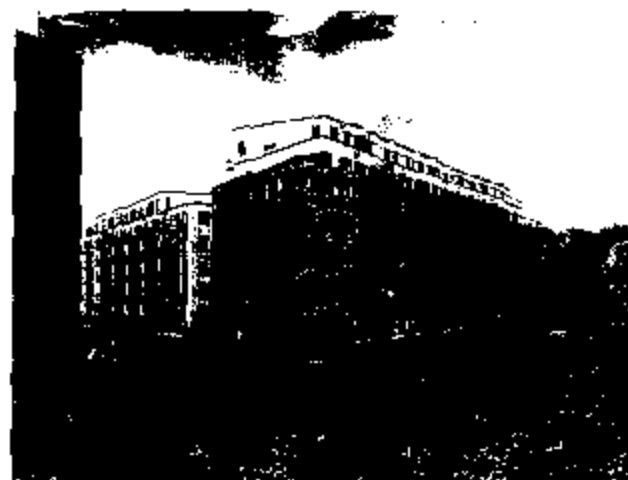
Kubisten, en del av Kv Järnmalmen på Nissastrand