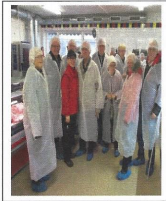
Studiebesök på Carlströms chark