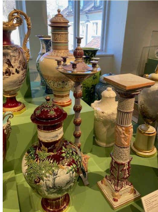
Vaser och piedestaler