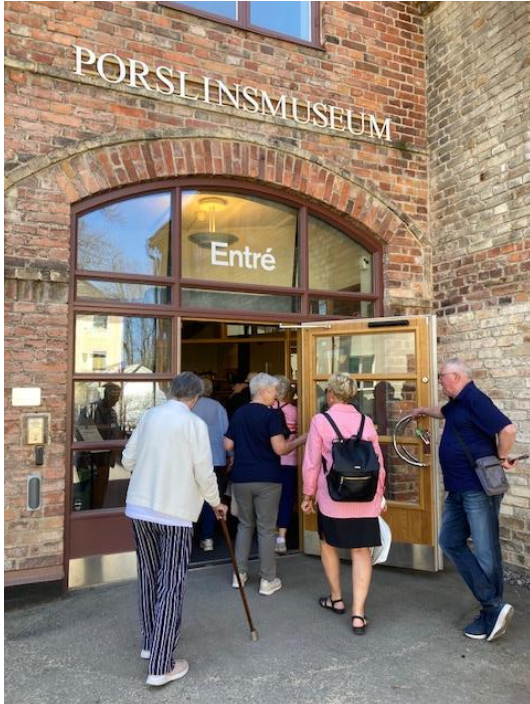
Ove var portvakt.