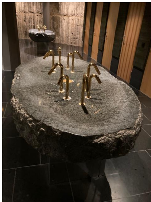
Artipelags vackra tvättställ

Tack alla för en fin och minnesvärd resa!