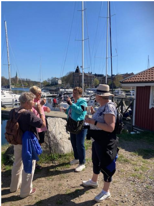
Strålande sol vid förmiddagskaffet i Gustavsberg.