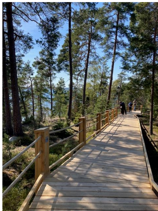
Fint promenadstråk vid vattnet