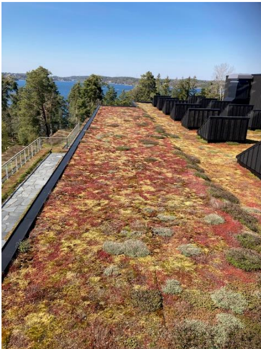
Taket på Artipelag

Resan fortsatte till Artipelag – internationell mötesplats för konst, god mat, events och aktiviteter, vackert belägen i Stockholms skärgård.