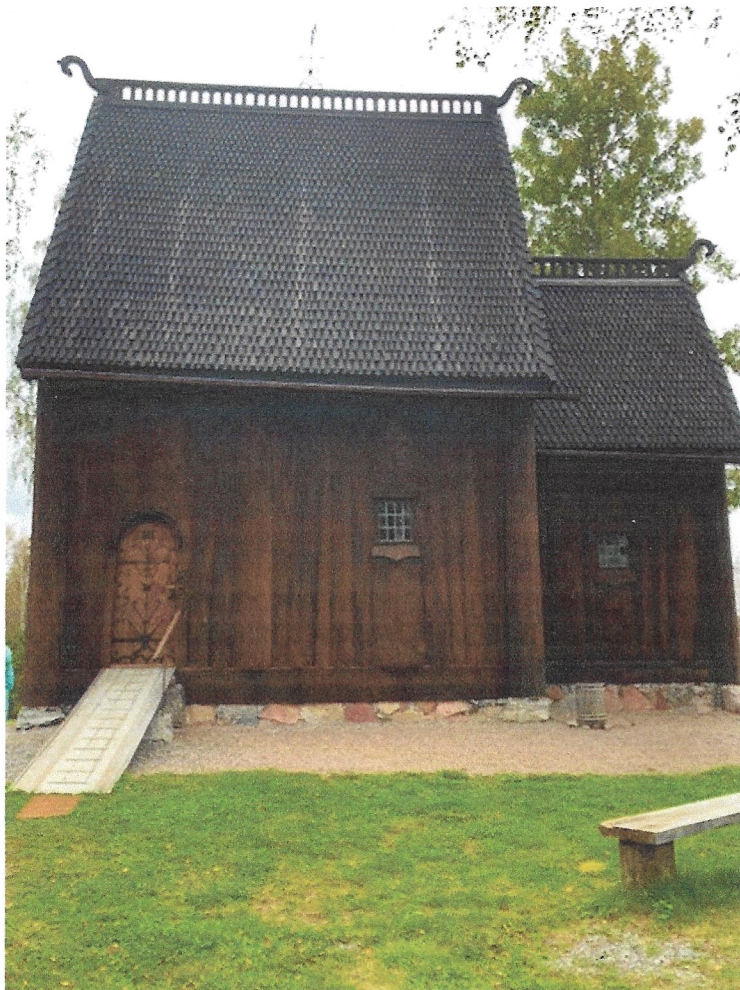
Stavkyrkan i Oklagård, Ockelbo