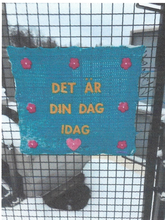
Boulognerskogen Det är din dag idag