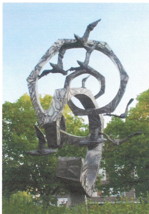
Söder: Tanken är såsom fågeln fri, Per Nilsson Öst 1973.