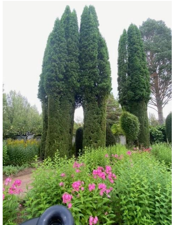
"Fantasi"-träd på Hildasholm