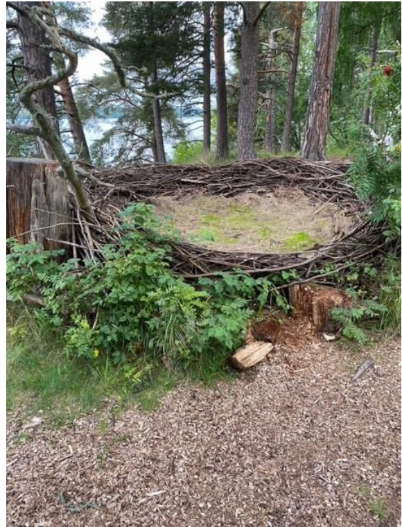
Fågelbon på Hildasholm