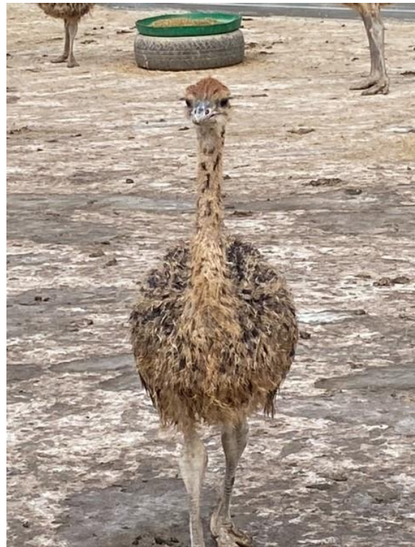
”Fröken” struts är ute och spatserar