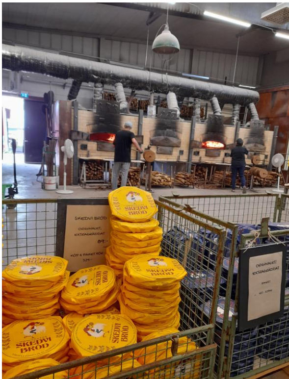
Produktionslokaler Skedvi bröd