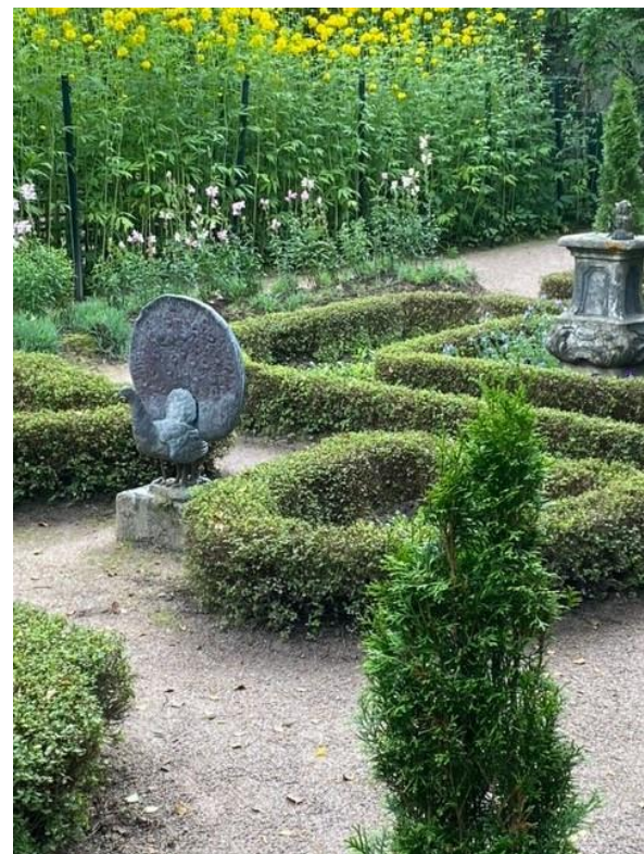
Hildasholm - historiska huset