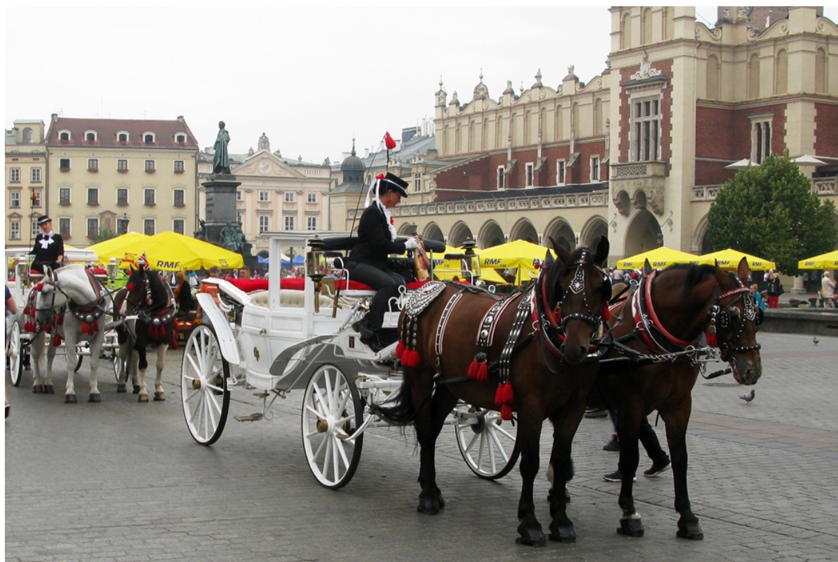
Resa till Krakow i Polen