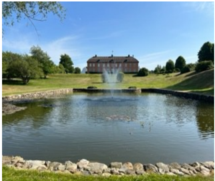
Resan avslutades med en promenad i Maltesholms slottspark.