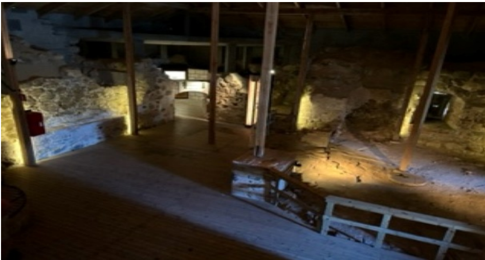
I Lillöhus borgruin fick vi en intressant inblick i 1200-talets inredning och liv.