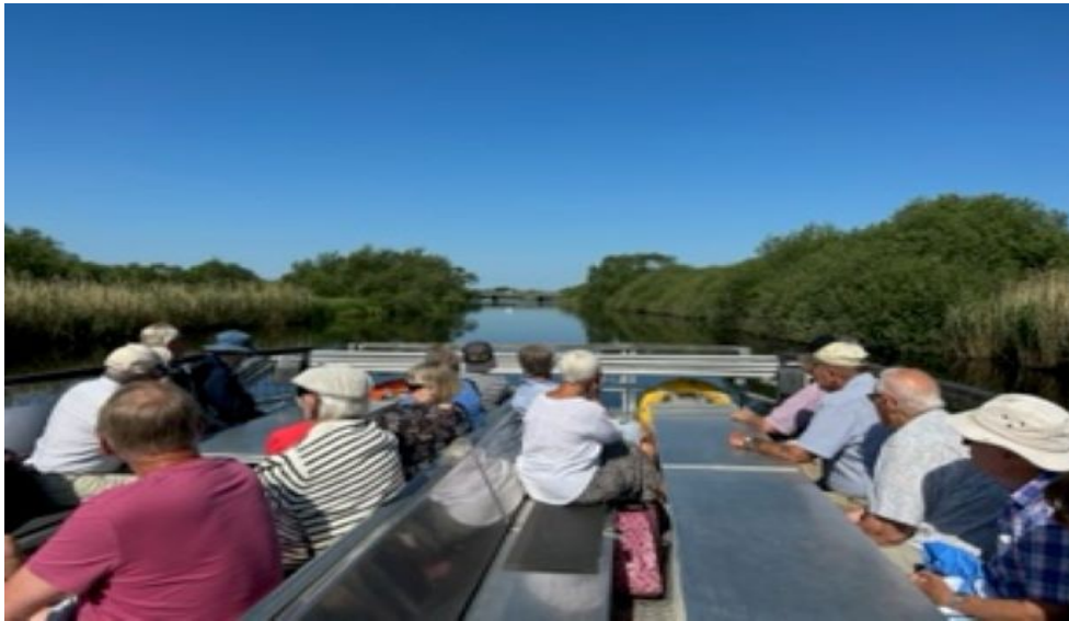
Vi för ut på Helge å med Safaribåten