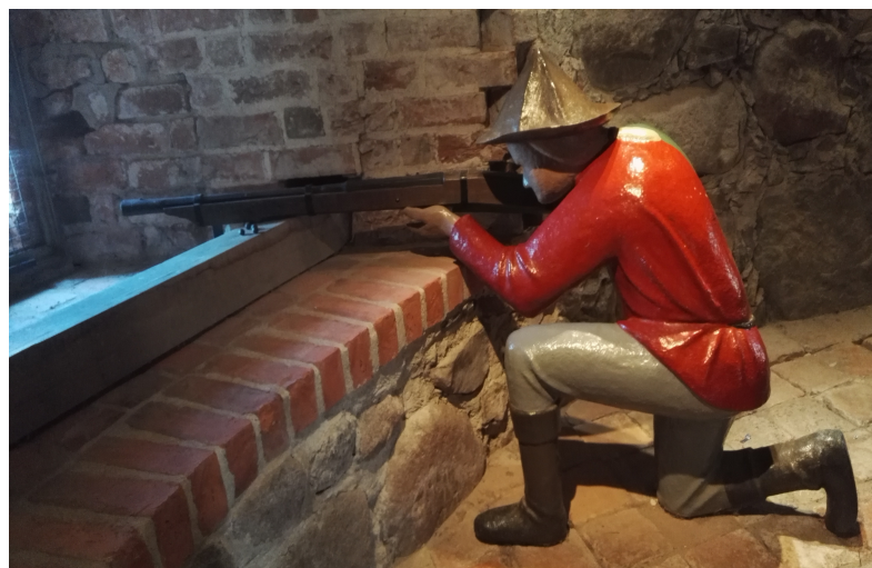
I bottenvåningen fanns bl a skottgluggar för hakebösseskyttar.