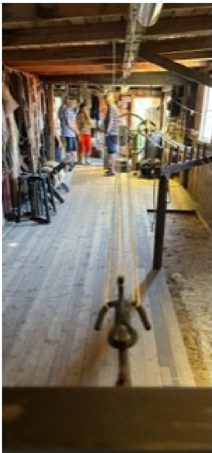
Hos Sankta Annas Gille i Åhus fick vi lära oss att tillverka rep av hampa med hjälp av bl a en "träskalle".