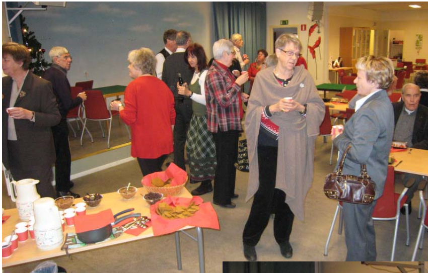
Inledande mingel med glögg, pepparkakor och andra tillbehör...