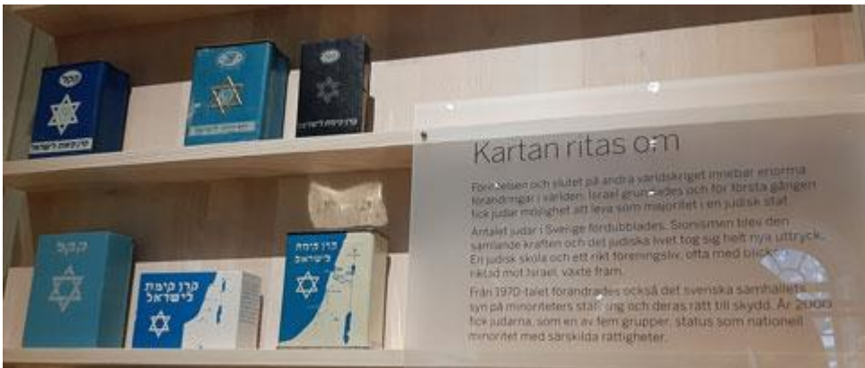
Förintelsens minnesdag är förstås mycket viktig även för judarna i Sverige och oss alla.

"När jag var 11 år stöckades jag till tvångsarbete på ett textilbruk i Östernäs. Det var här som jag återigen bekräftades både den gula Davidstjärnan som är en. Stjärnan skulle egentligen karaktärisera och skydda mig, men jag ville inte göra det. I stället fäste jag tvångs armbanden på kroppen genom att trä upp dem på en välkänd nattliga till fortfarande yngre och man vittar nog. Så hängde hela tiden den Davidstjärnan som en skräcklig, sten, smärta knäppt synlig baka."