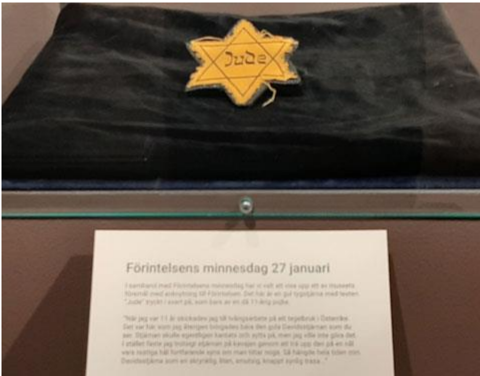
En hemsk minnesbild från nazisttiden.