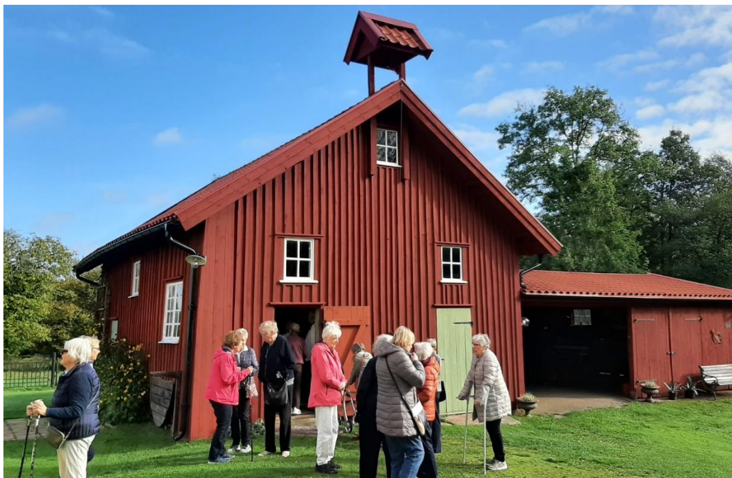
Vi fick givetvis också inspektera uthuset med det sjusitsiga dasset.