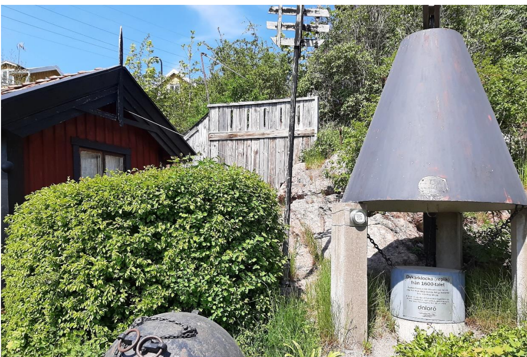
Där finns en dykarklocka av 1600-talstyp.