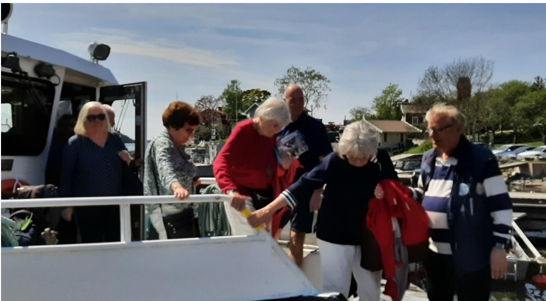
Vi lämnade båten och gick bara en kort sträcka i hamnen.