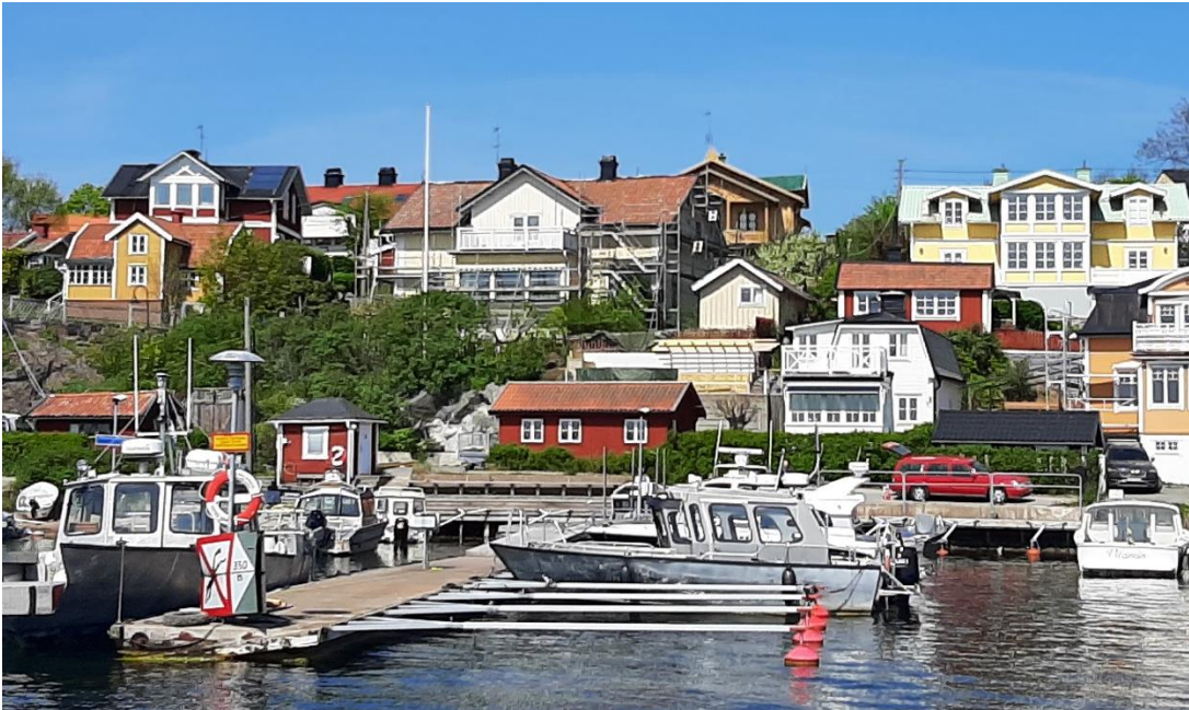
Marken på Dalarö är verkligen utnyttjad till bristningsgränsen.