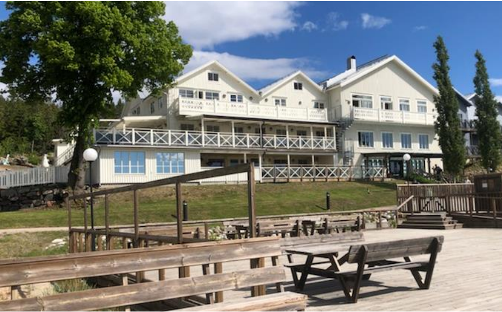
Därefter var det lunch på Ulvö Hotell.