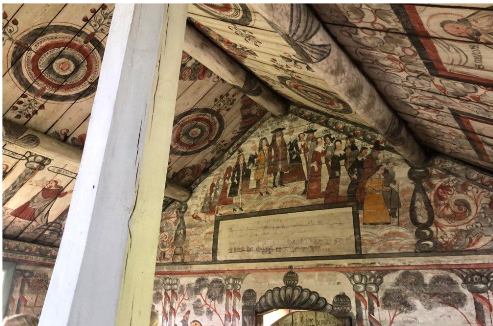
... ett träkapell byggt 1622 med många vackra målningar på väggar och i tak.