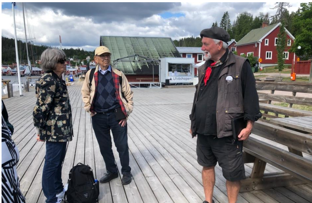
På Ulvön, ett fiskeläge känt från 1400-talet, blev vi guidade av en äldre Ulvöbo, som berättade om ön och fisket.