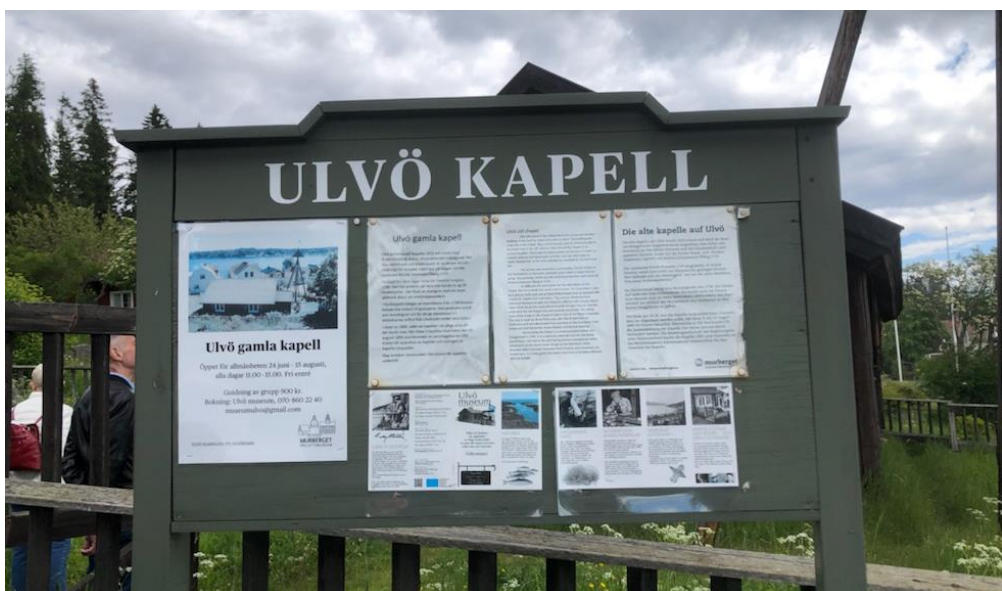
Vi fick också besöka Ulvö kapell ...