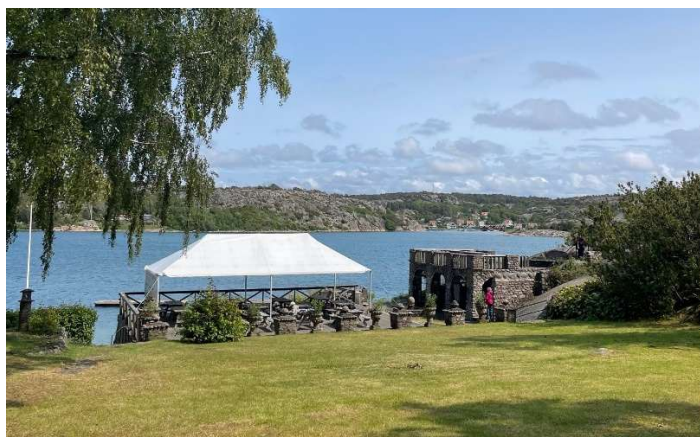
Figur 1: Bilder från utflykten till Alaska