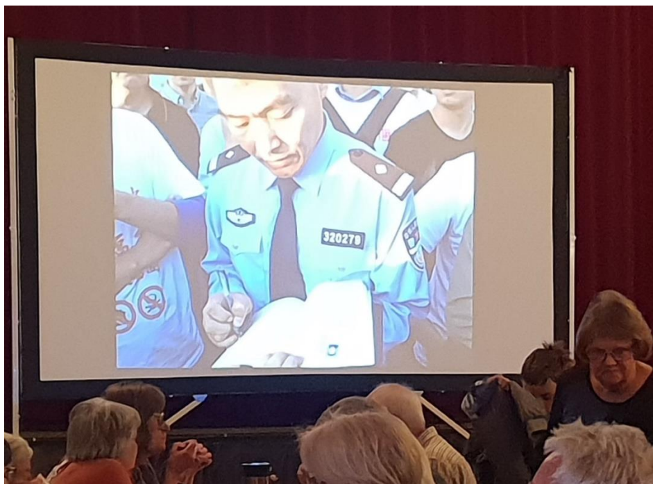
Poliser och poliser överallt.