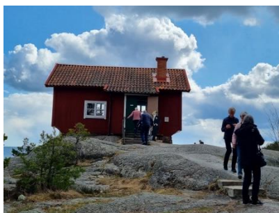
Ateljén & skrifvarstugan

Vidare mot Grisslehamn och Albert Engströms gård och en på skäret kombinerad ateljé och skrifvarstuga. Två guider mötte upp för gemensam information före vi uppdelades i två grupper för varvad guidning hem och skrifvarstuga. I hemmet kunde man se möbler och andra inventarier färgat av A.E. resor i världen och mitt i detta också andra influenser från t.ex. andra konstnärshem. Stigen till ateljén var kantad av blåsippor. Ateljén fungerade också som sjömärke, två sidor ut mot havet var därför målade i vitt till skillnad från de andra två röda sidorna. Där kunde man, förutom den vidunderliga utsikten, se det mesta som färgade A.E. liv: sälskinnskajak, roddbåt från Nordland i Norge, konstverk av olika slag teckningar, målningar med mera. För alla gästers (?) trevnad också en hembränningsapparat. Hemmet och ateljén är museum och förvaltas av Engströmsällskapet. A.E. föddes i Småland 1869 och avled 1940. Han blev medlem både i Konstakademin och Svenska Akademin. Efter detta en härlig lunch på Hotell Havsbaden där vi blev serverade en härlig buffé. Kan rekommenderas om man har vägarna förbi. Hemresan gick genom Stockholms innerstad för att undvika bilköer i södergående biltunnel. Vi kunde då beundra körsbärsblommorna i Kungsträdgården och fick passera Slussen via den omtalade Guldbron. Frågesport och "godispåse" på hemresan "söder om sta'n" blev en glad överraskning. Hemma igen 18.30 (efter 11 ½ timmar) efter en innehållsrik dag.