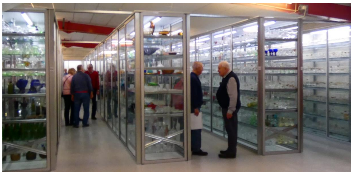
Glasmontrar i långa rader med 35 000 olika föremål från 105 svensk glasbruk. De äldsta är från 1580-talet. Det finns också 1 000 föremål från 35 andra länder.