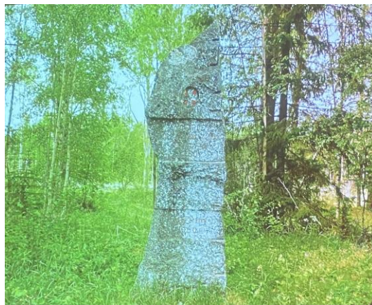
Minnessten från Digerdöden på 1300-talet