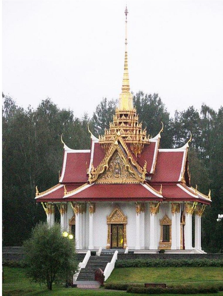
Kung Chulalongkorns tempel i Ragunda kommun