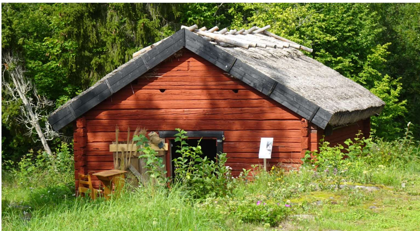
Linbastun som inrymmer ett fint museum

Ett bidrag till föreningen har lämnats av SPF Rospiggen som tack.