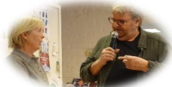
SKPF på besök