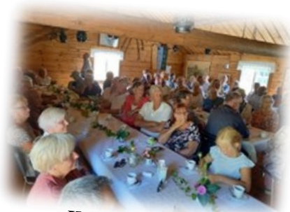
Kafferep - Ullevi