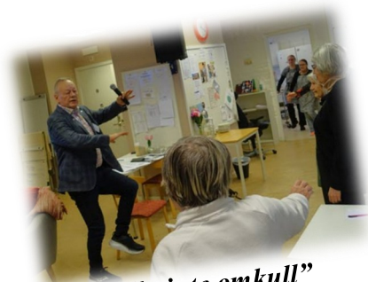
"Trilla inte omkull"