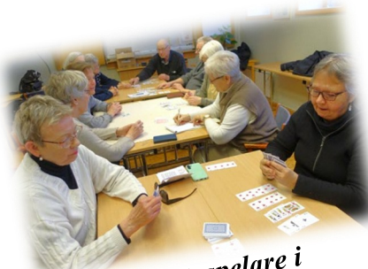
Canastaspelare i Powerhuset