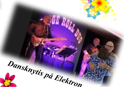
Dansknyttis på Elektron