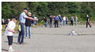
Boulturnering i Sparreholm