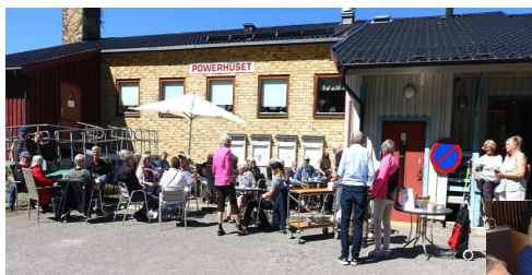
Samling vid Powerhuset efter en tipspromenad

Så här trevligt har bokcirkeln. Afternoon Tea i Cardierbaren på Grand Hôtel, Stockholm