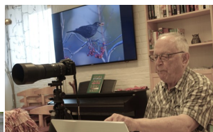
Fåglar runt knuten – och lite runt omkring