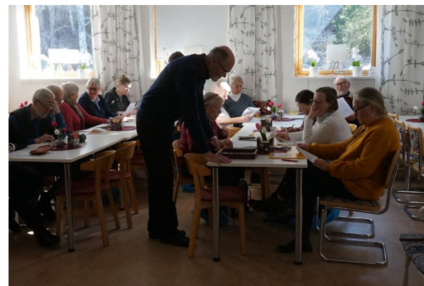
Lektion i full gång