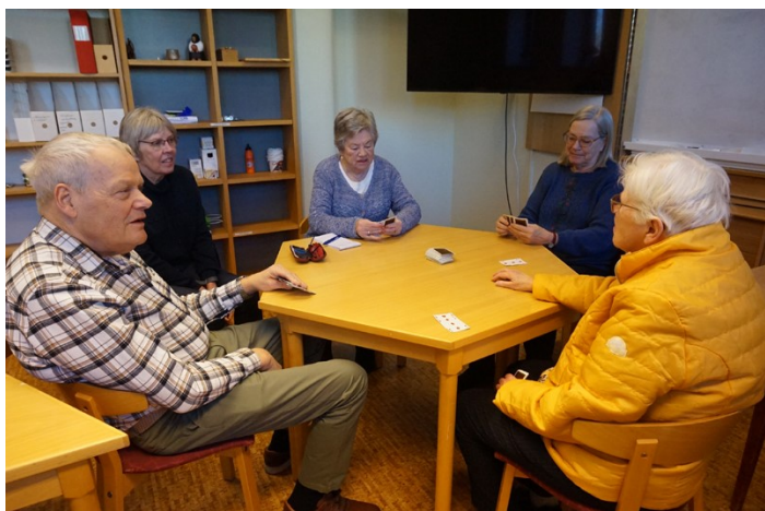
Kanastagruppern i full gång