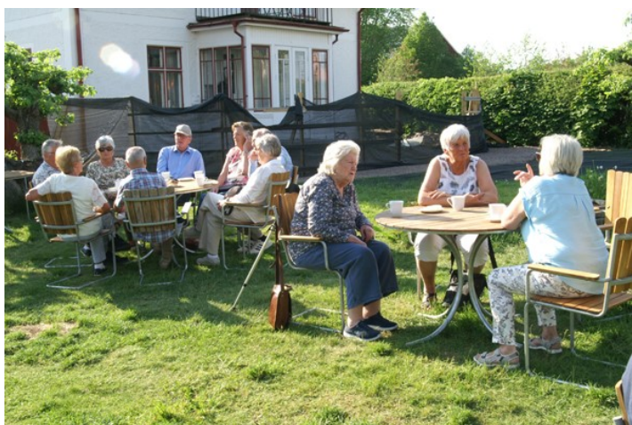
Sista stoppet på hemväg