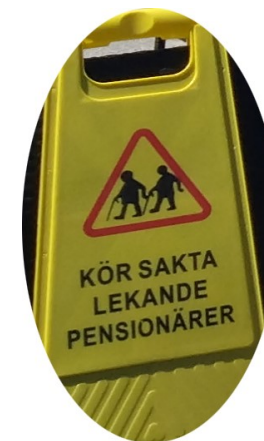
Bengt och Sture kåserar och underhåller