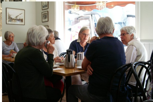
Första stoppet Haglunds kondis