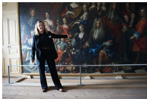
Guidning på Nynäs slott

PS. Vi hoppas kunna ordna en liknande cirkel till våren 2024 igen. Det finns ju många slott i Sörmland.