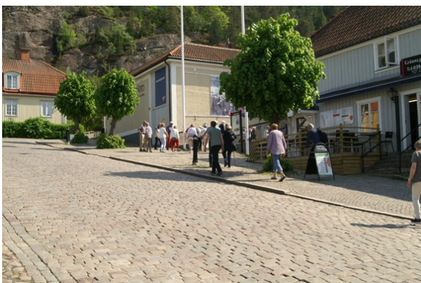
På väg till muséet