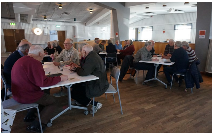
Grupparbete på funktionärsträff 24 mars 2022