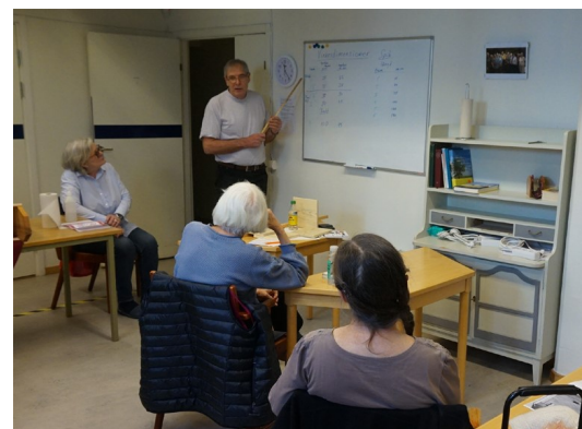
Teori-genomgång på slöjdkurs

Mer information om kurser och dess innehåll finns på hemsidan och affisch på anslagstavlan vid Powerhuset.