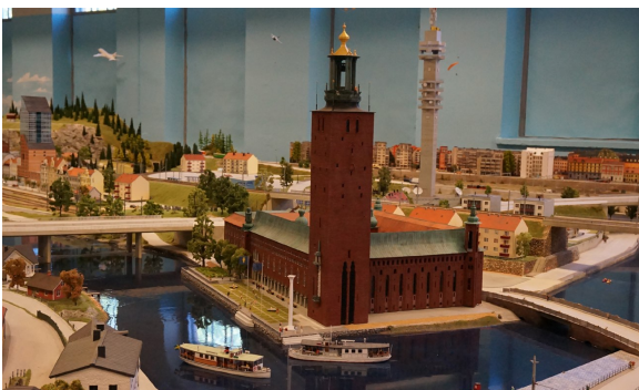
Interiörbild från "Miniature Kingdom" i Kungsör, som vi besökte på 1-dagars hemlig resa 2022