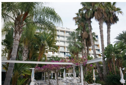
Vårt hotell - Aqua Hotel Silhouette

Hotellet i Malgrat de Mar överträffade mina förväntningar. Väldigt mycket mat (kanske alltför mycket.....) dukades upp vid frukost och middag. Vi hade alla utsikt över pooler och trädgård.