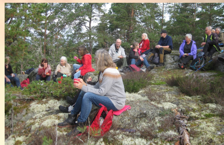
Fikapaus på Klevaberget.