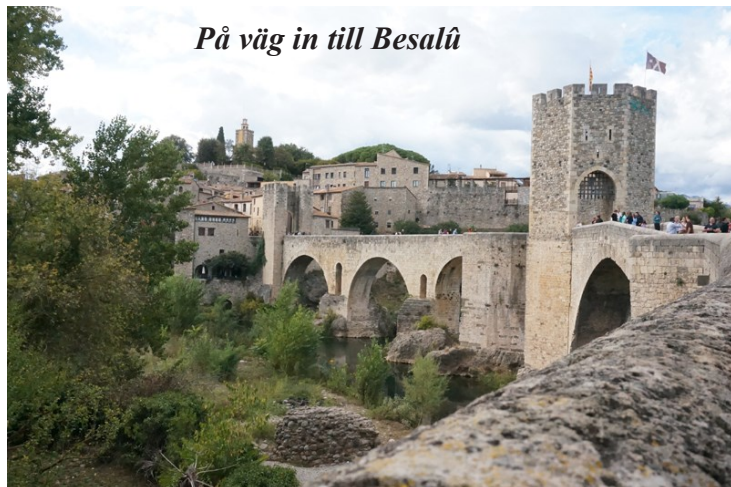
På väg in till Besalú