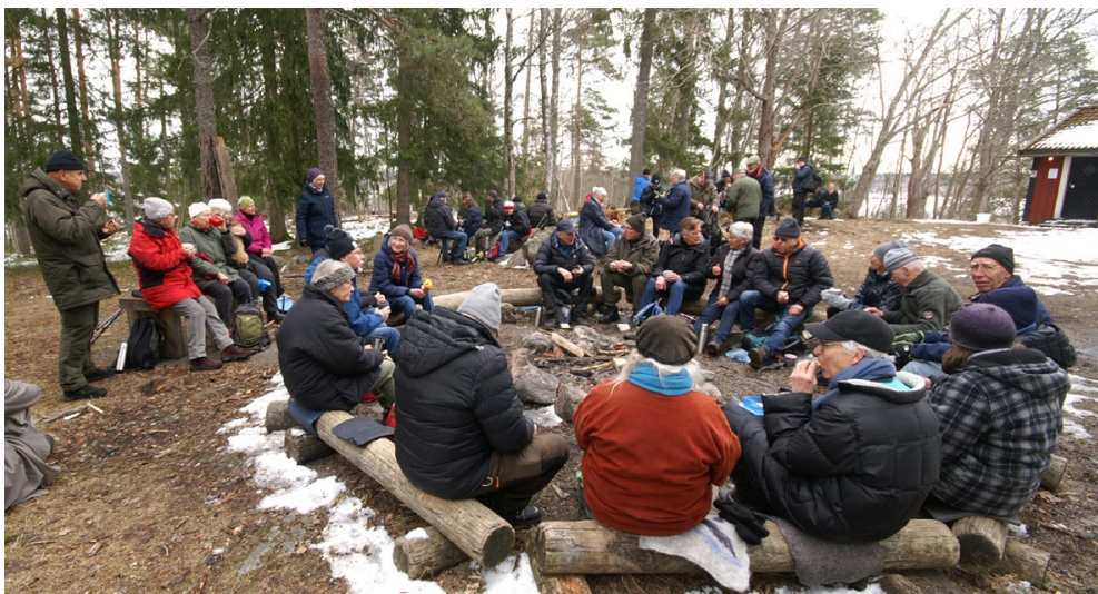
Tisdagsvandring april-23 Fika på Jagbacken