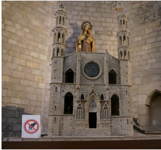
Modell av Santa Maria del Mar - finns i kyrkan