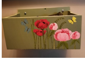
Slöjd o Målning kombinerat