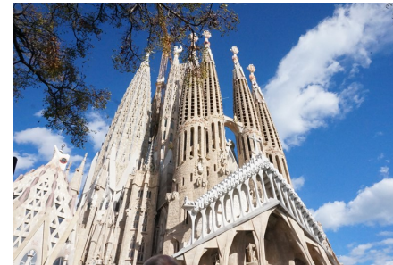
La Sagrada Familia, Barcelona