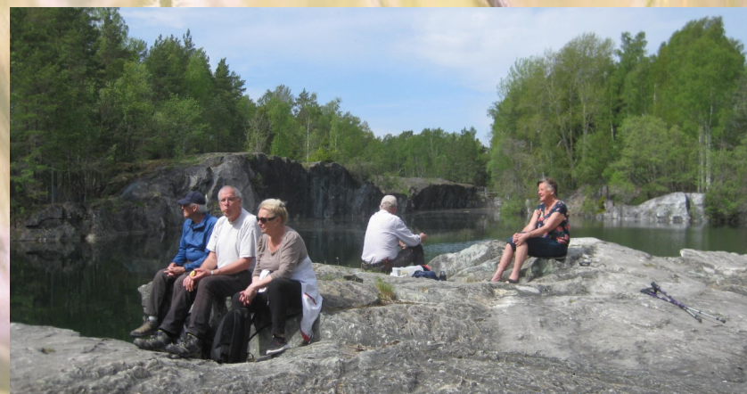
Vilopaus vid gamla kalkbrottet.