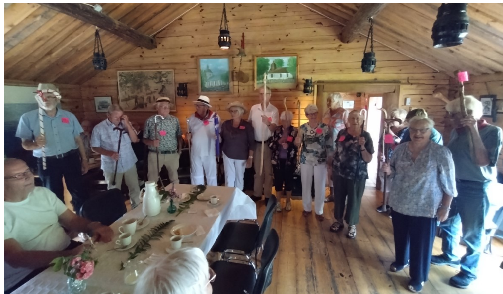
Käppparad på kafferepet i Ullevi Hembygdsgrd 2023