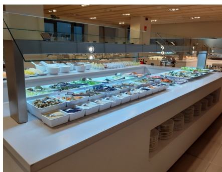
Väldigt mycket mat - allt i bufféform