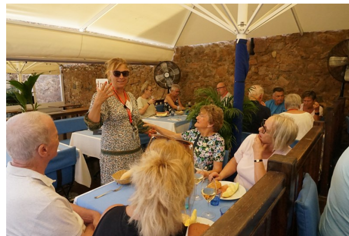
Lunch i Tossa del Mar

Jag försökte hålla henne sällskap, men jag märkte att hon blev mycket trött.