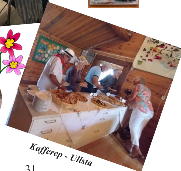
Kafferep - Ullsta