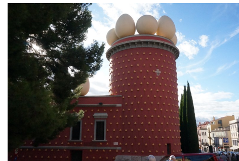
Salvador Dalimuseet i Figueres