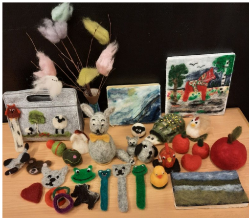
Man kan göra mycket med nål-tovning