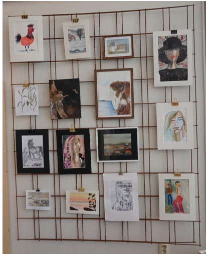
Målarkursens medlemmar är produktiva