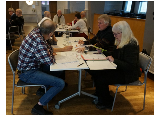
Funktionärsträff 2023 - Vi jobbar hårt.