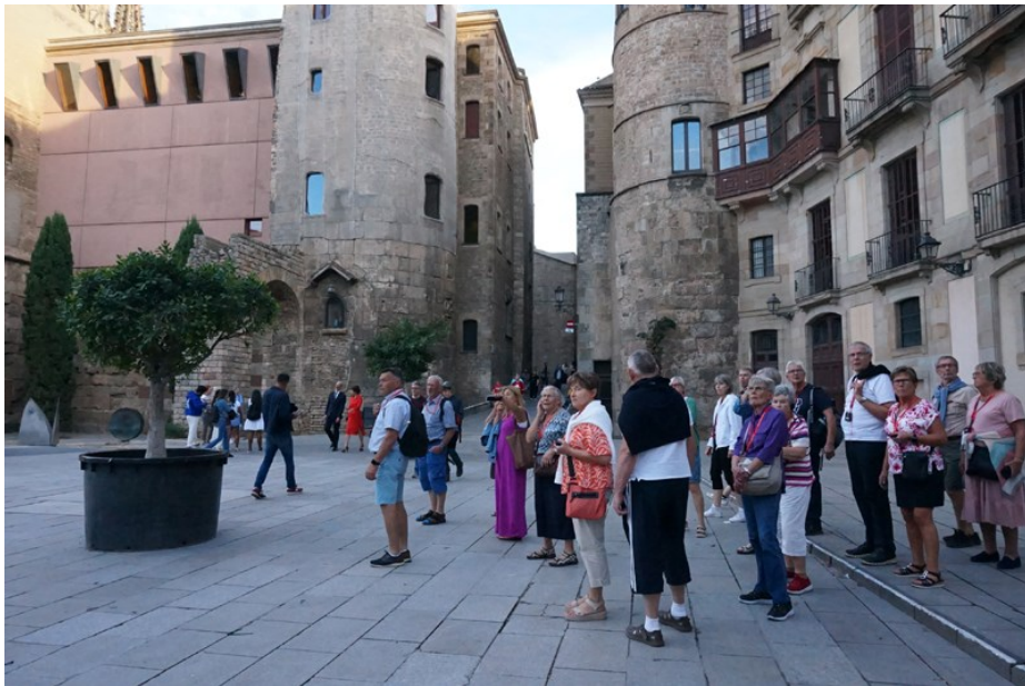
På stadsvandring i gamla stan. Barcelona