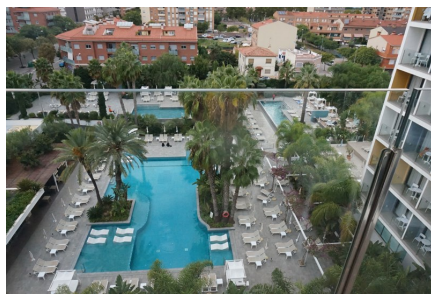
Utsikt över poolerna