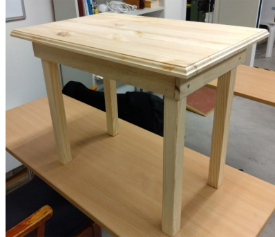
Vackert slöjdat bord