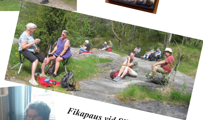
Fikapaus vid Sillens strand